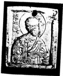
Фото 5. Иоанн Богослов. Стеатит, резьба. Икона начала XIII в. Музей истории Киева