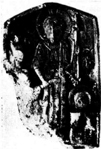
Фото 9. Воскресение Христово — Сошествие во ад. Стеатит, резьба. Икона начала XIII в. Ивано-Франковск. Областной краеведческий музей