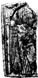
Фото 2. Георгий-змееборец, фрагмент. Сланец, резьба. Икона первой половины XIII в. Музей истории к.