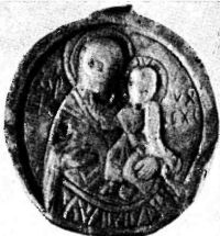
Фото 8. Богоматерь Одигитрия. Сланец. Икона начала XIII в. Ивано-Франковск. Областной краеведческий музей