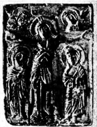
Фото 10. Распятие. Стеатит, резьба. Икона начала XIII в. Ивано-Франковск. Областной краеведческий музей