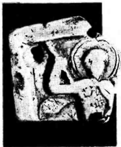
Фото 1. Распятие, фрагмент. Стратит, резьба. Икона конца XII — начала XIII в. Музей истории Киева