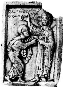
Фото 4. Уверение апостола Фомы. Стеатит, резьба. Икона начала XIII в. Варшава, Национальный музей