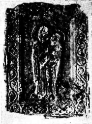
Фото 12. Богоматерь с младенцем. Бронза, литье. Икона начала XIII в. Ивано-Фран- ковск. Областной краеведческий музей.