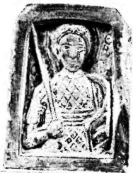
Фото 6. Георгий-воин. Глинистый сланец, резьба. Икона начала XIII в. Музей истории Киева