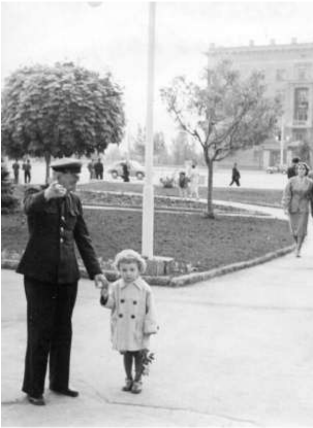
З дідусем, Ростов-на-Дону, 1956 р.