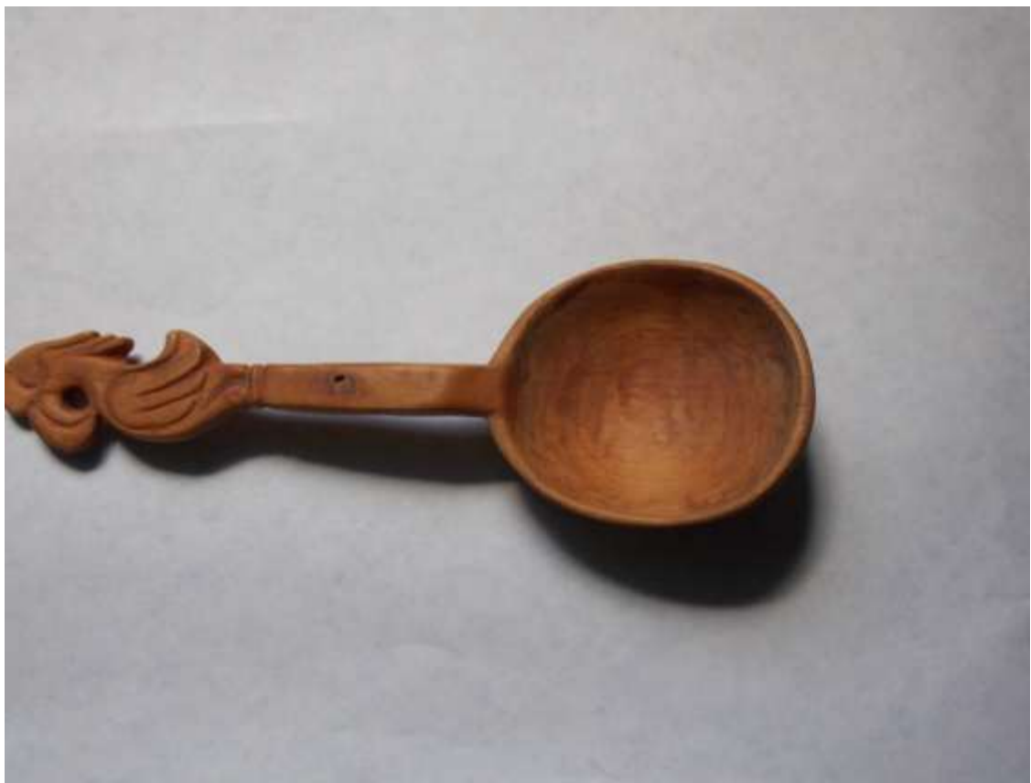
Ложка. Дерево (черемшина).