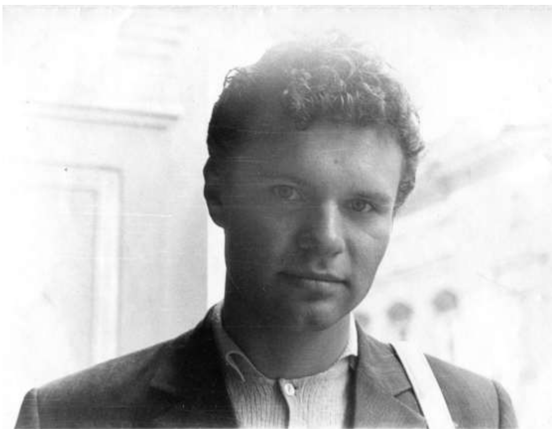
В студентські роки, Ленінград, 1973 р.