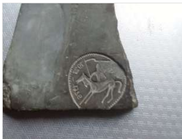
Ливарні форми для виготовлення пам'ятних знаків. Матеріал – сланець.