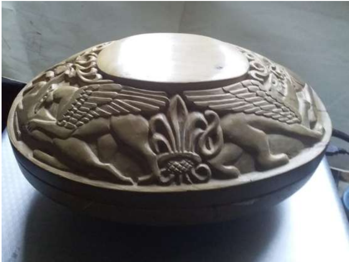
Шкатулка різьблена за мотивами скіфського звіриного стилю. Дерево (липа).