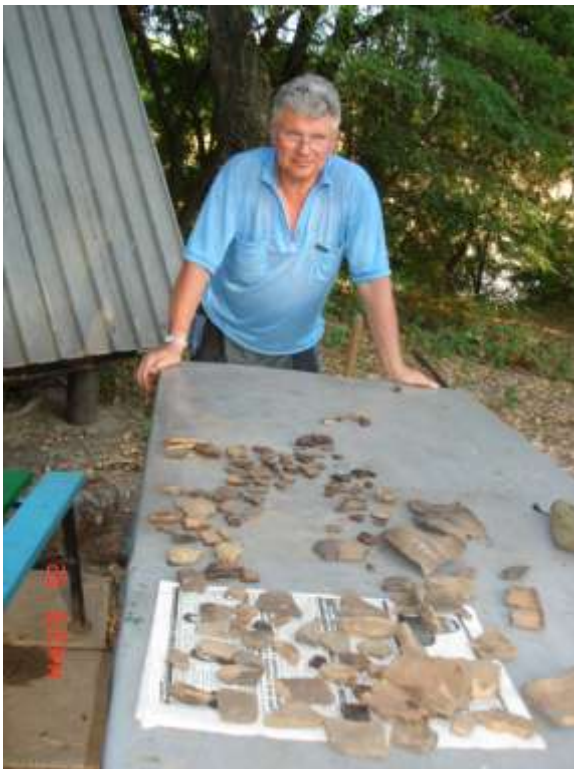
Знахідки, о. Байда, 2006 р.