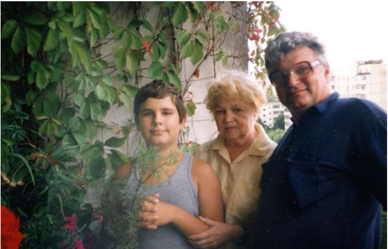
З мамою та молодшим сином, Львів, 1999 р.