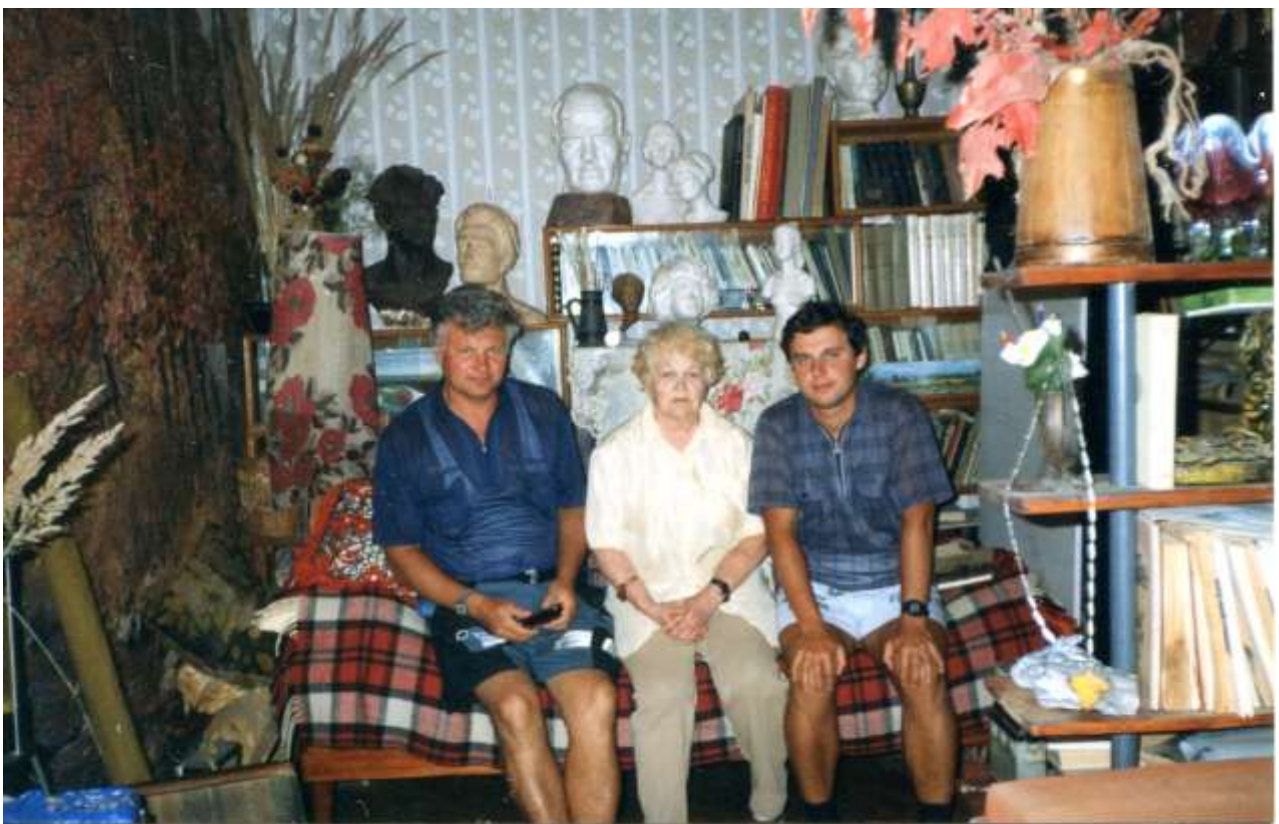
З мамою та старшим сином, Львів, 1999 р.