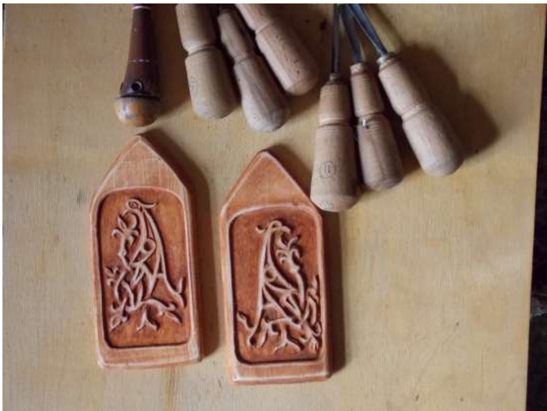
Парні цери зі стильзованим зображенням журавля. Дерево (тонований граб). Інструменти різьбляра.