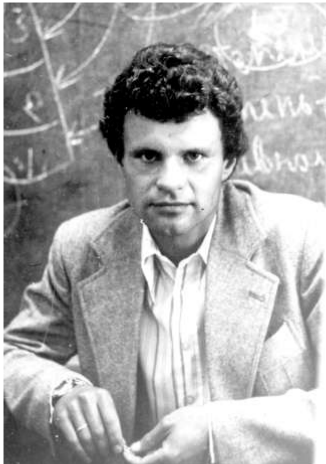
У відділі теорії археології Інституту археології АН України 1980 р.