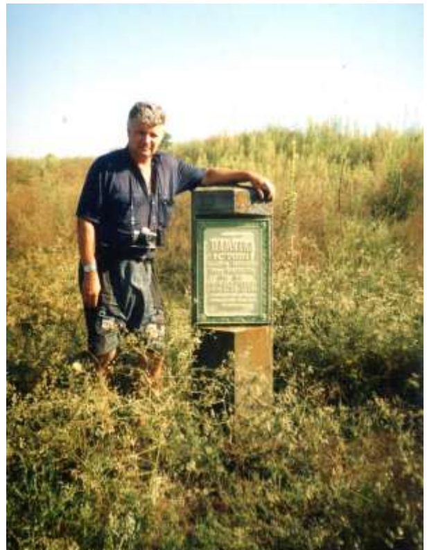
Біля телегінівського знаку. о. Байда, 2003 р.