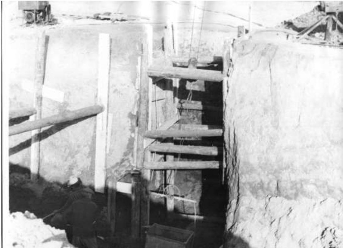
Вищетарасівська експедиція. Глибина скіфських катакомб, 1975 р.