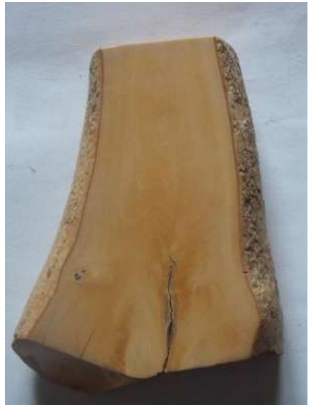
Торс. Дерево (відполірований зріз самшита).