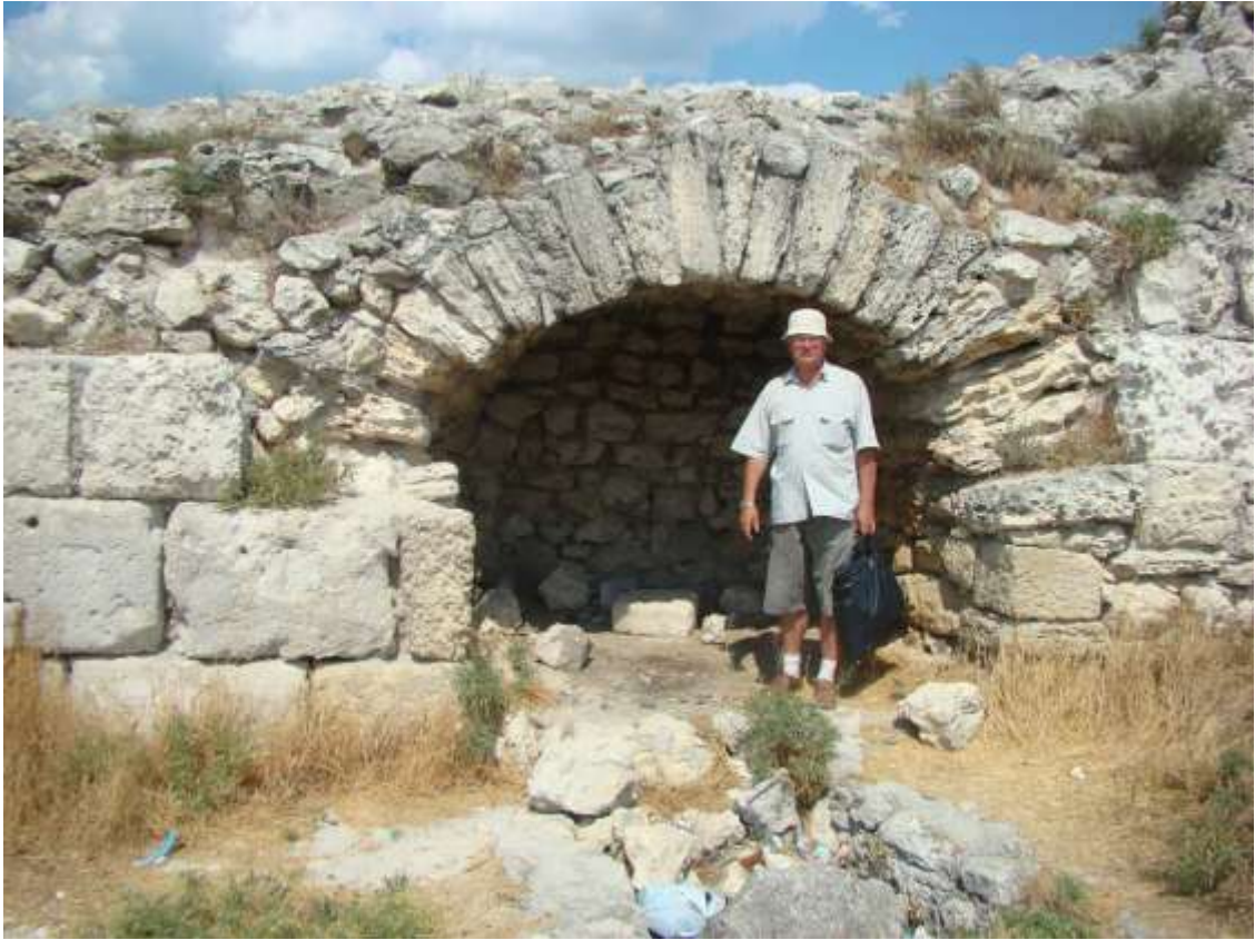
Херсонес, 2008 р.