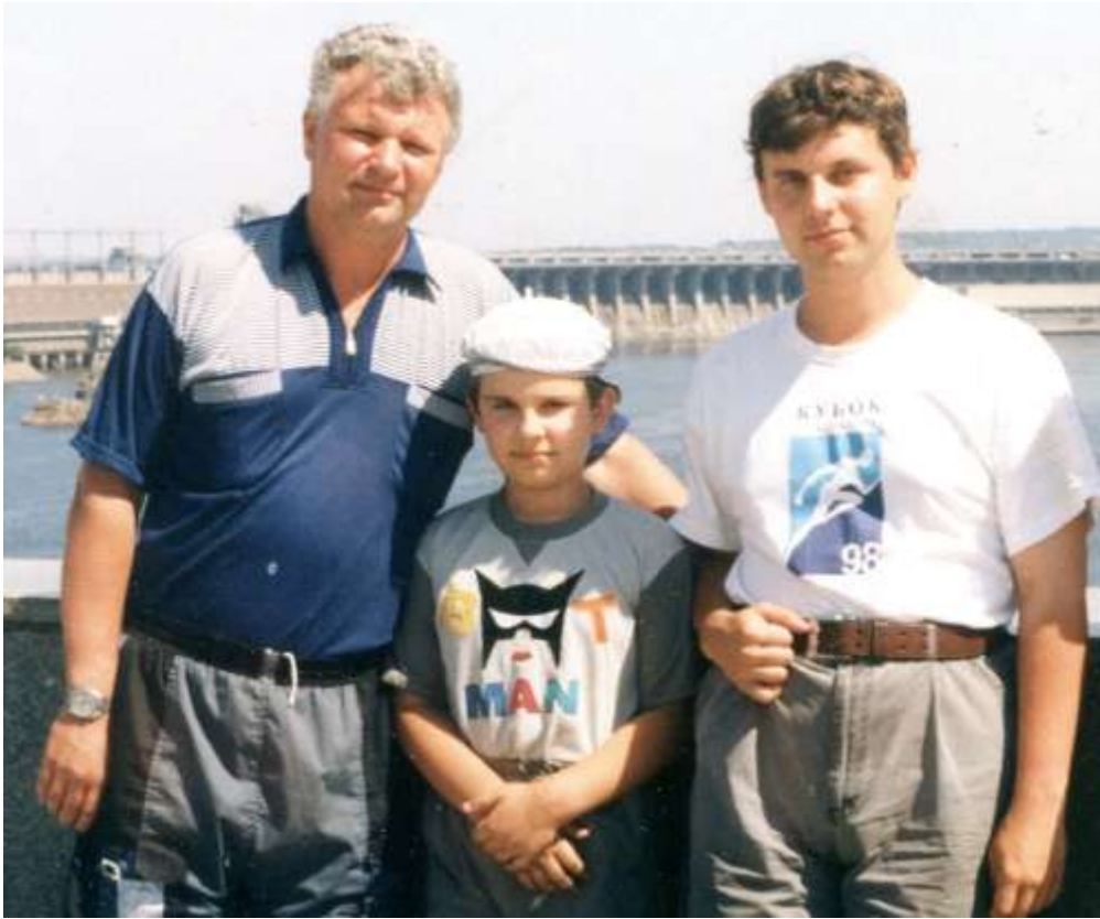
Хортицький музей-заповідник, Хортиця, 2003 р.