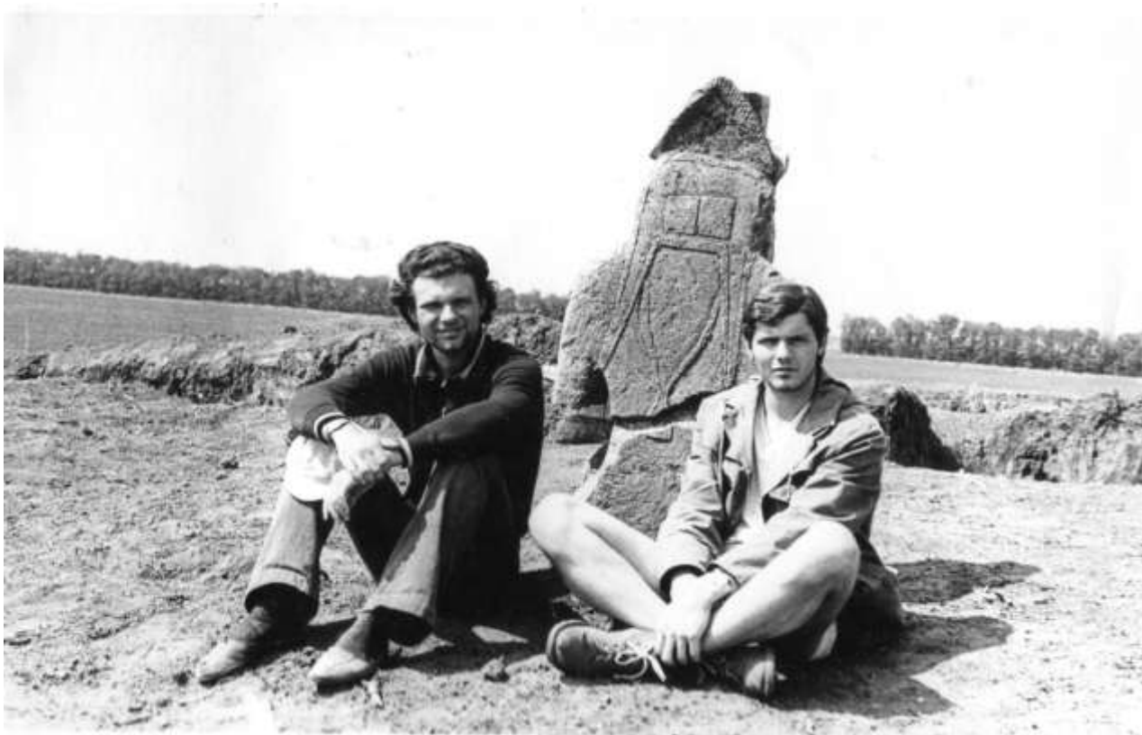
Половецьке святилище, Вищетарасівська експедиція, 1975 р.