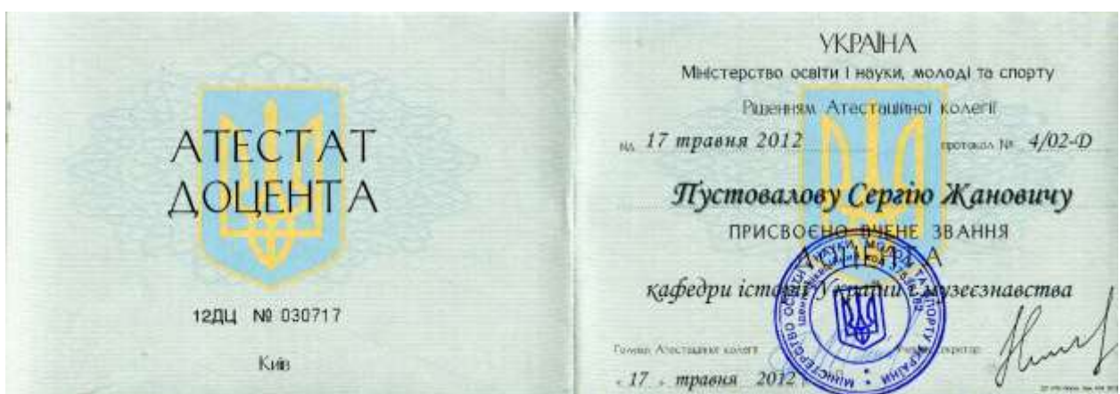
Атестат доцента, 2012 р.