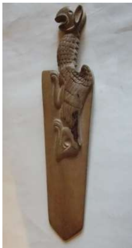
Ніж для паперів. Дерево (груша).