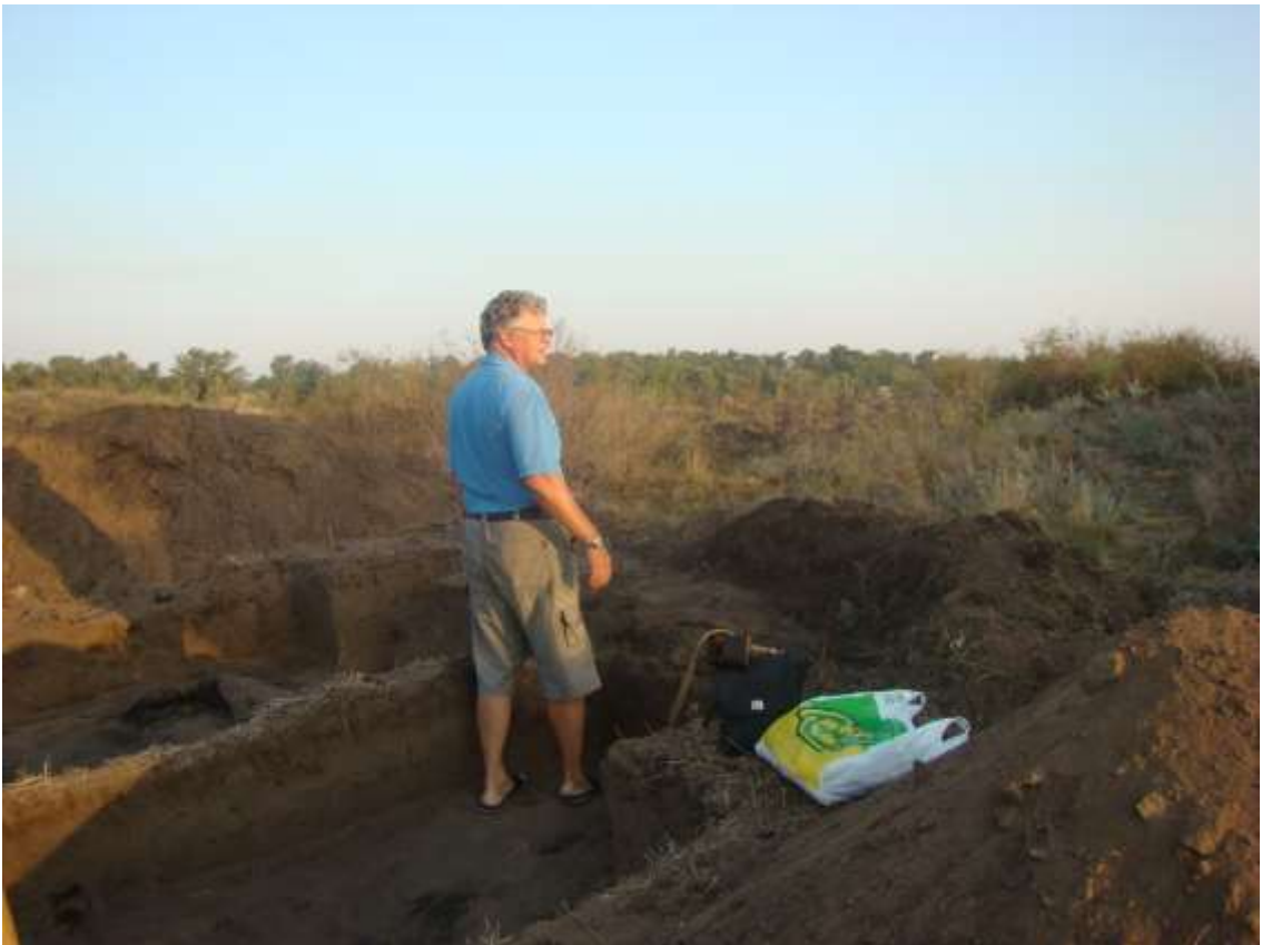
Початок розкопок. Запоріжжя, о. Байда. 2007 р.