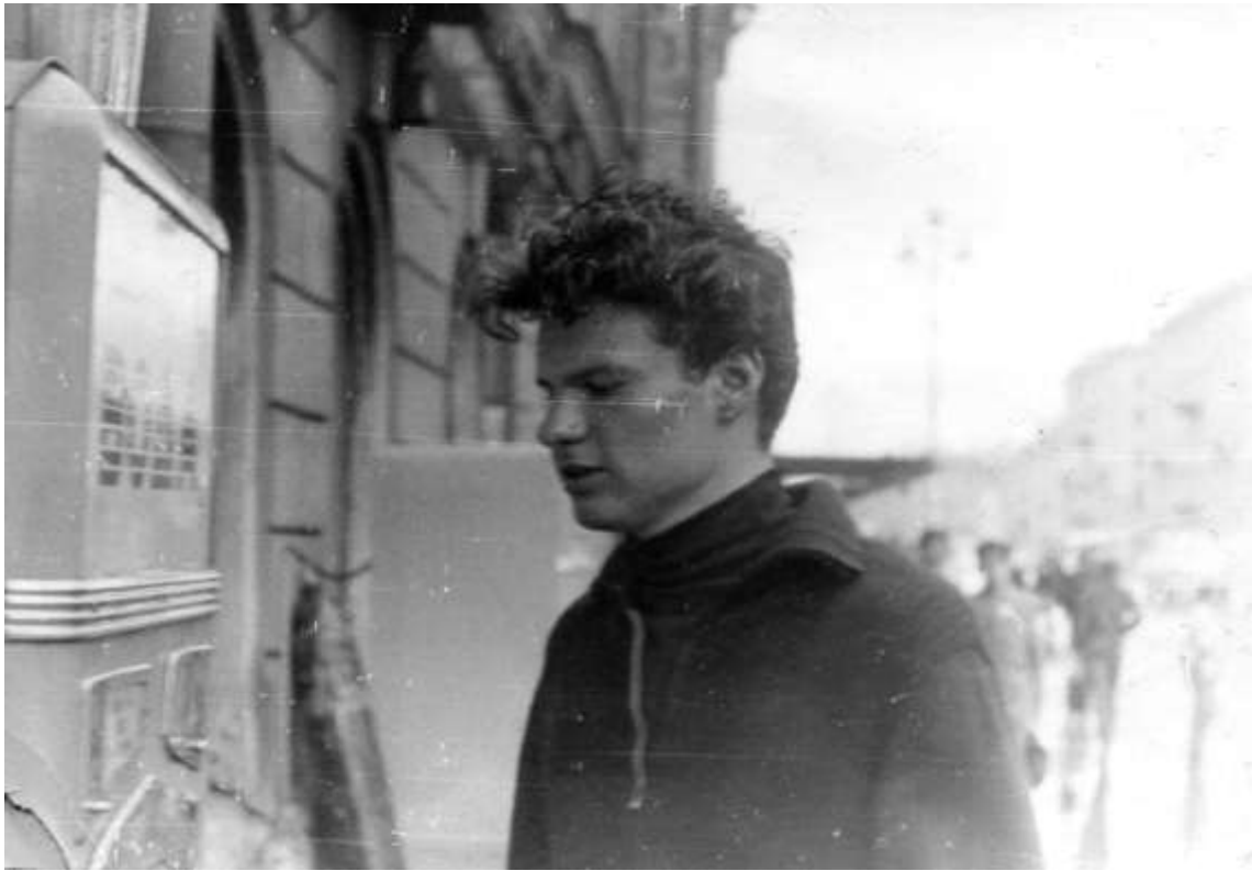
Перший курс університету, Ленінград, 1971 р.