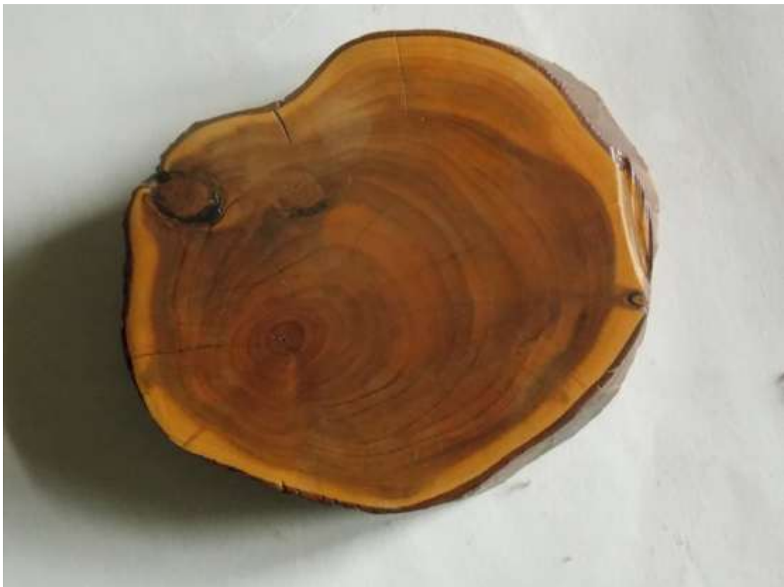
Ягідний тис (відполірований зріз).