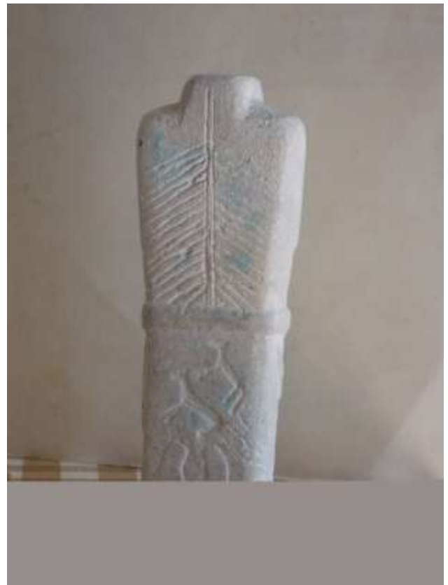
Стилізована стела доби ранньої бронзи Камінь (ракушняк)