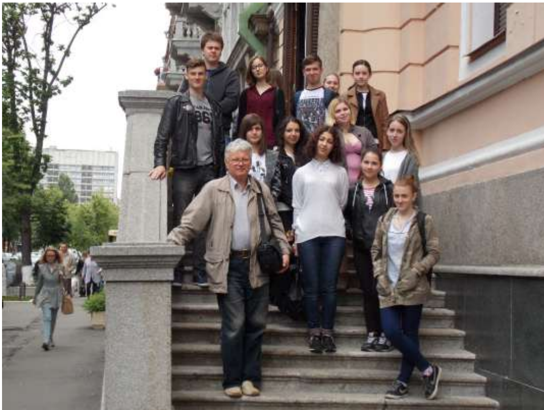
В Національному музеї мистецтв імені Богдана і Варвари Ханенко зі студентами, Київ, 2016 р.