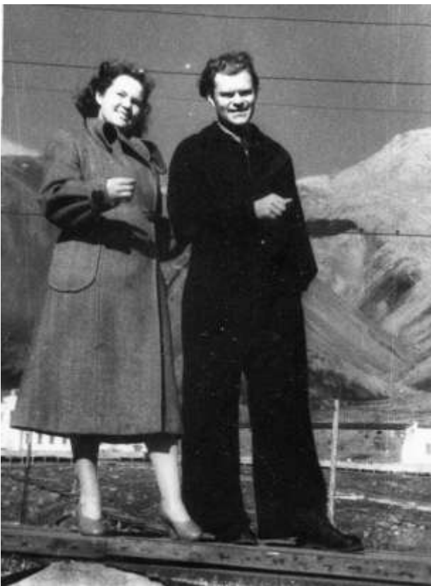
Мати й батько, Шпіцберген, 1956 р.