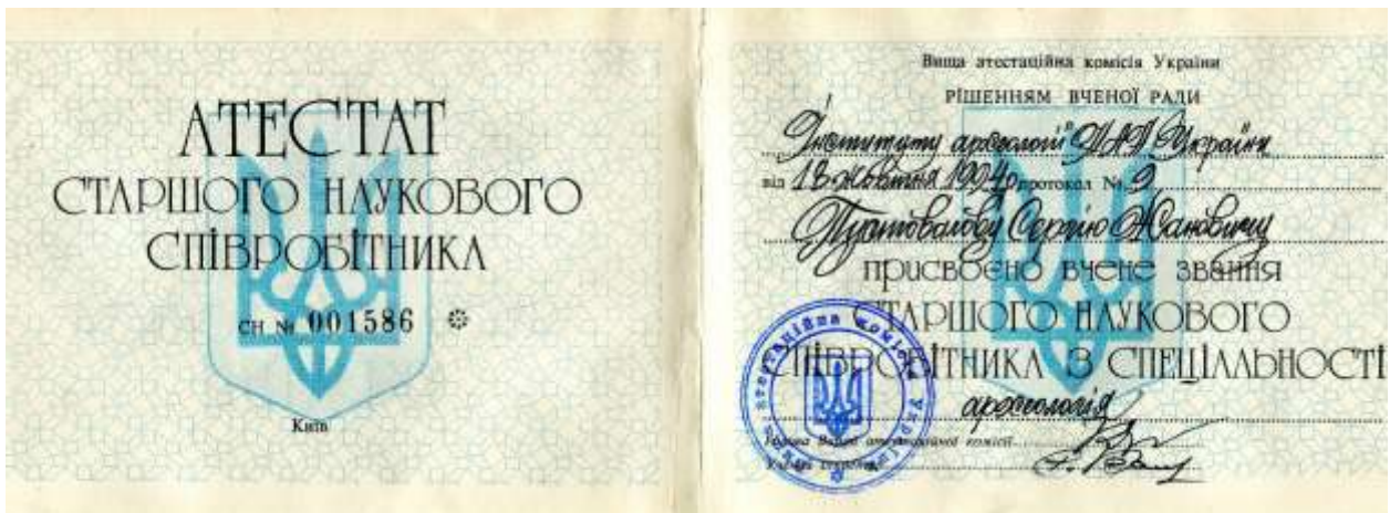
Атестат старшого наукового співробітника, 1994 р.