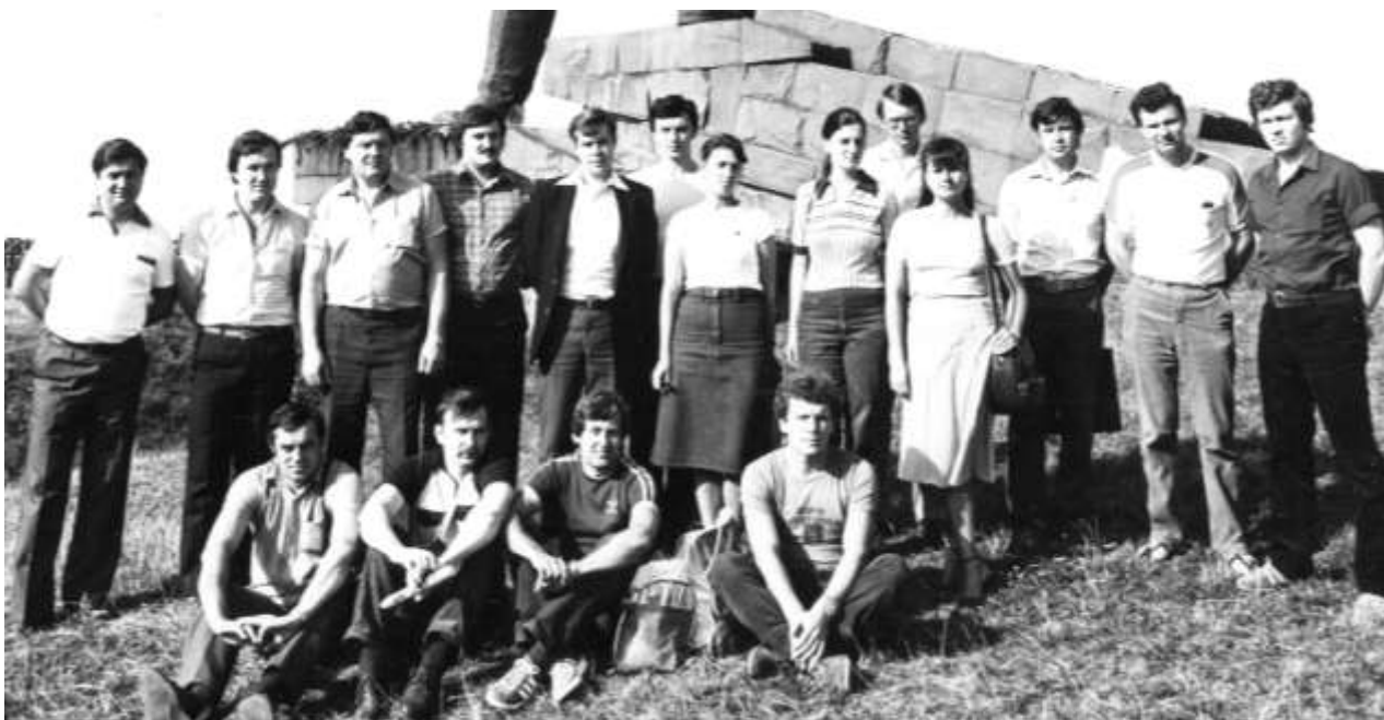
У складі міжнародної делегації молодих науковців. Югославія, 1983 р.