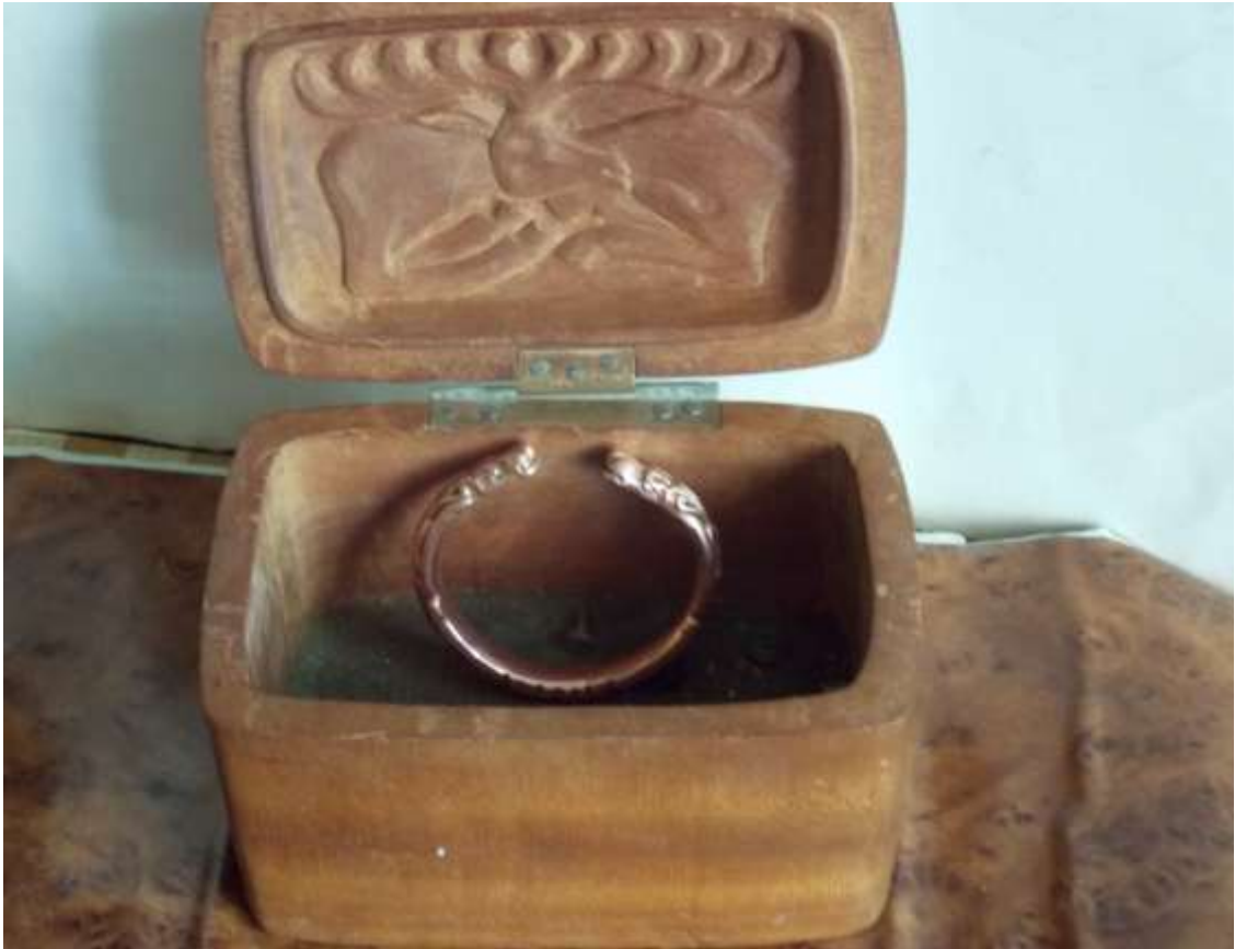
Шкатулочка з оленем (за мотивами скіфських курганів). Дерево (махагонія – тропічна деревина).