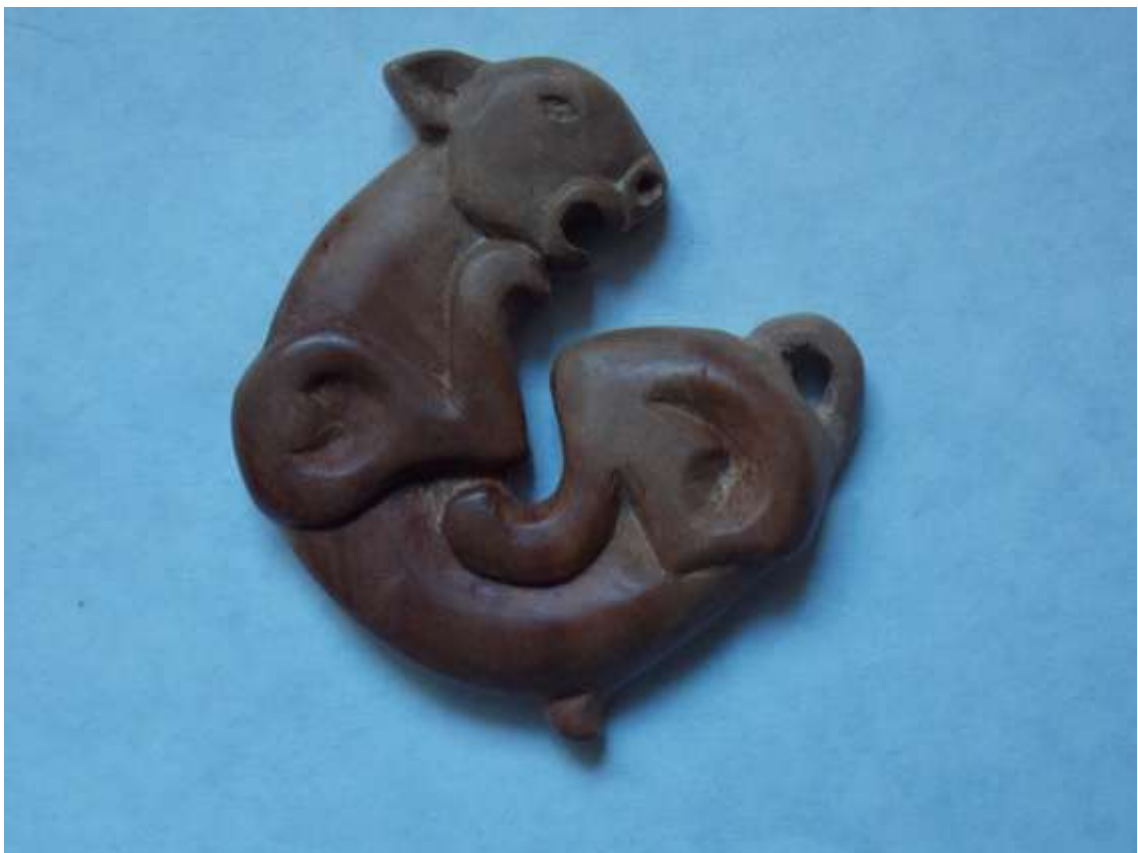
Фурнітура до замкової щілини. Дерево (груша).