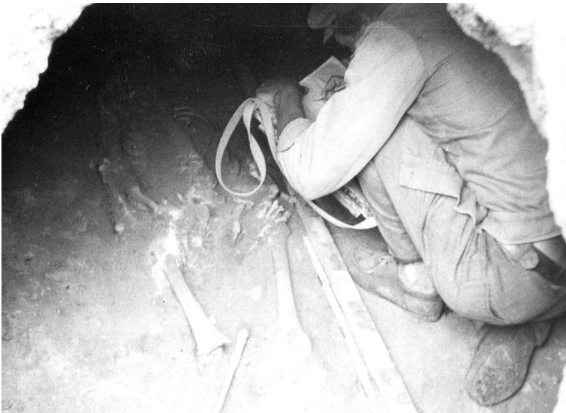
В катакомбі доби бронзи, 1978 р.