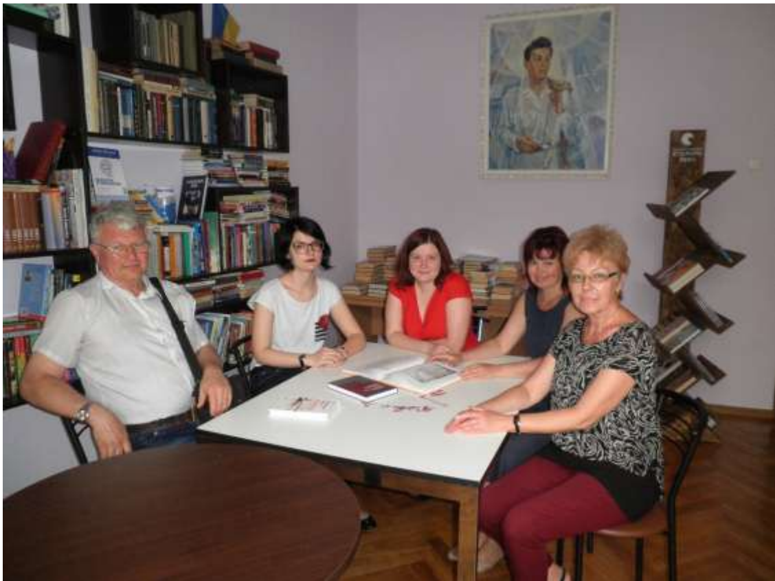
З колегами в Літературно-меморіальному музей-квартирі П. Г. Тичини. Київ, 2017 р.