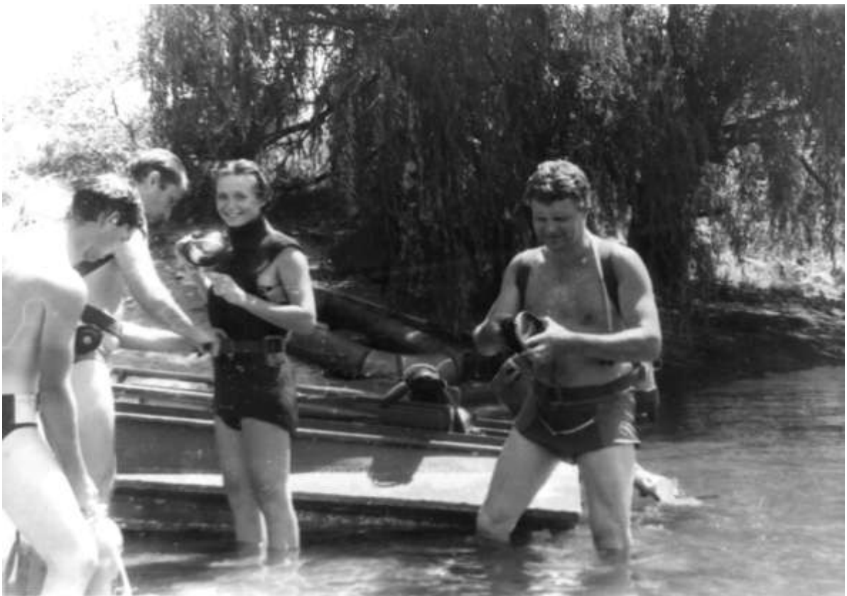
З аквалангом на острові Байда, Мала Хортиця, Запоріжжя, 1995 р.