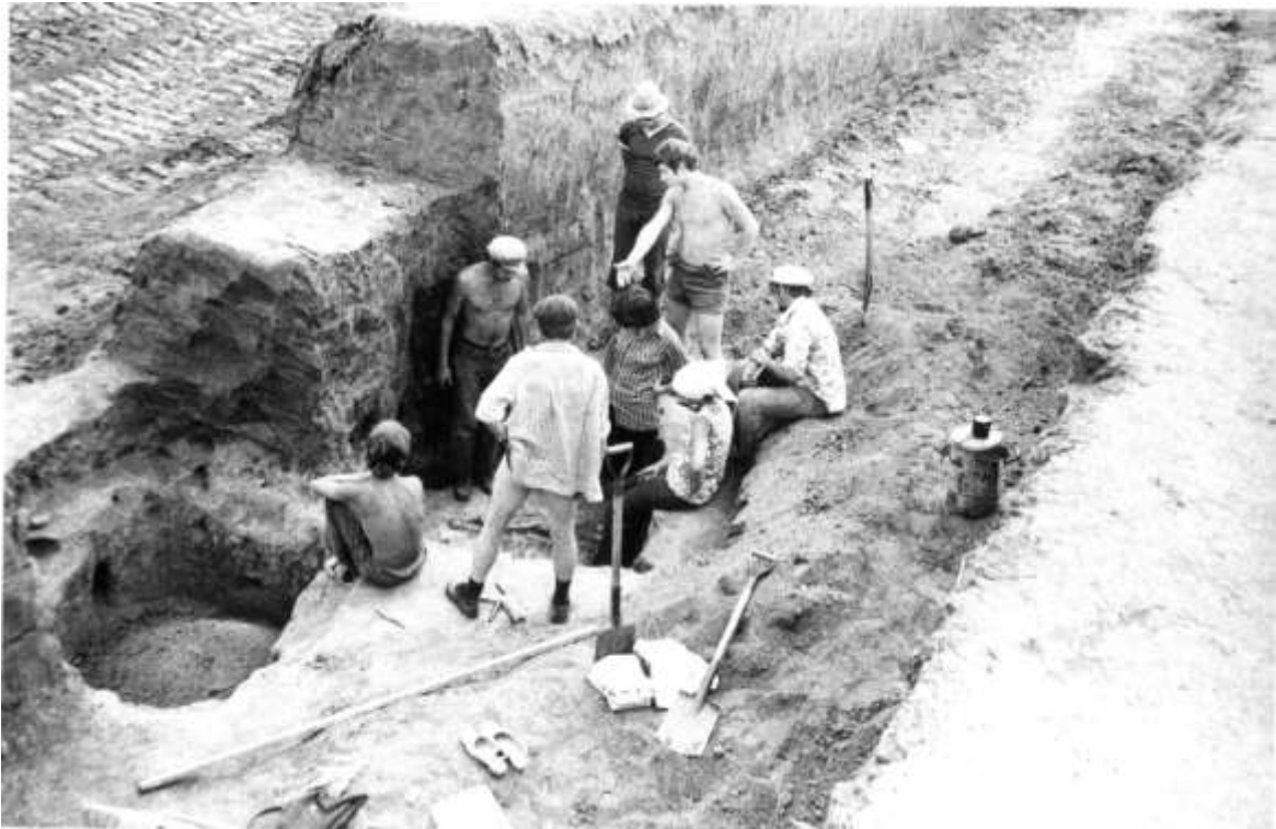
Запорізька експедиція, складний випадок, 1978 р.