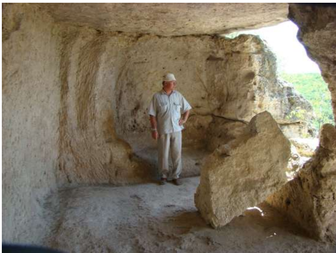
Чуфут-Кале, 2007 р.