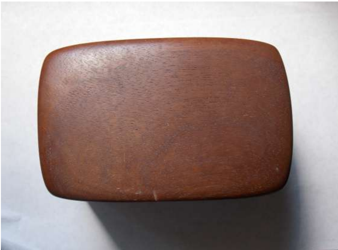
Кришка шкатулочки (вид зверху).