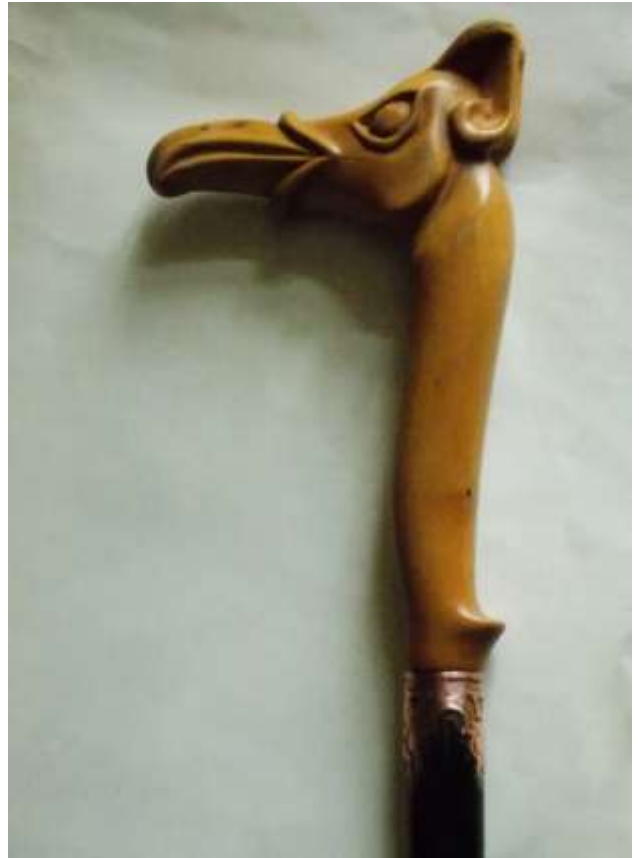
Руків'я палиці у вигляді грифона. Дерево (кизил).