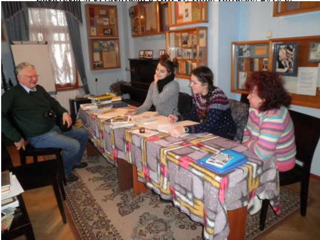
Практика в Київському літературно-меморіальному музеї Максима Рильського. Київ, 2016 р.