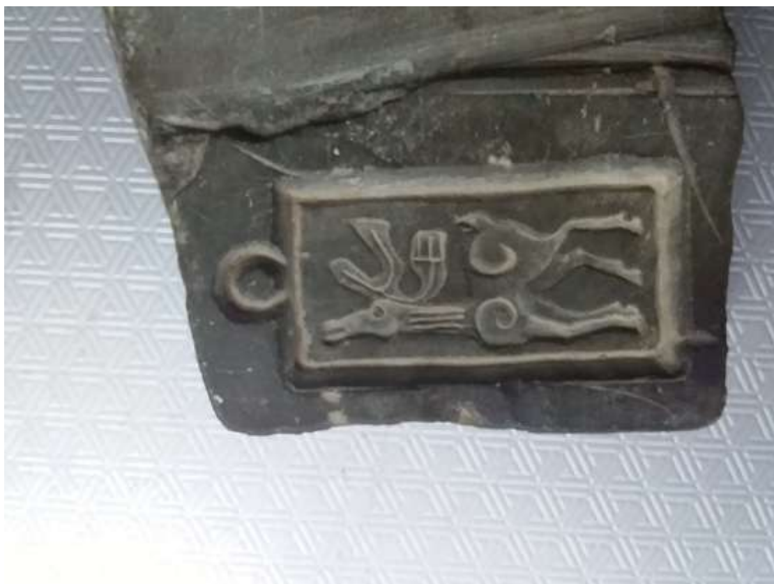
Ливарна форма для брелка. Скіфоїдне зображення, Північний Кавказ, VI до н.е. Матеріал – сланець.