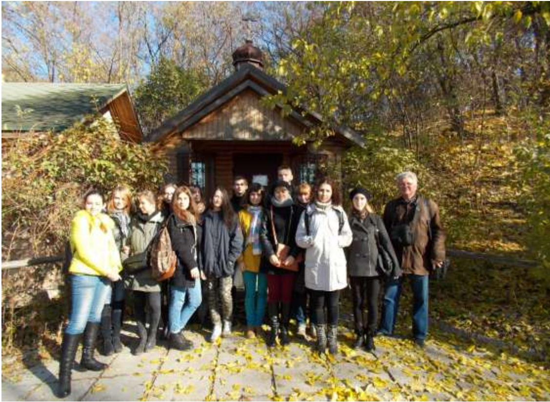
Експедиція зі студентами в XIII ст. Київ. Китаєво. 2016 р.