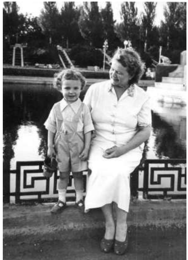
З бабусею, Ростов-на-Дону, 1956 р.