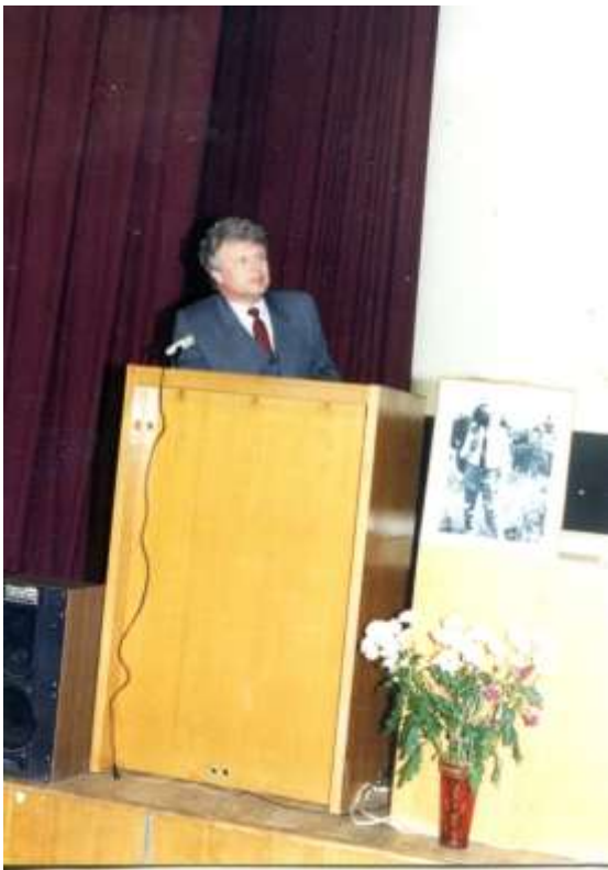
Виступ на конференції, присвяченій вшануванню пам'яті Генінга В.Ф. 1999 р.