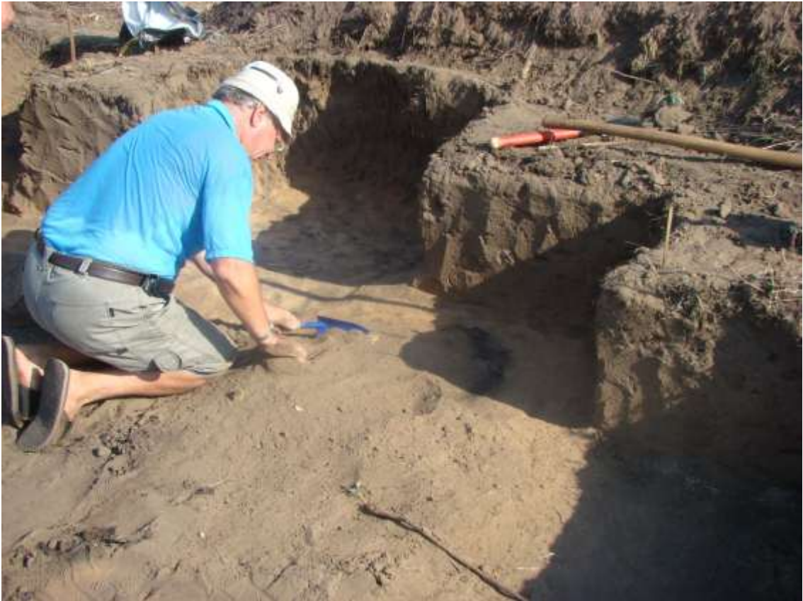
Дослідження напівземлянки шляхти (ймовірно, Байди Вишневецького). о. Байда, 2007 р.