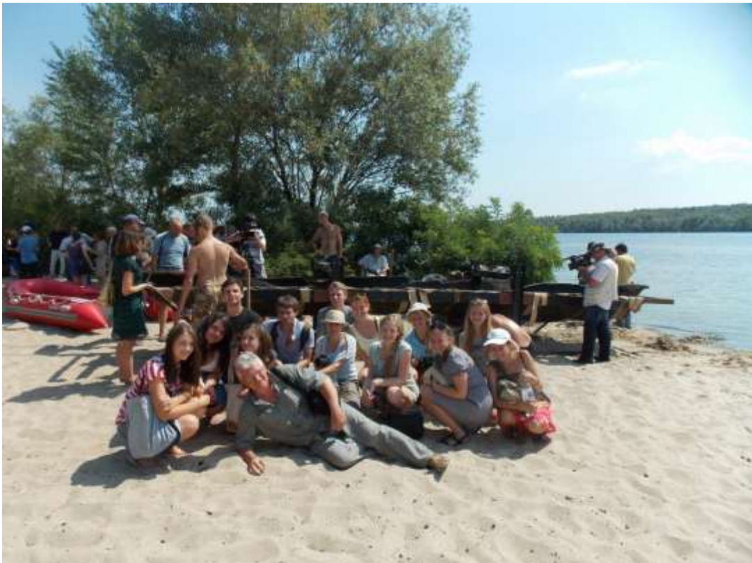
Підйом човна зі студентами-практикантами, Острів Байда, 2012 р.