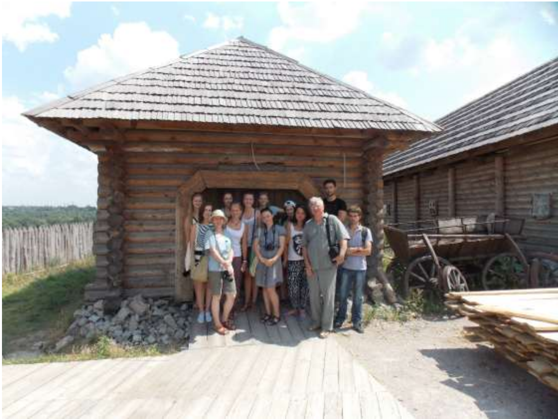
Зі студентами-практикантами, Археопарк Запорізька Січ, Хортиця, 2012 р.