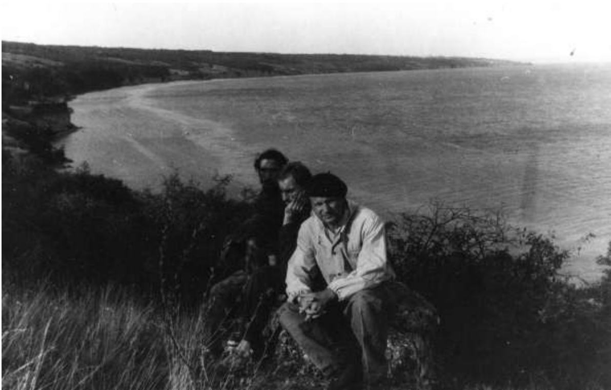
Розвідка на Михайлівському поселенні, Херсонська обл., Нововоронцовський р-н, 1993 р.