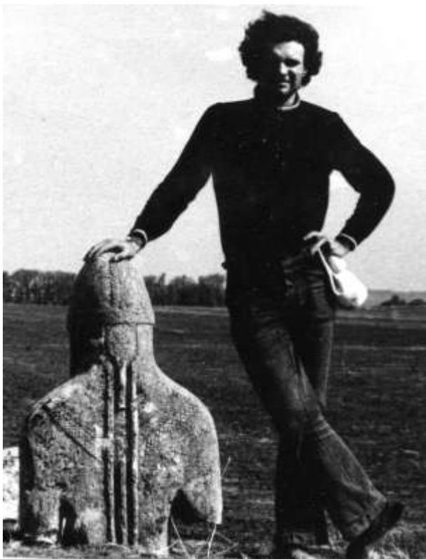
Вищетарасівська експедиція, курган 93 (біля с. Виводове).