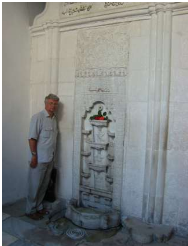
Фонтан сліз, Бахчисарай, 2007 р.