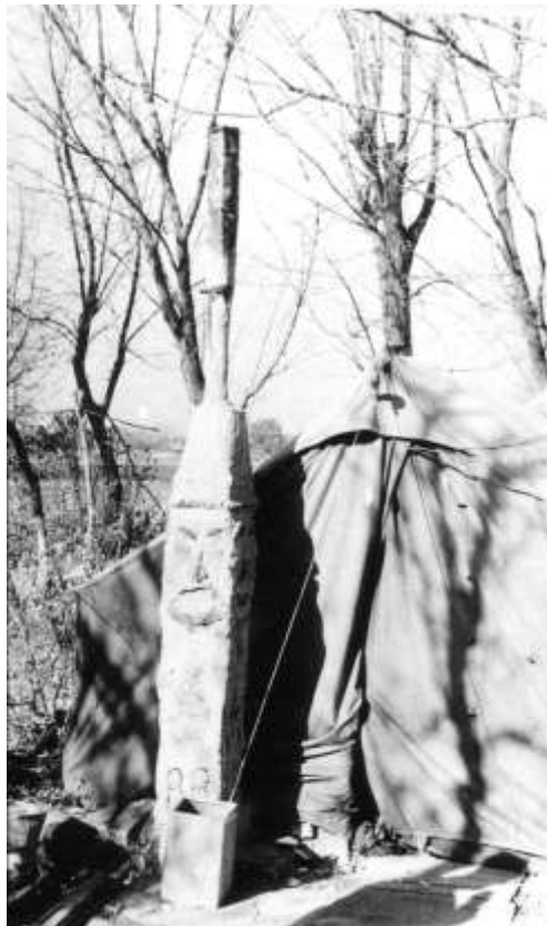
Побут в експедиції