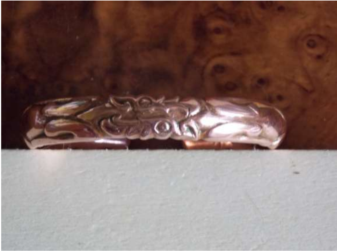
Браслет з двома хижакми, хвости яких являють собою грифонів. Мідь.