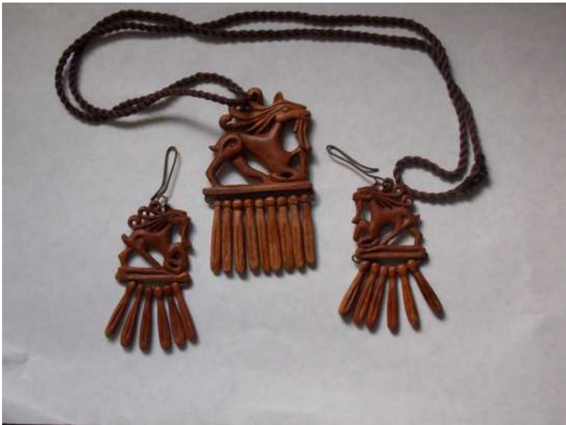
Набір жіночих прикрас. За мотивами надверхів'я скіфського кургану «Чмирьова могила». Дерево (груша).