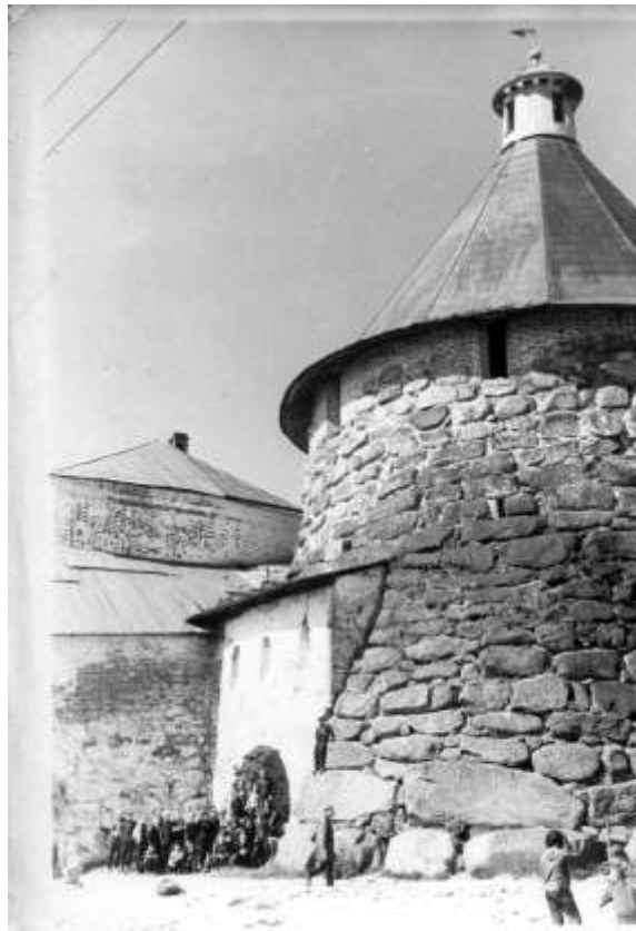
Поїздка на Соловки. Вхід у Соловецький монастир, 1967 р.