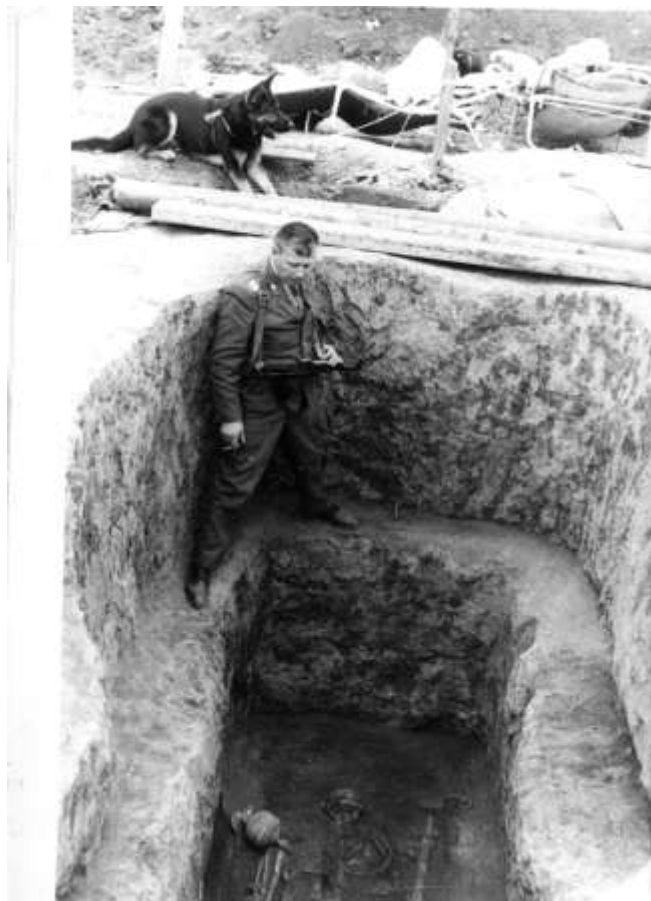
Охорона під час розкопок поховання половецького хана Запорізька експедиція, 1981 р.