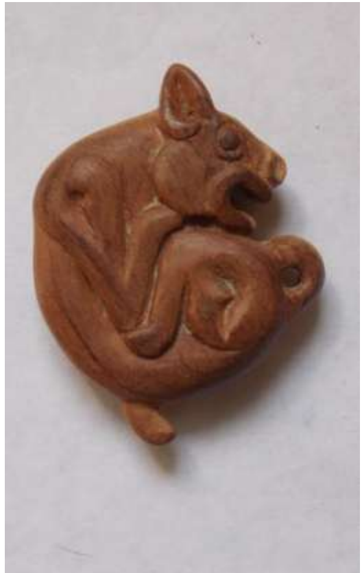
Прикраси. Підвіски. Дерево (декоративна яблуня).