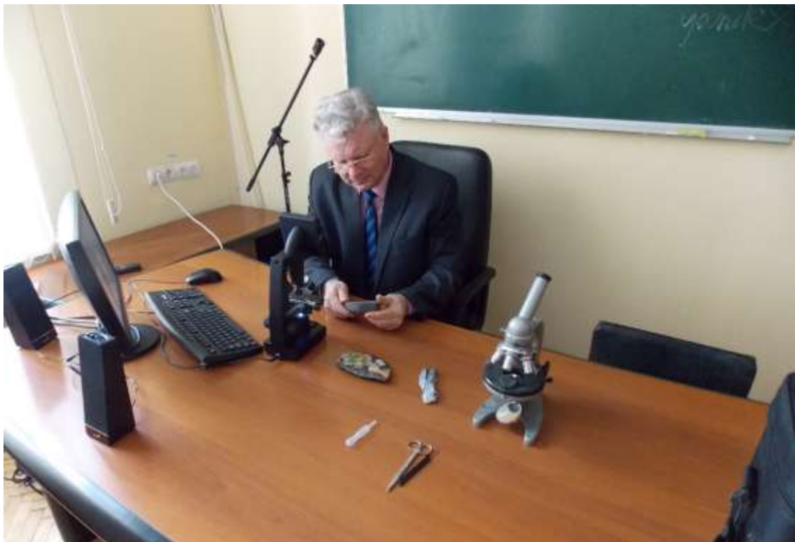
На кафедрі музеєзнавства та пам'яткознавства КНУКіМ. Київ, 2017 р.