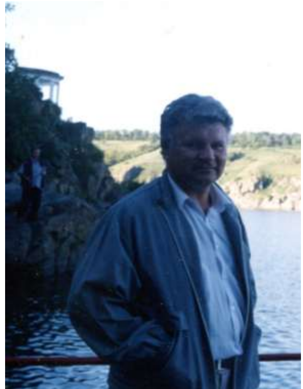
Пристань на о. Байда. 2007 р.