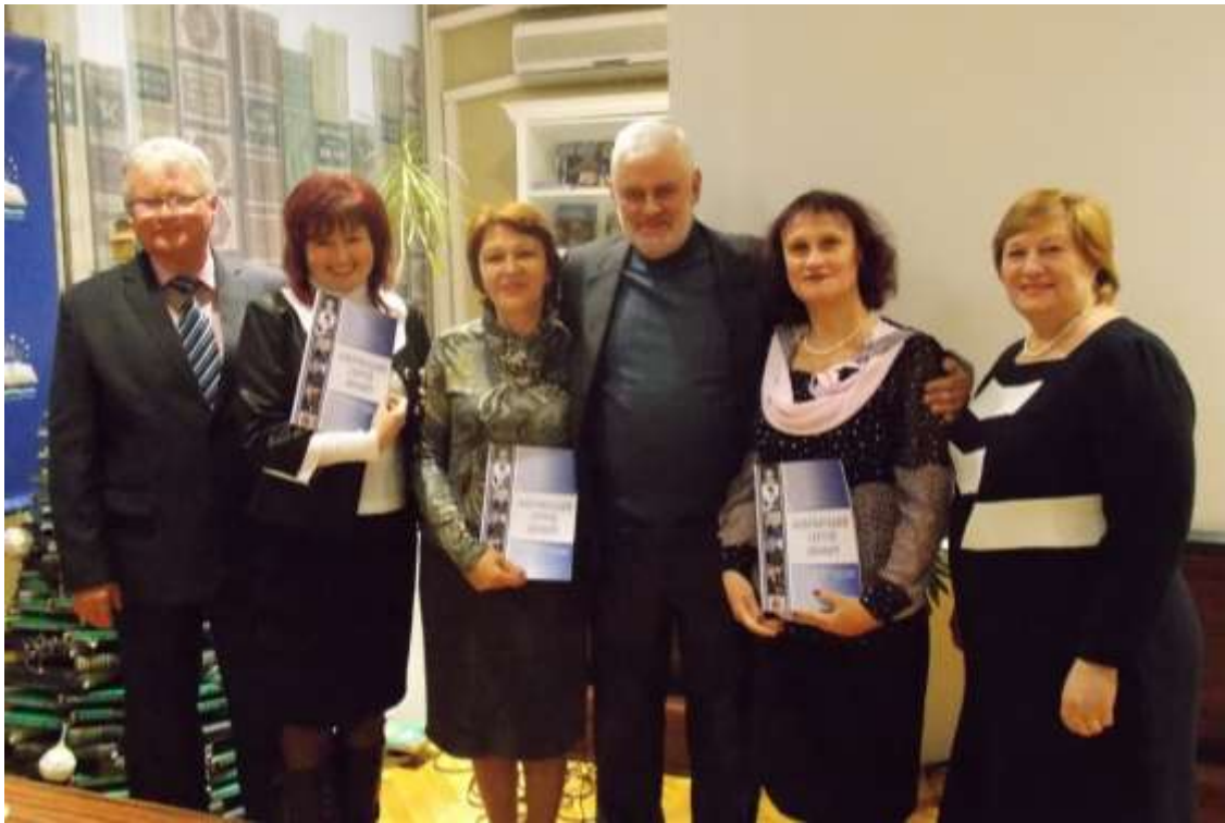
На презентації бібліографічного покажчика «Ольговський Сергій Якович», в науковій бібліотеці КНУКіМ. Київ, 2017 р.