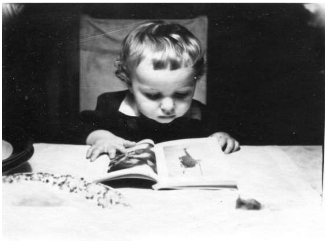
З книгою, Ростов-на-Дону, 1955 р.