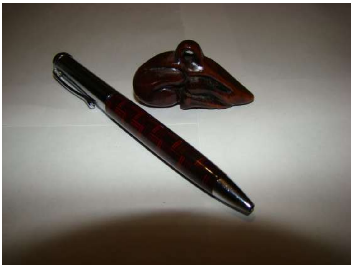
Протома кабана за скіфським оригіналом. Дерево (стара– близько 300 років– груша).