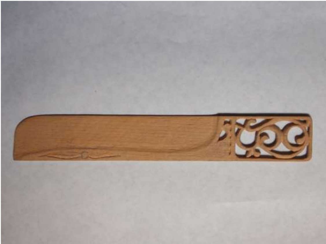
Ніж для паперів. Дерево (бук).