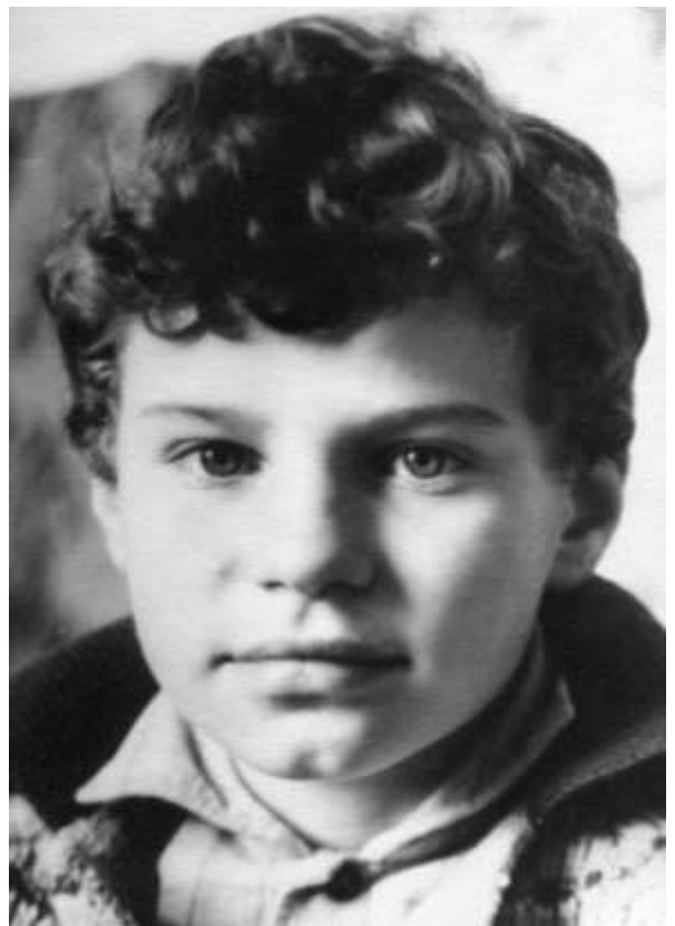
Червоноград, 1965 р.