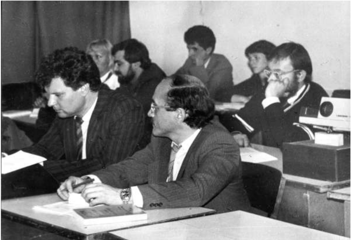
XX конференція Інституту археології АН УРСР, Одеса, 1989 р.