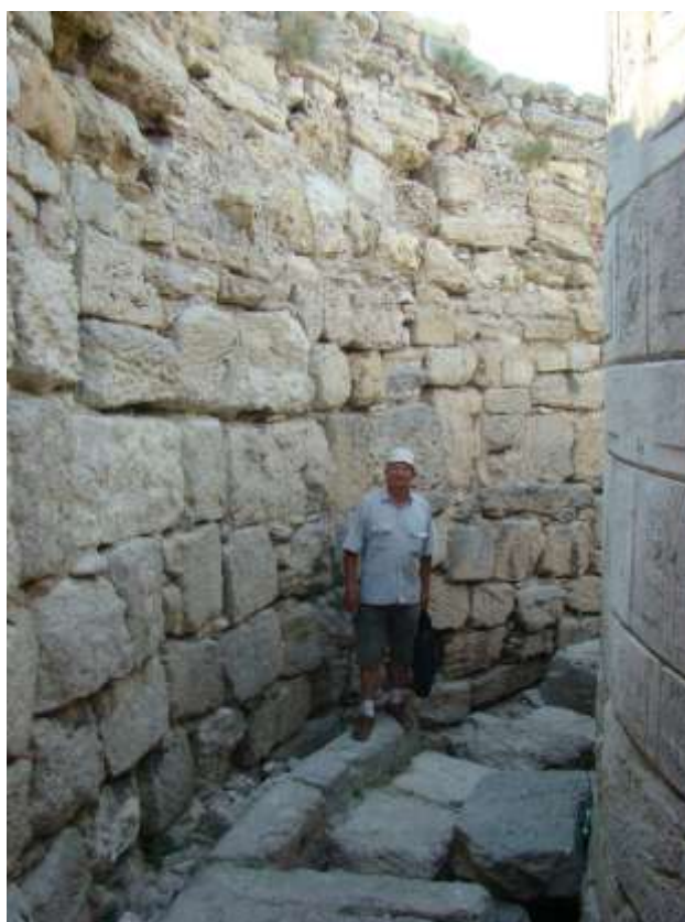
Херсонес, Башня Зенона, 2008 р.