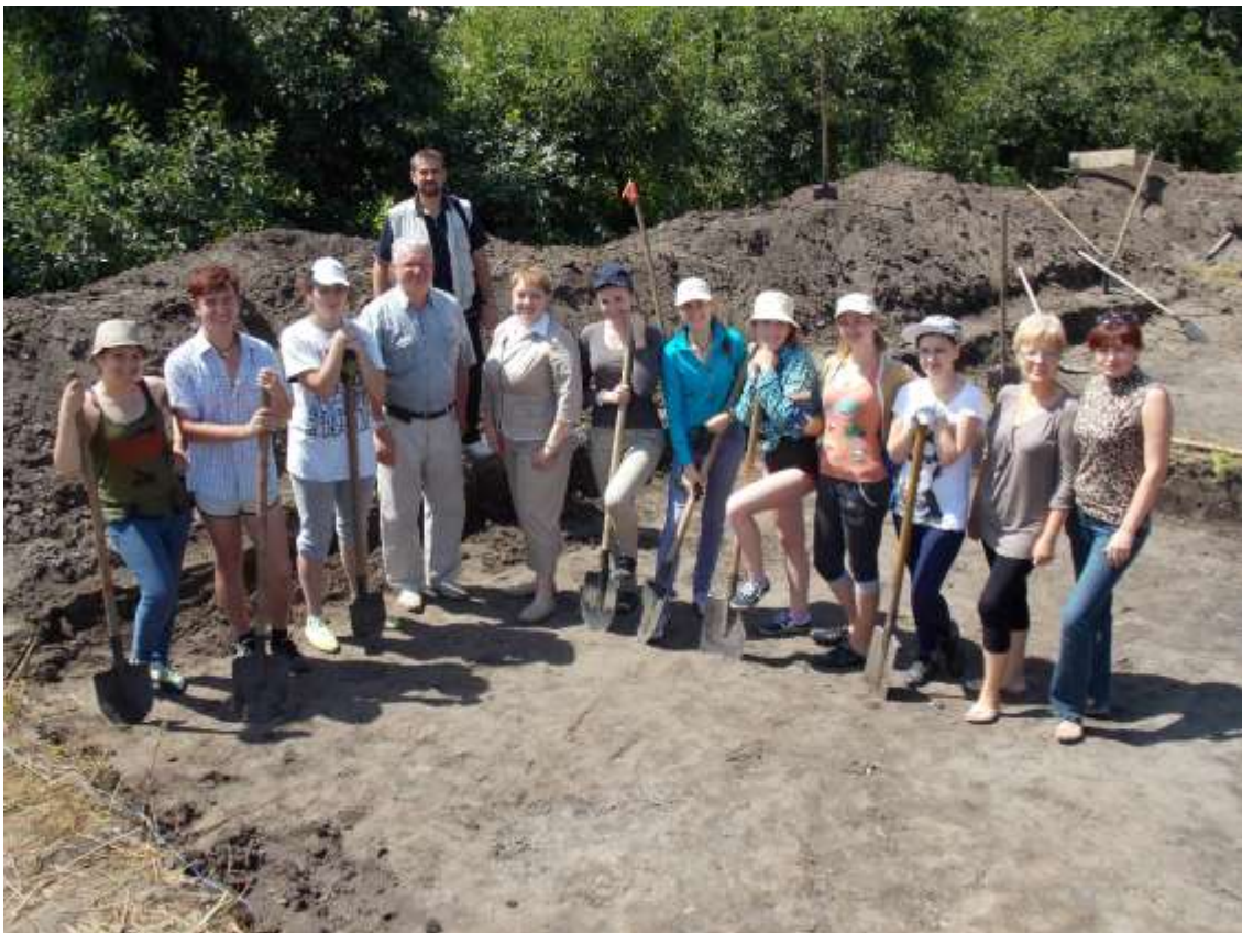
Зі студентами-практикантами в м. Вишгород, 2014 р.