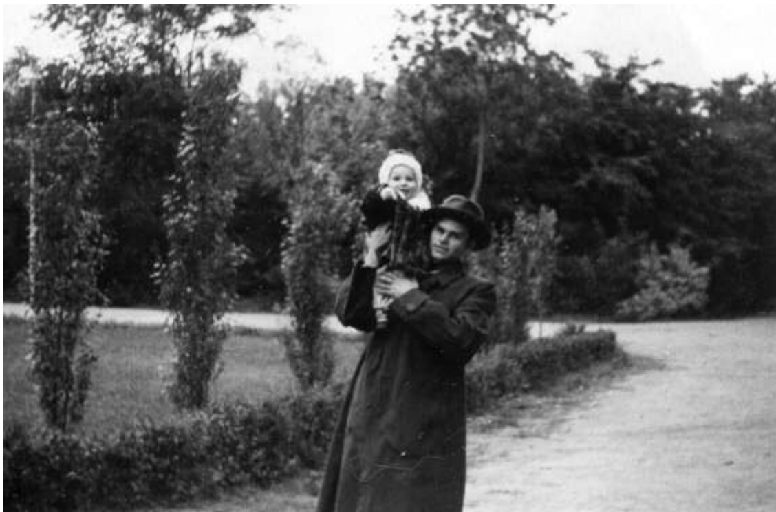
З батьком, Ростов-на-Дону, 1955 р.