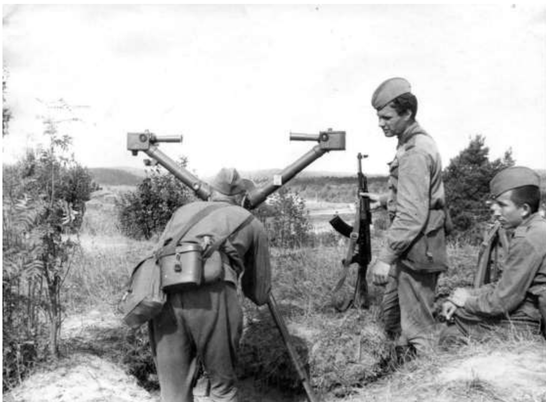
Військові табори, 1973 р.