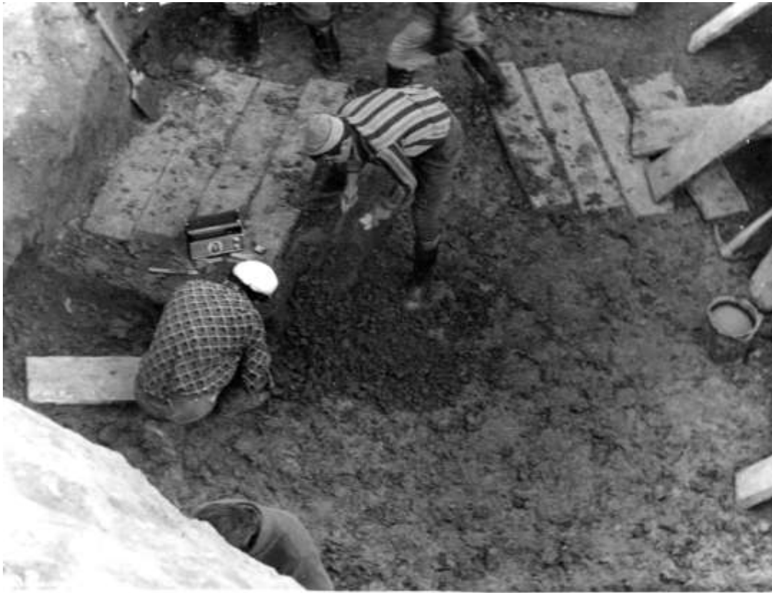
Розчищення Скіфської могили, 1975 р.