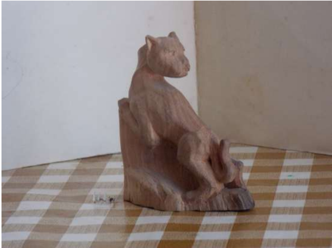
Пантера. Дерево (декоративна яблуня).