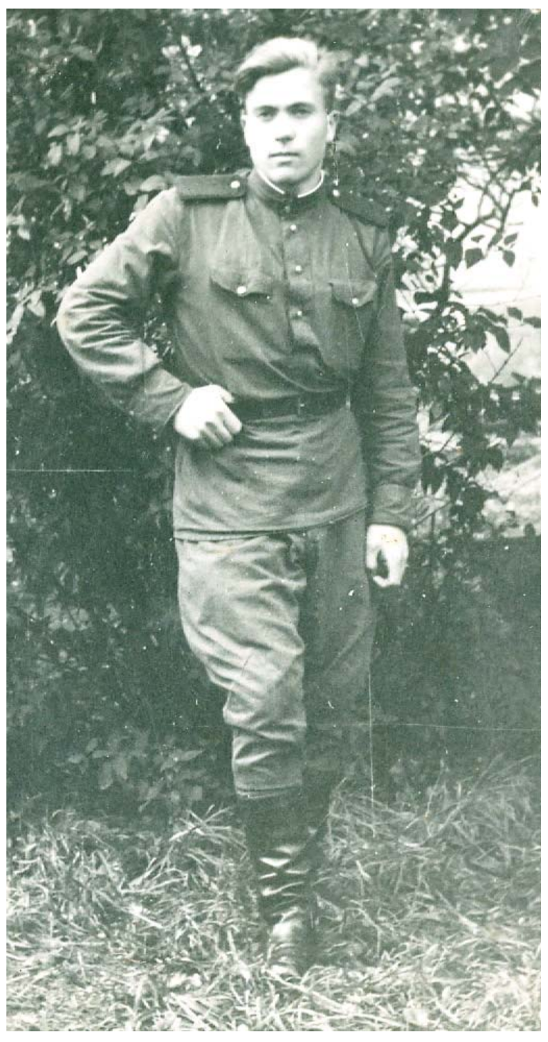
Рис. 1, 2