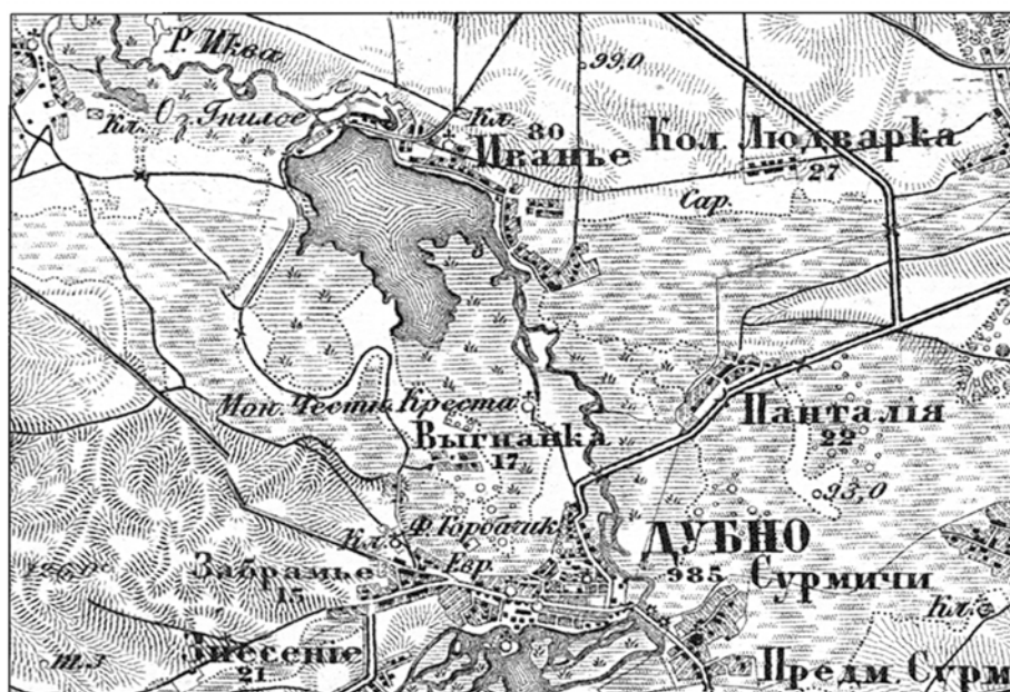
Рис. 1. Дубно і Івання на карті 1867 р.

Острозькі отримали можливість облаштувати свій двір в Іванні. В ході відродження соціально-політичного значення Дубна писемні джерела відображають інволюцію статусу Івання при збереженні важливого господарського значення поселення. Показовим фактом є те, що сама зміна статусу слугує своєрідним індикатором становлення та розвитку Дубна в литовський період. Цей процес не був би таким успішним, якби не акумульований навколо іванського двору господарський ресурс. Історія Івання являє собою приклад того, як окремі міські функції (адміністративні, торгові, господарські) після занепаду давньоруського міста реалізовувалися сусіднім поселенням, а потім були повернуті йому назад.