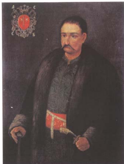
Мал. 29. Невідомий художник. Портрет сотника Андрія Москаленка, XVIII ст.

Маршальські жезли зображували рідко, зокрема, на портреті Павла Руденка (між 1778–1781) 83 , який був панмаршалком Новомосковського повіту Новоросійської (Катеринославської) губернії, пензля Володимира Боровиковського, а також на портреті отамана Війська Донського Данила Сфремова (1752) 84 .