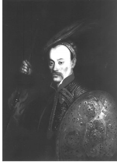
Мал. 6. Даніель Шульц. Портрет Вінцентія Александра Корвіна Госевського, бл. 1662 р.

До третього типу належав, зокрема, портрет Вінцентія Александра Корвіна Госевського, польного гетьмана литовського, генерала артилерії, пензля Даніеля Шульца (бл. 1662 р.), зі списом у правиці, головному уборі з пір'ям яструба, в кольчuzі зі щитом на темному фоні 26 . Гетьман тут зображений в обладунку воїна панцерного війська 27 , що відповідало фактам його біографії, бо починав він свою службу полковником кавалерії у війську Януша Радзивілла, а після 1656 р. організував власним коштом кілька кінних хоругв, які воювали проти шведів.