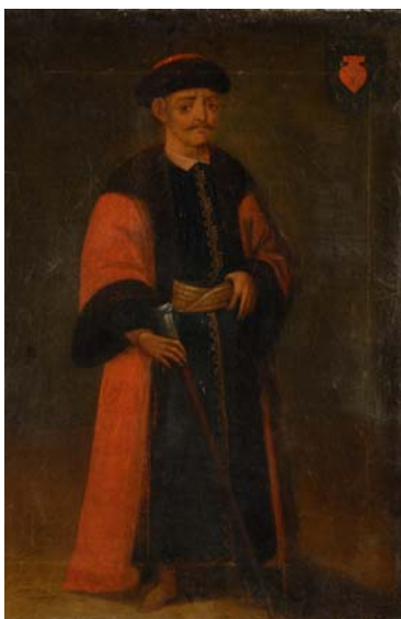
Мал. 28. Невідомий художник. Портрет невідомого сотника, кін. XVII ст.