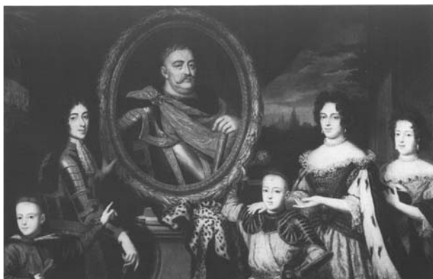
Мал. 8. Анрі Гаскар. Портрет Марії Казиміри з дітьми (Якубом Людвиком, Александром Бенедиктом, Яном, Костянтином Владиславом, Терезою Кунегундою, 1691 р.

Нарешті, до четвертого типу портретів — шляхтича-землевласника, шляхтича-сім'янина — можна віднести портрет того ж таки Яна III Собеського з родиною пензля Анрі Гаскара (1691) 33 , портрет Марії Казиміри з дітьми (Якубом Людвиком, Александром Бенедиктом, Яном, Костянтином Владиславом, Терезою Кунегундою) 34 , портрет Збігнева Оссолінського з трьома синами 35 , портрет молдавського господаря Єремії Могили з сином 36 і навіть дуже цікавий портрет Дедеш Агі — посла кримського хана при польському дворі з синами та слугами 37 тощо.