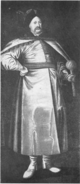
36. Nie określony malarz czynny w 2. połowie XVII w., Portret Janusza Radziwiłła (? (nr kat 70)

Мал. 11. Невідомий художник. Портрет Януша Радзивілла, др. пол. XVII ст.