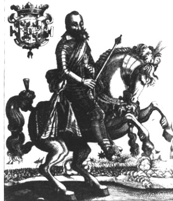
Мал. 13. Ебергард Кесер. Портрет Сигізмунда III, 1612 р.