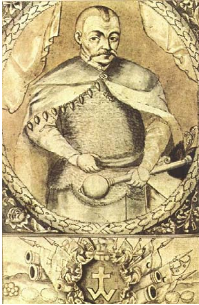
Мал. 15. Портрет Богдана Хмельницького з літопису С. Величка, 1720 р.

Автентичних портретів представників козацької старшини другої половини XVII — початку XVIII ст. з родовими гербами, як того вимагала традиція написання «сарматського» портрета, збереглося не так багато. Насамперед це «контрафекти» Григорія Гамалії (1688–1690 рр.), Леонтія Свічки (XVII ст.), Лук'яна Жоравки (к. XVII ст.), Василя Дуніна-Борковського (к. XVII — поч. XVIII), Михайла Миклашевського (1706), Івана Сулими (перша половина XVIII ст.). З другої половини XVIII ст. та на початку XIX ст. подібних портретів почало з'являтися значно більше: портрети Андрія Москаленка, Степана Родзянка, Юхима Дарагана, Семена Сулими, Петра Войцеховича, Павла Полуботка, Сави Туптала, Богдана Хмельницького, Данила Єфремовича та деякі інші.