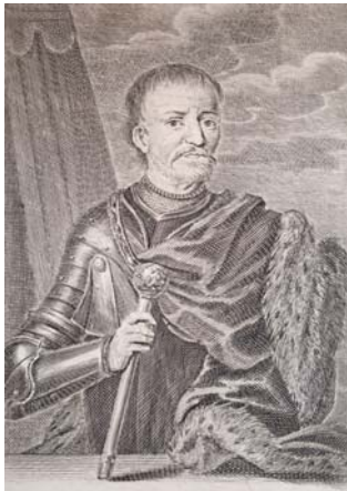
Мал. 24. Мартін Бернігерот. Портрет Івана Мазепи, 1706 р.

Третій варіант зображення Івана Мазепи в лицарських обладунках європейського типу з булавою у правиці був створений німецьким гравером Мартіном Бернігеротом у 1706 р. та потім кілька разів передрукований у західноєвропейській пресі початку XVIII ст. Це єдині автентичні зображення представників козацтва в обладунках. Цілком може бути, що використовуючи кольчуги чи нагрудники під час збройних сутичок, представники старшини вважали за потрібне «писати себе» в світському парадному одязі, який міг підкреслити не лише їхній статус та військові досягнення, а й матеріальний добробут.