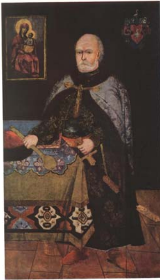
Мал. 26. Невідомий художник. Портрет Василя Дуніна-Борковського, кін. XVII — поч. XVIII ст.

полковницьких пірначів, хоча водночас можна помітити зображення цілком типових, одноманітних речей, як наприклад, пірнача, який зображений на портреті Леонтія Свічки 76 та Семена Сулими 77 .