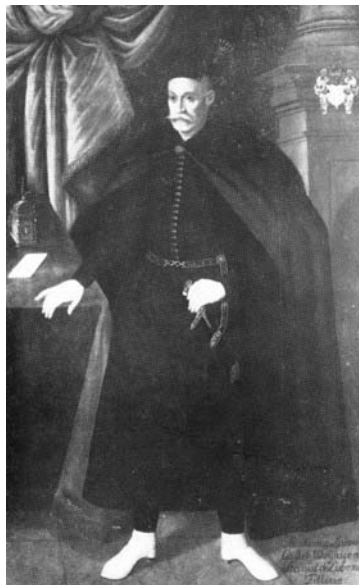
Мал. 4. Невідомий художник. Портрет Себастьяна Любомирського, бл. 1600 р.

Третій портрет репрезентував постать короля верхи на гарцюючому коні на фоні пейзажу та батальної сцени. Король був у традиційному шляхетському одязі, з шаблею у правій руці. Над його головою зображено птаха, який тримає в лапах жезл та булаву — символи влади визначного полководця 18 .