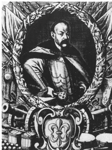
Мал. 21. Олександр Тарасевич. Портрет Михайла Паца, 1686 р.

Що ж до представників української еліти, то в подібних обладунках був зображений лише один гетьман — Іван Мазепа. Першим його в кірасирському обладунку італійського типу зобразив Іван Мігура в гравірованій тезі, яка дійшла до нас під назвою «Мазепа серед своїх добрих справ» (1705 р.). На голові у гетьмана парадний шолом типу «моріон» (morion) зі страусовим пір'ям. Данило Галяховський продовжив цю традицію і зобразив І. Мазепу в аналогічному обладунку, доповнивши його наплічниками та наколінниками, які були притаманні парадним караценам. Це зображення стало центром композиції його гравюри на жовтому шовку «Апофеоз Мазепи» (1708 р.).