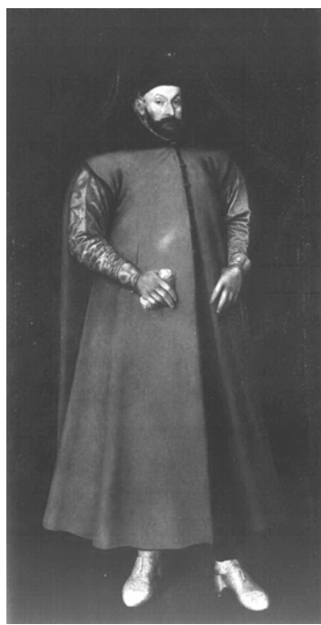
Мал. 10. Мартін Кобер. Портрет Стефана I Баторія, 1583 р.