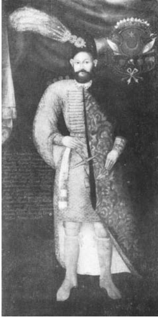
Мал. 5. Невідомий художник. Портрет Яна Криштофа Тарновського, на кін. XVI ст.

Острога, стольника, крайчого та підчашого коронного (друга половина XVII ст.) 24 , Александра Яна Яблоновського, великого хорунжого коронного, полковника коронних військ (1740) 25 , та інші.