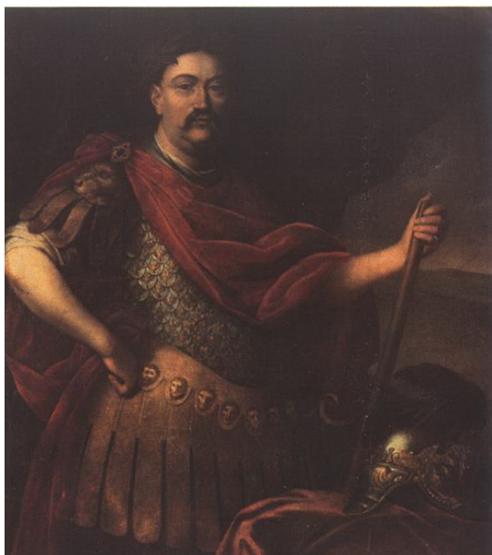
Мал. 7. Єжи Елеутер Шимонович-Семігіновський. Портрет Яна III Собеського, після 1683 р.

Аналогічного плану твір належав пензлю невідомого художника XVIII ст., який зобразив Даміана Тишкевича, каштеляна мінського 30 . Однак найбільш цікавим (з точки зору наслідування в портретах українських діячів) слід вважати портрет Яна III Собеського пензля Єжи Елеутера Шимонович-Семігіновського (після 1683 р.), який зобразив короля в обладунку, що дістав назву карацена. Цей вид озброєння з металеві «луски», яка приклепувалася на шкіряну основу двома-трьома зачльопками, був дуже популярним не лише серед польської чи литовської, але й серед української шляхти. Обладунок, згідно з ідеями про походження польської шляхти від войовничих сарматів, був навмисно стилізований під сарматські катафракти. Він був модним, престижним та надзвичайно дорогим. На відміну від звичайних обладунків, які використовували польські гусари, карацена могла бути не лише поясною 31 , але й на повний зріст. При цьому вона часто була прикрашена декоративними наплічниками та наколінниками із золота у вигляді обличчя «сармата» 32 , що створювало додатковий ефект «войоничості» власника.