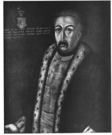
Мал. 19. Невідомий художник. Портрет Стефана Родзянки, 1730-ті рр.

Як вже зазначалося, одним із обов'язкових елементів одягу портретованого польського шляхтича був обладунок. Однак автентичні живописні портрети представників військово-політичної еліти Гетьманщини XVII ст. доводять відсутність цієї деталі. Портрети представників козацької старшини в обладунках європейського типу почали з'являтися пізніше — від 1720-х років (див. зображення гетьманів з Літопису С. Величка, портрет гетьмана І. Мазепи з Андріївською стрічкою тощо) і далі протягом XVIII–XIX ст. Вони були наслідком беззастережного копіювання деталей «сарматського» портрета на догоду замовникам. Говорити про присутність обладунку у вигляді кольчуги, нагрудника або карацени можемо, лише аналізуючи портрети XVII ст., створені в техніці гравюри.