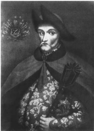
Мал. 26. Невідомий художник. Портрет Леонтія Свічки, кін. XVII ст.

Звертає на себе увагу також той факт, що в «козацьких» портретах художники ретельніше ставилися до зображення клейнодів — символів влади. Вражає розмаїття гетьманських булав та