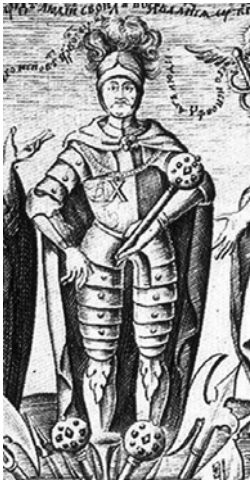
Мал. 22. Іван Мігура. «Іван Мазепа серед своїх добрих справ...», 1705 р.