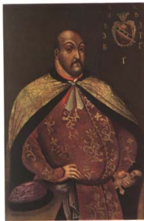
Мал. 18. Невідомий художник. Портрет Василя Гамалії, XVII ст.