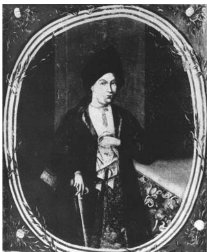
Мал. 32. Невідомий художник. Портрет Анастасії Скоропадської, XVIII ст.