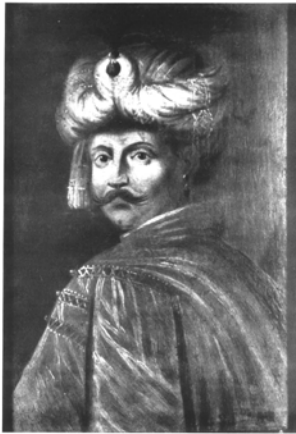
Мал. 17. Невідомий художник. Портрет Тимофія Хмельницького (?), XVII ст.