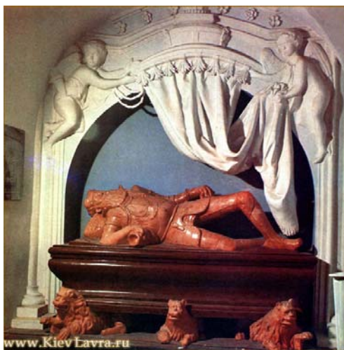
Мал. 1. Себастьян Чешек. Надгробок кн. Костянтина Острозького в Успенському соборі Києво-Печерської лаври, 1579 р. Знищений.

Портретам королів відповідали портрети його підданих — магнатів та шляхти. Як правило, портрет був одноосібний і виконувався в інтер'єрі. Портретованого писали на повний зріст стоячи або сидячи, на фоні колони, драпіровки з коштовних тканин чи пейзажу. В руках або на столі поруч був зображений символ влади — маршалський жезл (палиця), булави чи бузидгани, а для представників духовенства — апостольський посох. На боці у портретованого шляхтича обов'язково була шабля (найчастіше карабела), рідше — меч, шпага. На столі також могли бути зображені рукавички, на знак приналежності до аристократичного роду, книги — як символ освіченості, годинник — як свідцтво працьовитості та сумлінного (пунктуального) виконання своїх обов'язків або як нагадування про плинність часу. Іноді на столі біля зображеного можна було помітити канцелярське приладдя та листи, що, імовірно, могло засвідчувати якусь важливу подію в житті