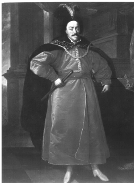
Мал. 3. Даніель Шульц. Портрет Яна III Казиміра, 1650 р.

жезл. Характерною ознакою цього портрета було зображення ланцюга Ордену Золотого Руна.