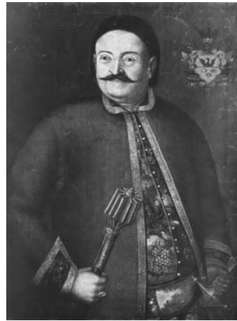
Мал. 27. Невідомий художник. Портрет Семена Сулими, середина XVIII ст.