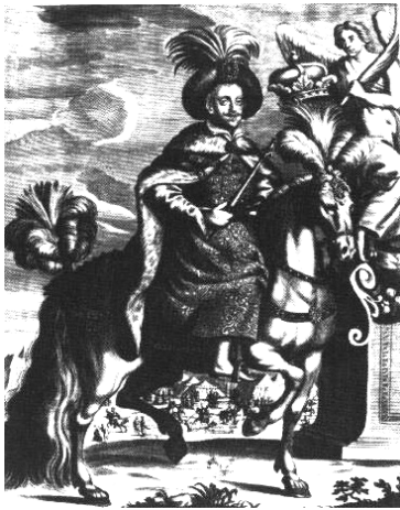
Мал. 14. Майстерня Пауля Фуерста. Портрет Міхала Корибути Вишневецького, 1660 р.

Не менш цікаво поглянути на портрет П. Конашевича-Сагайдачного у порівнянні з серією гравюр Абрагама де Брауна, який 1587 р. створив низку зображень вершників: нідерландського, литовського, турецького та татарського (один з варіантів цієї серії зберігається у Львівському історичному музеї). Надзвичайно цікавим є визначення багатьох спільних рис, які спостерігаються при передачі одягу та озброєння українського гетьмана і татарського вершника. Саме тут доречним буде зазначити, що якщо у випадку визначення особливостей зображення польського «сармата», які потім частково були відбиті й у «козацькому» портреті, ми намагалися наголосити на впливах західноєвропейського ренесансного живопису, на особливостях розвитку надгробної скульптури