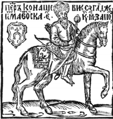
Мал. 12. Невідомий художник. Портрет П. Конашевича- Сагайдачного, 1621 р.

розташовані по-різному (у польських гравюрах традиційно знизу, як епітафійні написи, а в творі українського майстра — зверху). У подібний спосіб, згідно з живописними аналогами парадних кінних портретів, було подано гравіровані зображення Міхала Корибути Вишневецького від 1660 р. 45 Яна III Собеського від 1683 р. 46 , Августа II Сильного від початку XVIII ст. 47 та деякі ін.