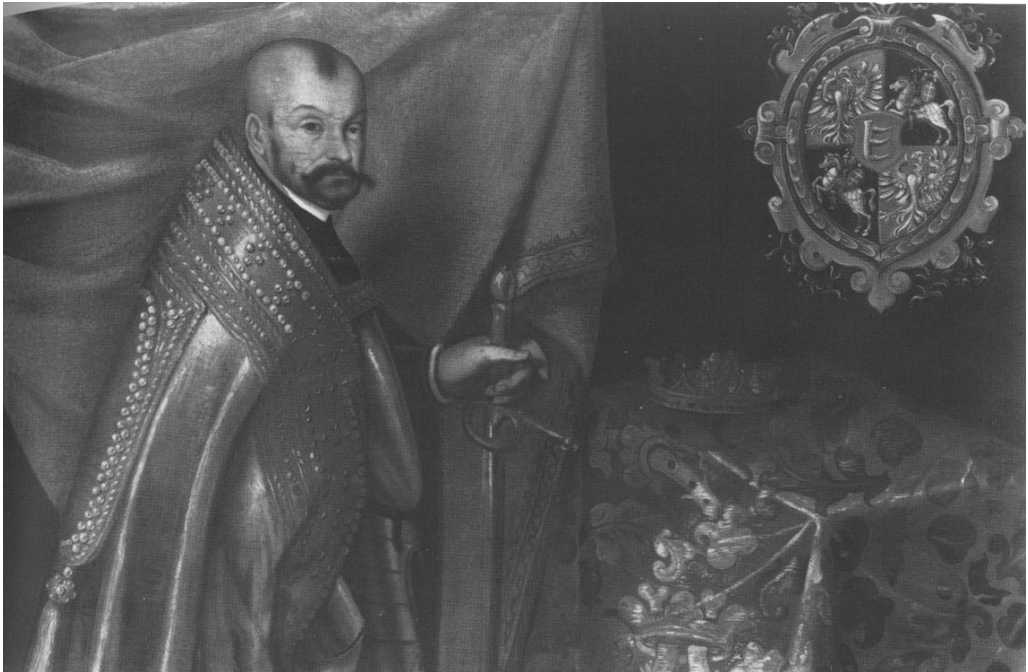
Мал. 2. Невідомий художник. Портрет Стефана I Баторія, 1583 р.

Цікаво, що з розвитком основних постулатів «сарматизму» — ідеології польського народу-шляхти, яка побутувала в Польщі протягом XVI–XVII ст. 8 , найяскравішим її виявом став саме так званий «сарматський портрет». Оскільки польські королі були лише «першими серед рівних», тобто серед панів-шляхти 9 , то не дивно, що традицію сарматського портрета часто виводять від портретів польського короля Стефана Баторія, який здобув собі славу короля-воїна та справжнього «сармата-шляхтича». Йдеться, зокрема, про портрет пензля невідомого художника, що зберігається в Музеї мистецтв у Відні 10 , а також більш відомий портрет пензля Марчіна (Мартіна) Кобера 11 , обидва написані 1583 р. Останній вважається класичним прикладом «сарматського» портрета, який потім наслідували різні художники, виконуючи на замовлення портрети польської шляхти.