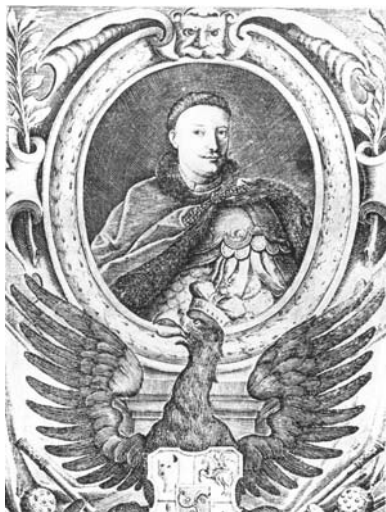
Мал. 20. Леонтій Тарасевич. Портрет Кароля-Станіслава Радзивілла, 1692 р.

Л. Тарасевичем на портретах Кароля-Станіслава Радзивілла 67 , Бориса Петровича Шереметьєва (1695) 68 , а також Федора Шакловитого в образі св. мученика Федора Стратилата (1689) 69 . Іван Щирський відтворив лицарські обладунки (кірасу) з наручами в портреті шляхтича К. Клокоцького (1685) 70 , а Олександр Тарасевич — в портреті Михайла Паца (1686) 71 . Браสลавського маршалка Яна Огінського було зображено в кольчuzі з буздиганом у руці 72 . Однак це були портрети представників литовської шляхти.