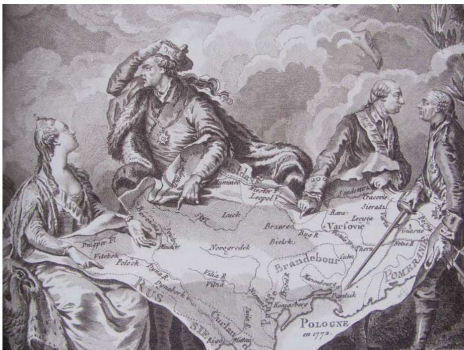
Фрагмент карикатури англійського друкаря і картографу Роберта Сеєра «Королівський пиріг» (1772), присвяченої першому поділу Речі Посполитої

Те, що Польща, словами американця Томаса Джеферсона, стала «країною, стертою з карти світу через розбрат її громадян», породило очевидний прецедент: чи достатньо «стерти з мапи» для того, щоб саме «питання» було знятим? І чи є присутність на мапі необхідною ознакою існування?