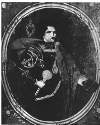
Мал. 33. Невідомий художник. Портрет Івана Скоропадського, XVIII ст.

Очевидно, що тут на ситуацію суттєвий вплив мав сам спосіб життя козацької верстви, пов'язаний із військовою небезпекою, відсутністю впевненості у найближчому майбутньому, що не давало можливості багато часу проводити у товариських застіллях чи плекати традиції добросусідських відносин та гостинності, на чому тримався образ шляхтича-землевласника у Речі Посполитій. До того ж, українська жінка-козачка рідко мала можливість бути лише привітною господинею дому. Вона була змушена і будинок тримати, і господарством опікуватися, і дітей виховувати, і громадські функції виконувати, а іноді навіть заступати свого чоловіка на уряді. Отже українські реалії не давали ґрунту для розвитку такого типу сімейних портретів. Вони з'явилися значно пізніше, у XIX ст., у зв'язку із розвитком реалістичного мистецтва, втіленого майстрами Академії мистецтв Російської імперії, і поширені були лише у дворянському середовищі.