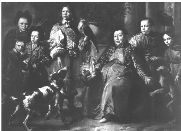
Мал. 9. Даніель Шульц. Портрет Дедеш Агі з синами та слугами, 1664 р.