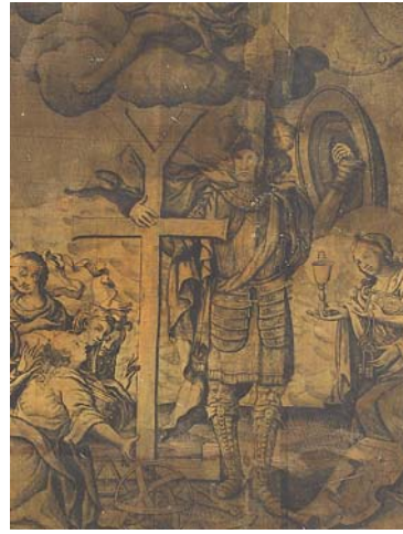
Мал. 23. Данило Галяховський. «Апофеоз Івана Мазепи», 1708 р.