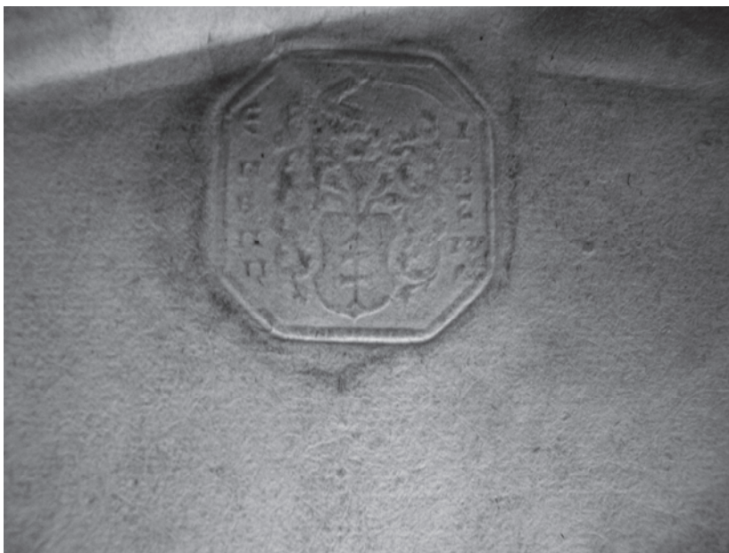
Відбиток печатки миргородського полковника Павла Апостола (папір, сургуч, тиснення) наприкінці його листа до батька — гетьмана Данила Апостола з донесенням про неможливість направити трьох козаків Кременчуцької сотні та одного із Омельницької сотні Миргородського полку на спорудження Української лінії 17 грудня 1731 р. до гетьмана // ЦДІАК України. — Ф. 51: Генеральна військова канцелярія. — Оп. 3. — Спр. 4301. — Арк. 3 зв. Рукопис, оригінал.