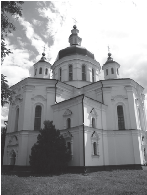
Спасо-Преображенський собор 1732–1734 рр. с. Великі Сорочинці Миргородського р-ну Полтавської обл. 2011 р.

ЦДІАК України. — Ф. 51. — Оп. 3. — Спр. 4301. — Арк. 1–3 зв. Рукопис, оригінал.