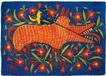
Лисиця запрягла вовка

Ви, люди, на цю картину подивіться і за мир боріться