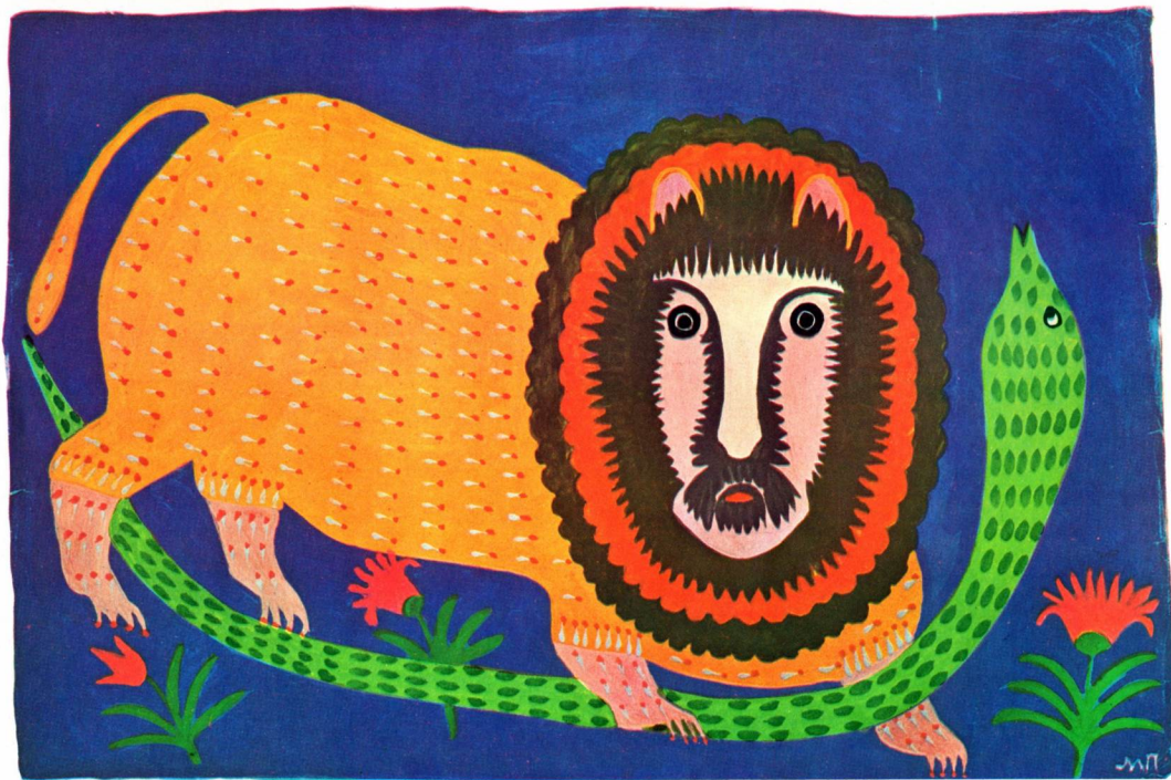
Стародавній лев подружив з гадюкою