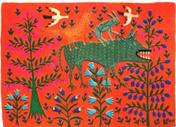
Вовк у лісі