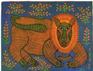
Лев і цук