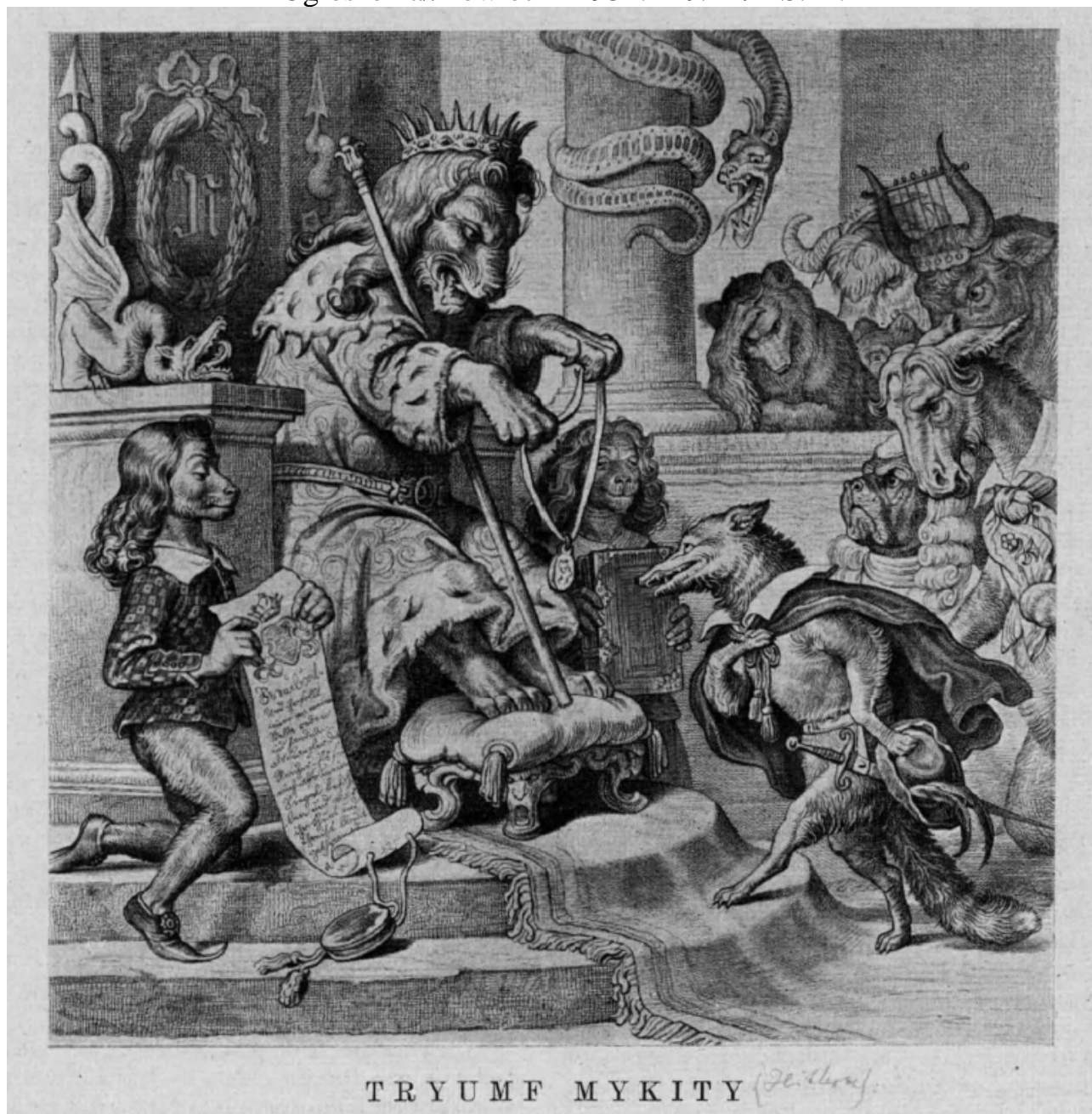
TRYUMF MYKITY (Z. Krawiec)

Ogłoszenia//Łowiec – 1934. – № 1. – S.12.