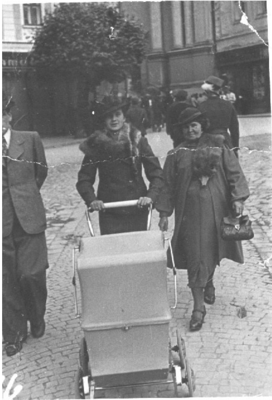
Галицькі модниці у строях з хутром лисиці, 1938 р.

Najwyższe ceny za skóry wszelakiego rodzaju, jakoto lisy, kuny, tchórze, skórki zajęcze, rożki sarnie i jelenie, płaci firma FALL, Wagowa 5, LWÓW.