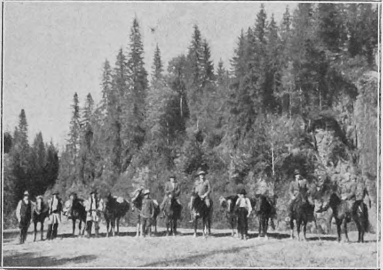
W drodze nad Białym Czeremoszem.