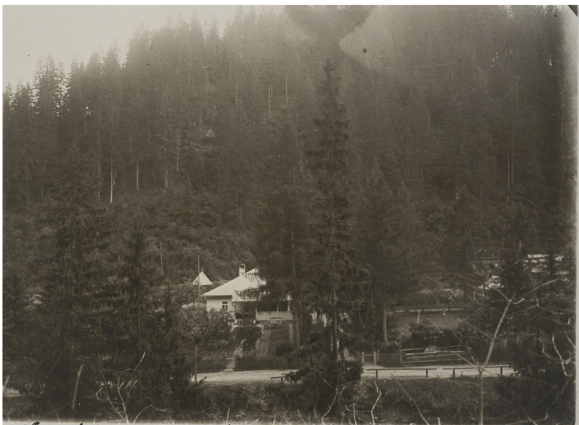
Kałużniczówka państwowa w Hryniewie. — 6.IX.1933.