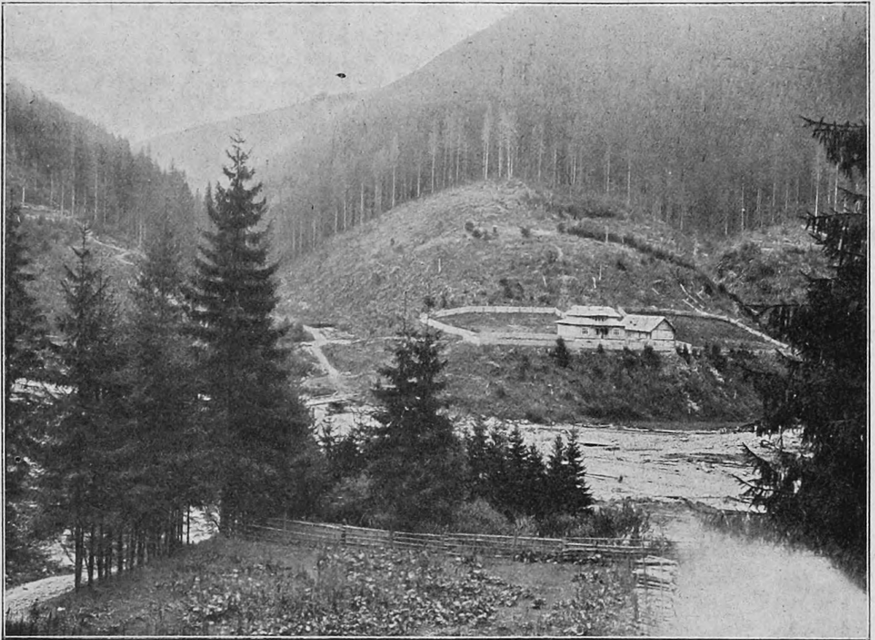
Widok na Czarny Czeremosz i leśniczówkę. (Do art. „Wśród huculów”).

лісового товариства, працював у державних лісах у Гриняві з 1873 року, а з 1881 року виконував обов'язки у найдальшому лісництві, де бере початок Черемош і на кордоні межують Галичина, Буковина та Угорщина. 31