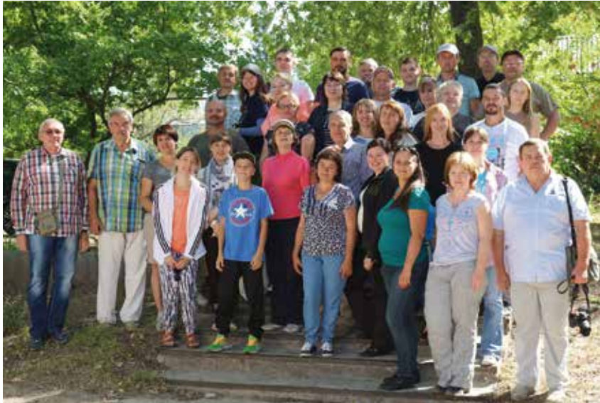
Екскурсія делегатів ентомологічного з'їзду в НПП «Гомольшанські ліси»

запропонувати балову оцінку його поширення та розрахувати площу потенційних осередків з урахуванням типу лісорослинних умов і віку насаджень (Іван Бобров, 2011, 2012, 2018). Серед заходів запобігання шкоді від цієї комахи запропоновано проведення прочищення культур в оптимальні терміни, збагачення лісової підстилки листям різних порід, застосування добрив, хімічних і біологічних інсектицидів.