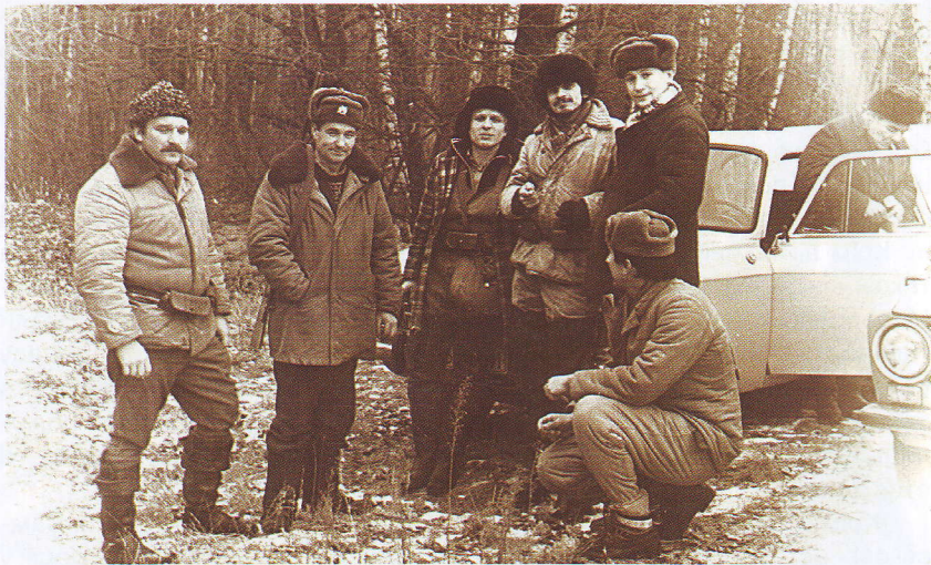
КВМ № 171 (колектив військових мисливців) районного Києво-Святошинського військкомату під час полювання на косулю в грудні 1984 року в угіддях Ржищівського мисливського господарства

» ронців з числа воєнних інвалідів у Білянках під Краковом. У 1916 році було випущено перших 26 кандидатів. Цей факт підтверджує, що професія військового є найбільш спорідненою з галуззю мисливства.