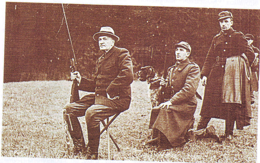
Президент Польщі Ігнацій Мосцицький під час полювання, 30-ті роки двадцятого століття

Після Першої світової війни були організовані курси з навчання мисливських та лісових охо-