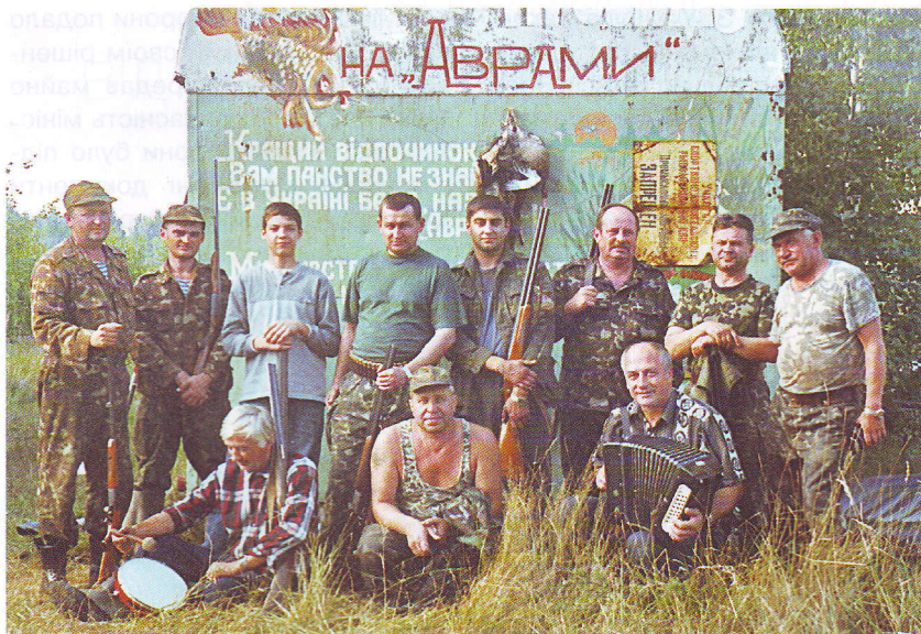
КВМ № 179 Науково-дослідного центру професійного здоров'я льотного складу ЗСУ на відкритті полювання на пернату дичину в серпні 2005 року в урочищі Аврами Ржищівського МГ

червоноармійців, командирів, політробітників.