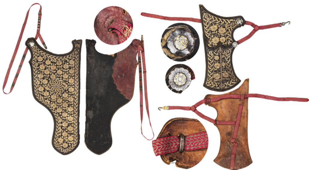
Рис. 9. Сагайдак першої половини XVII ст. із зібрання Королівської скарбниці в Стокгольмі (© The Royal Armoury, Stockholm).

з кольорового металу, дехто вважає їх гудзиками, а інші відносять до вуздечного або поясного набору. Тут окремо треба зауважити, що деякі накладки теоретично могли б використовуватися і в інших ролях, окрім фіксації елементів сагайдаку. Це цілком можливо при зміні системи кріплення на тильному боці накладки. Але накладки з глибокою й широкою петлею варто вважати в першу чергу елементами саме сагайдачного набору.