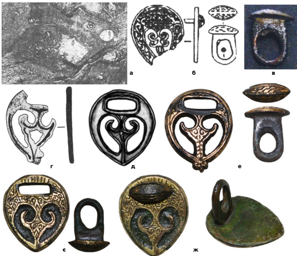
Рис. 1. (а, б) – Залишки шкіряного колчана з накладками для підвісу знайдені в адигському кургані поблизу селища Чегем II в Кабардино-Балкарії (Росія); (в) – «гудзик» із Білгород-Дністровського (Одеська обл.); (г) – фрагмент прорізної накладки з Мангупу (Крим); (д) – прорізна накладка із Білгород-Дністровського (Одеська обл.); (е) – комплект з приватної колекції (знайдений в Світловодському р-ні Кіровоградської обл.); (є) – комплект з приватної колекції (знайдений поблизу с. Цибулеве Кіровоградської обл.); (ж) – загальний вигляд накладки такого типу у зібраному стані.

ми була зроблена при розкопках адигського кургану в Кабардино-Балкарії (Росія) (курган 6, могильник 2 поблизу селища Чегем II) (Рис. 1, а, б) 12 . Колчан був прикрашений позолоченими бронзовими накладками (петля вбула відлита окремо у вигляді «гудзика» з невеликою шляпкою) й склад-