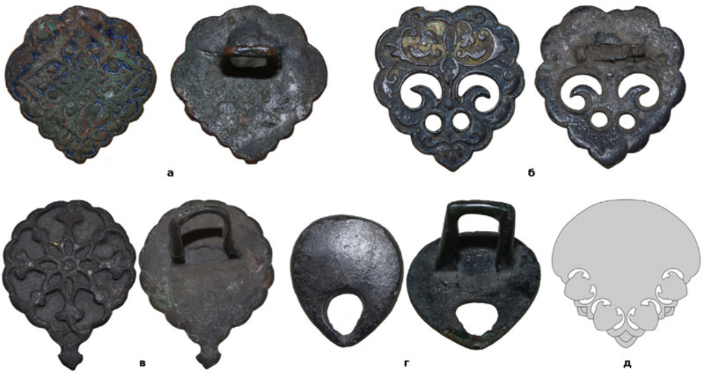
Рис. 3. (а) – Накладка з приватної колекції (знайдена поблизу с. Пекарщина Житомирської обл.); (б) – накладка з приватної колекції (знайдена поблизу с. Лубни Полтавської обл.); (в) – накладка з приватної колекції (знайдена поблизу с. Опішне Полтавської обл.); (е) – накладка з приватної колекції (знайдена в Вінницькій обл.); (д) – промальована накладки з московського колчана 1570-80-х років із зібрання Музею історії мистецтв у Відні.