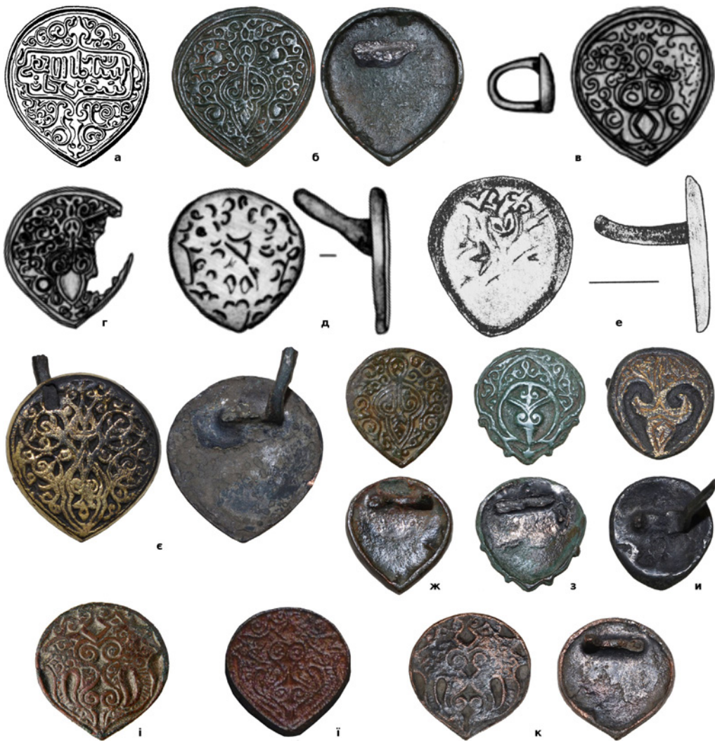
Рис. 2. (а) – Накладка знайдена в Саратовській губернії; (б) – накладка з приватної колекції (знайдена поблизу м. Батурин Чернігівської обл.); (в-д, і) – накладки із Білгород-Дністровського (Одеська обл.); (е) – накладка з Мангупу (Крим); (є) – накладка з приватної колекції (знайдена в Новобузькому р-ні Миколаївської обл.); (ж) – накладка з приватної колекції (знайдена в Херсонській обл.); (з) – накладка з приватної колекції (знайдена в Роменському р-ні Сумської обл.); (и) – накладка з приватної колекції (знайдена поблизу с. Деріївка Кіровоградської обл.); (і) – накладка із Сарайчика (Атирауська обл., Казахстан); (к) – накладка з приватної колекції (знайдена поблизу с. Круничполе Чернігівської обл.).