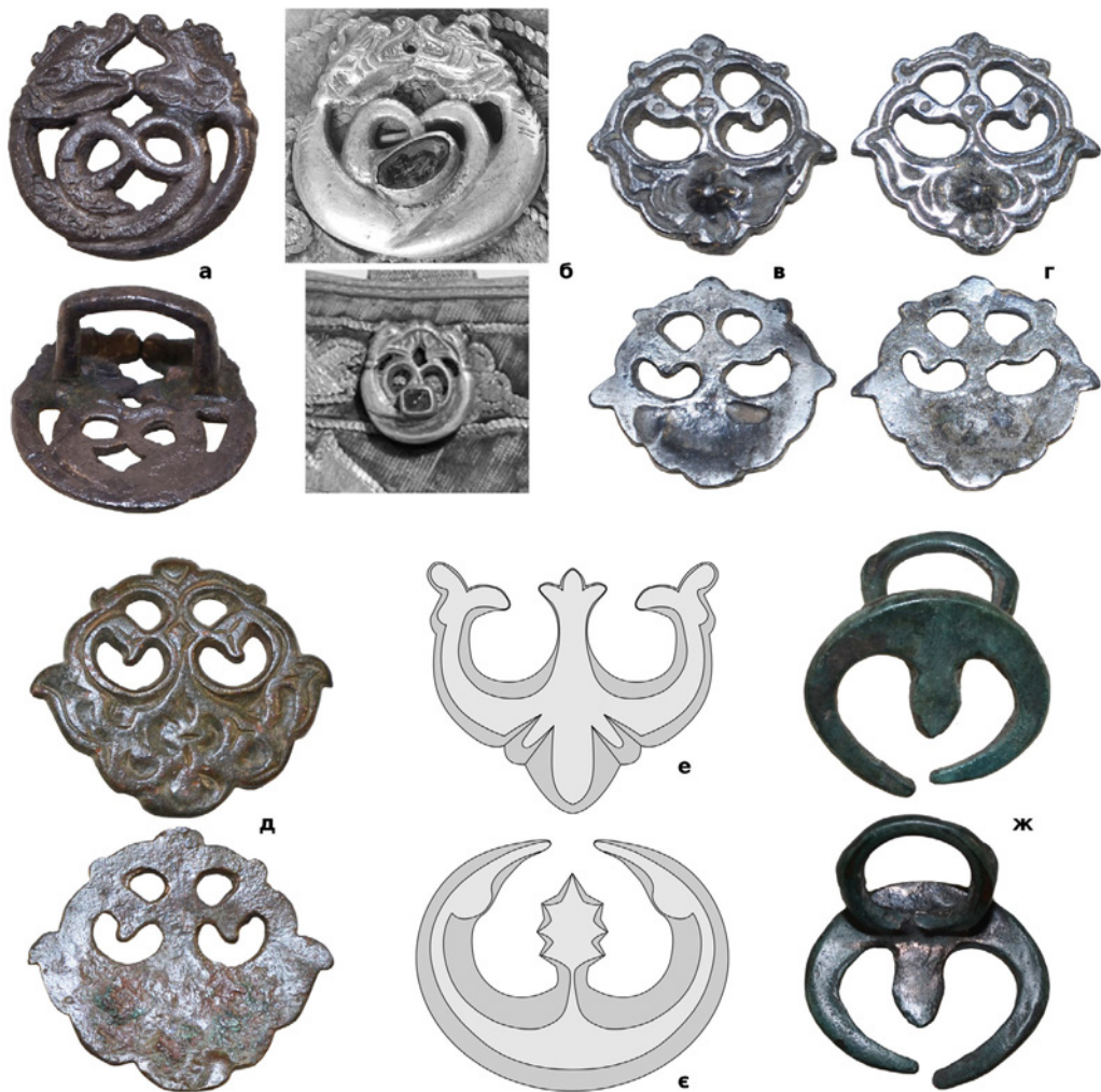
Рис. 5. (а) – Накладка з приватної колекції (знайдена поблизу с. Розівка Одеської обл.); (б) – накладка на татарському сагайдаку початку XVII ст. із зібрання Королівської скарбниці в Стокгольмі; (в) – накладка з приватної колекції (знайдена в Одеській обл.); (г) – накладка з приватної колекції (знайдена в Криму); (д) – накладка з приватної колекції (місце знахідки невідоме); (е) – промальована накладка з турецького колчана XVII ст.; (є) – промальована накладка з татарського колчану початку XVII ст. із зібрання Московського Кремля; (ж) – накладка з приватної колекції (знайдена в Житомирській обл.).