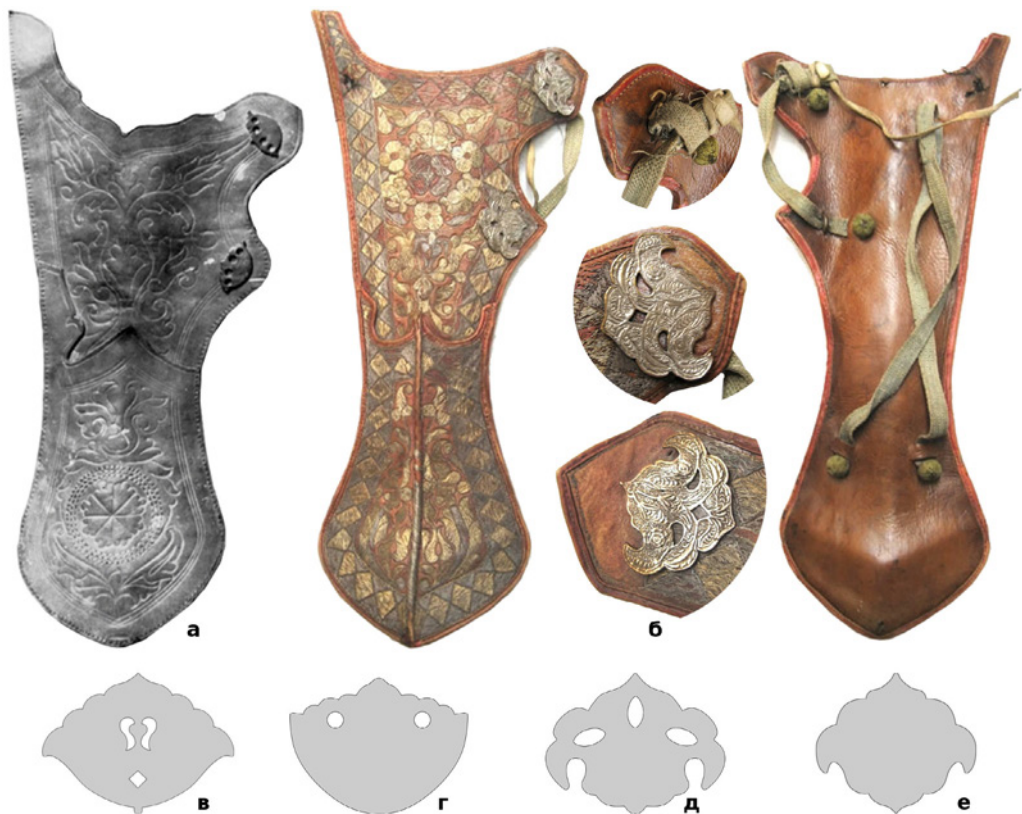
Рис. 7. (а) – Колчан XVII ст. із зібрання Королівської скарбниці в Стокгольмі (© The Royal Armoury, Stockholm); (б) – сагайдак XVII ст. із зібрання Королівської скарбниці в Стокгольмі (© The Royal Armoury, Stockholm ); (в) – накладка з московського сагайдака першої половини XVII ст.; (г) – накладка з турецького сагайдаку середини XVI ст.; (д) – накладка з московського сагайдака другої половини XVII ст.; (е) – накладка з турецького налучу XVI ст.

Накладки першої групи широко використовувалися на сагайдаках від XVI до XVIII ст. Зокрема відомі два турецьких сагайдака XVI ст. із зібрання Музею історії мистецтв у Відні (Інв. ном. С1 та С-1а) (Рис. 7, г) 36 та (Інв. ном. У-177) 37 з простими гладенькими накладками. Також гладенькі, без додаткових прикрас, накладки можна побачити на московсько-