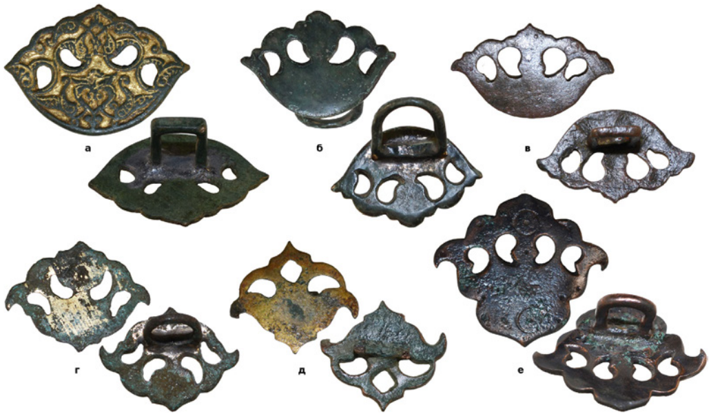
Рис. 6. (а) – Накладка з приватної колекції (знайдена на р. Рів поблизу с. Сербинівці Вінницької обл.); (б) – накладка з приватної колекції (знайдена в Вінницькій обл.); (в) – накладка з приватної колекції (знайдена в Одеській обл.); (г) – накладка з приватної колекції (місце знахідки невідоме); (д) – накладка з приватної колекції (знайдена в Криму); (е) – накладка з приватної колекції (знайдена в Одеській обл.).

або мідного сплаву основи допаювалася петля з відповідного металу. Ззовні гладенькі або з рельєфним орнаментом (часто рослинним орнаментом) їх зазвичай робили з симетричними фігурними отворами, а їх поверхня покривалася позолотою.