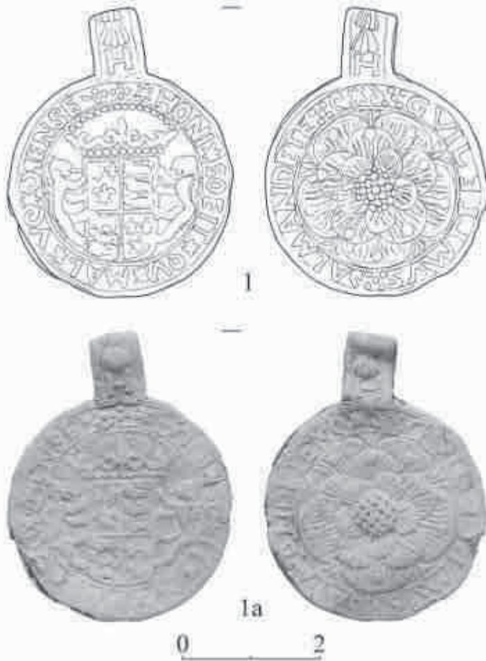
Рис.2. Товарна пломба «англійського характеру» з м. Хотин, Чернівецької обл. України.