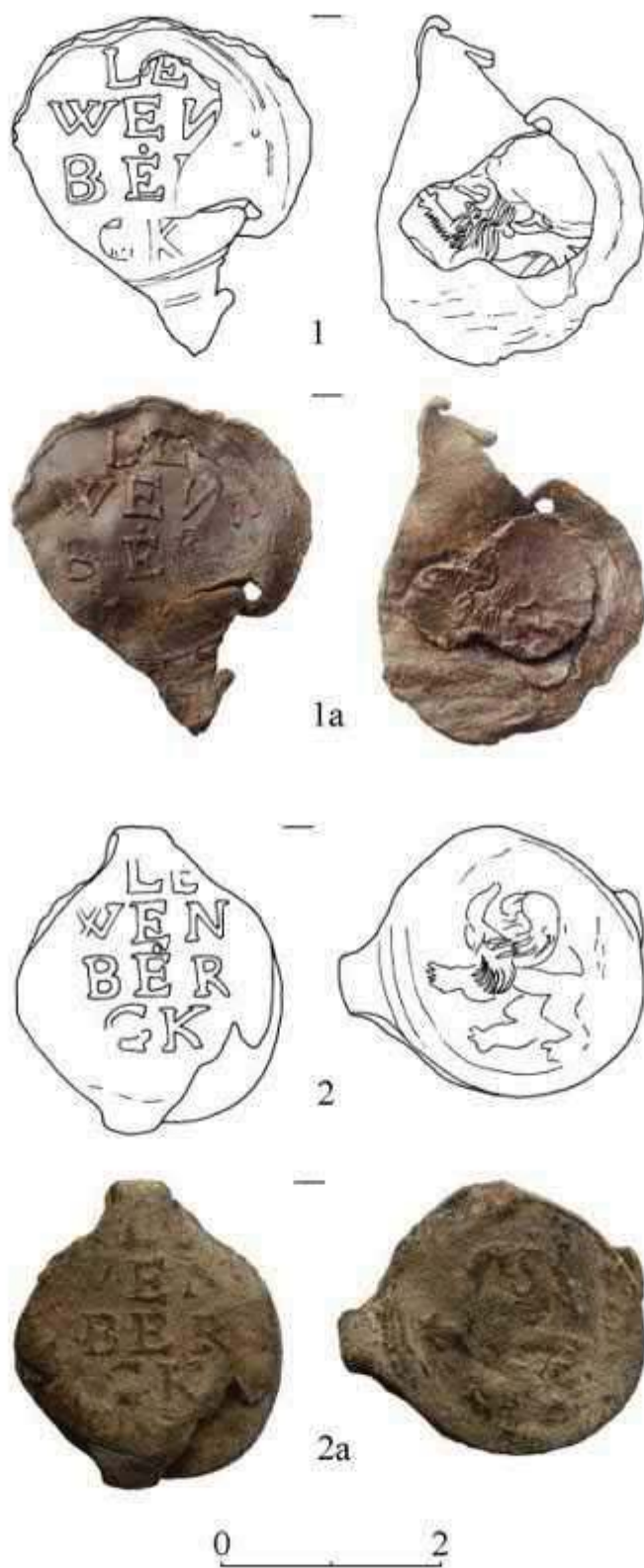
Рис.5. Суконні пломби з с. Невицьке, Закарпатської обл. України.