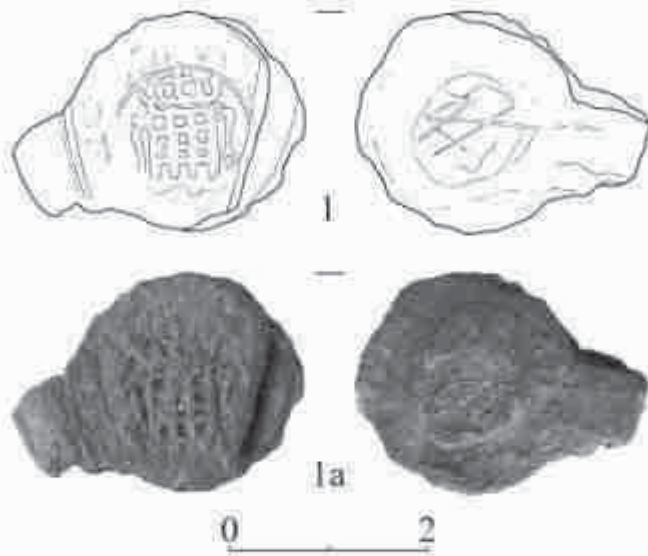
Рис.1. Англійська текстильна пломба з с. Невицьке, Закарпатської обл. України.