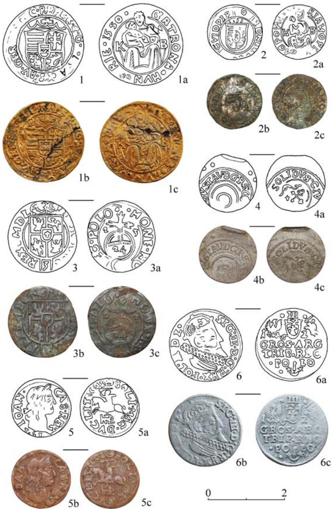
Рис. 2. Середнянський замок. Монети.