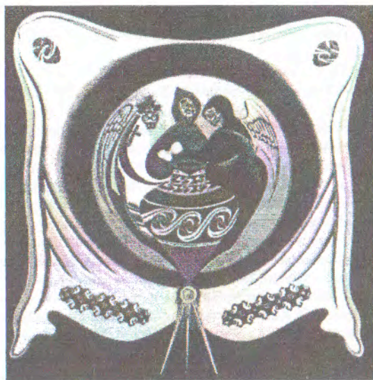
Графіка Маурін Стефанюк, м. Едмонтон, Канада, 2002