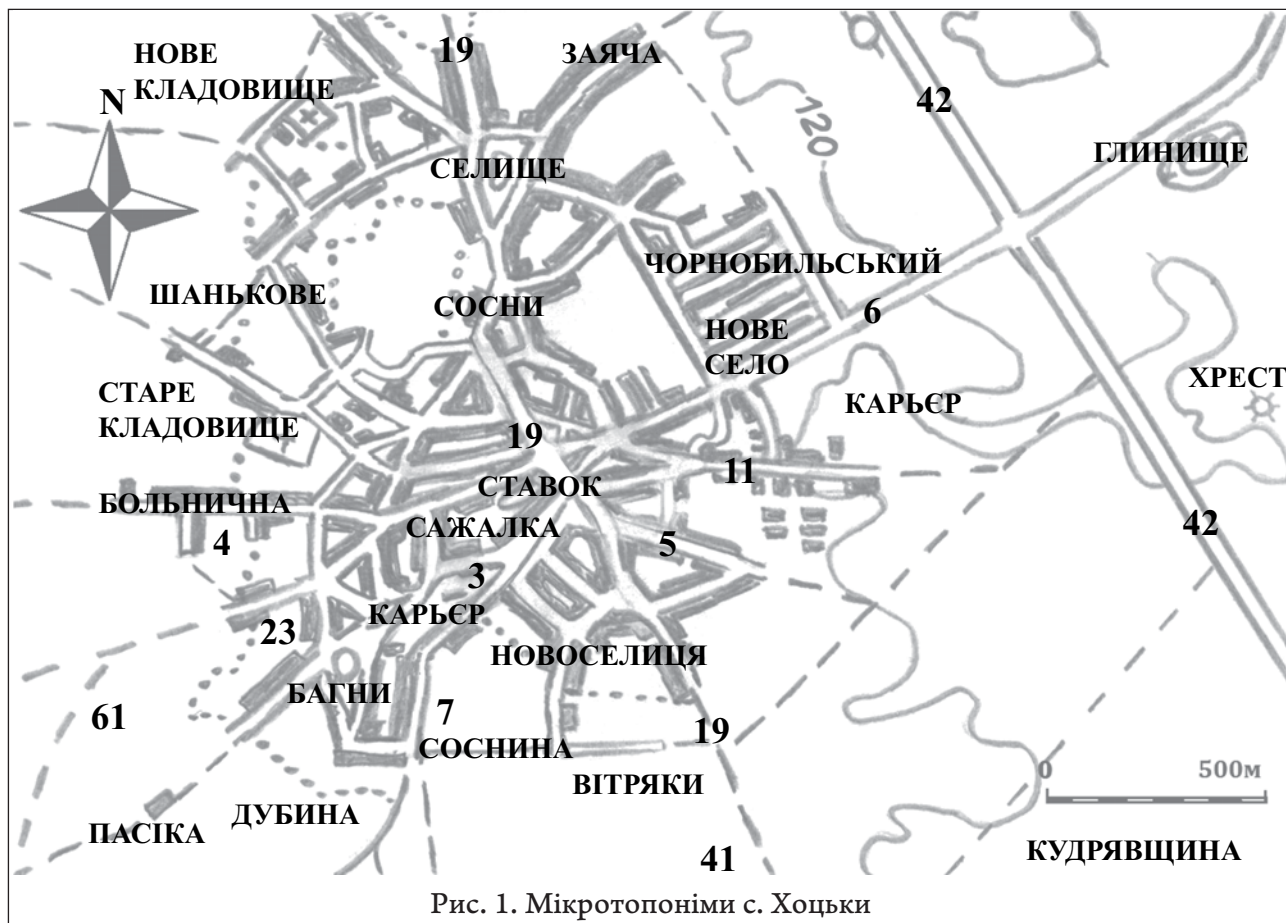
Рис. 1. Мікротопоніми с. Хоцьки

11. Колгоспна дорога або Хрестова – дорога ХІХ ст. – середини ХХ ст. Назва Хрестова походить від напрямку руху повз курган з хрестом. З другої половини ХХ ст. розповсюджується назва Колгоспна. Бере свій початок у центрі біля Ставка і закінчується в будівлях колишнього колгоспу. У межах села понад 1,5 км.