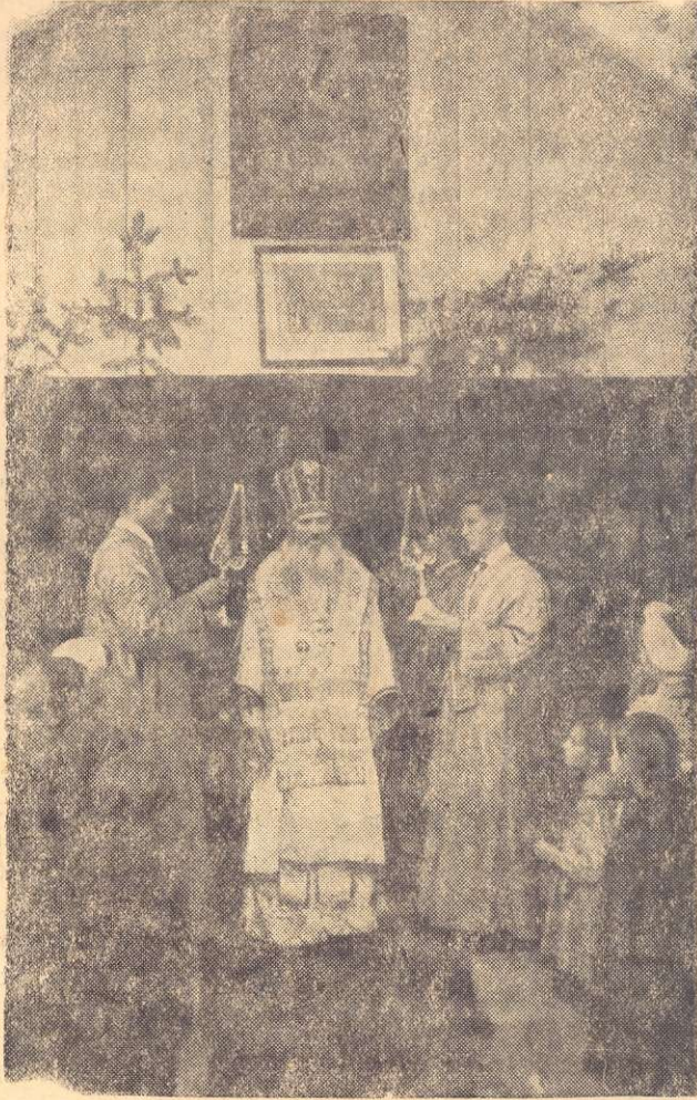
Архієп. Макарій під час Літургії на Чернечій горі в Мукачеві.

Тисячу літ ви були відірвані від свого матернього пня, не тільки від Києва й Москви, але навіть від сусідньої Галичини. Тому ви й не