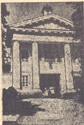
Входова брама в Почаївську Лавру

Почаїв притягає до себе також і монументальністю та красою своїх церков. Любимо ми св. Юр у Львові. Почаївський головний, тобто Успенський собор, той же самий Юр, у тому ж самому стилі — рококо