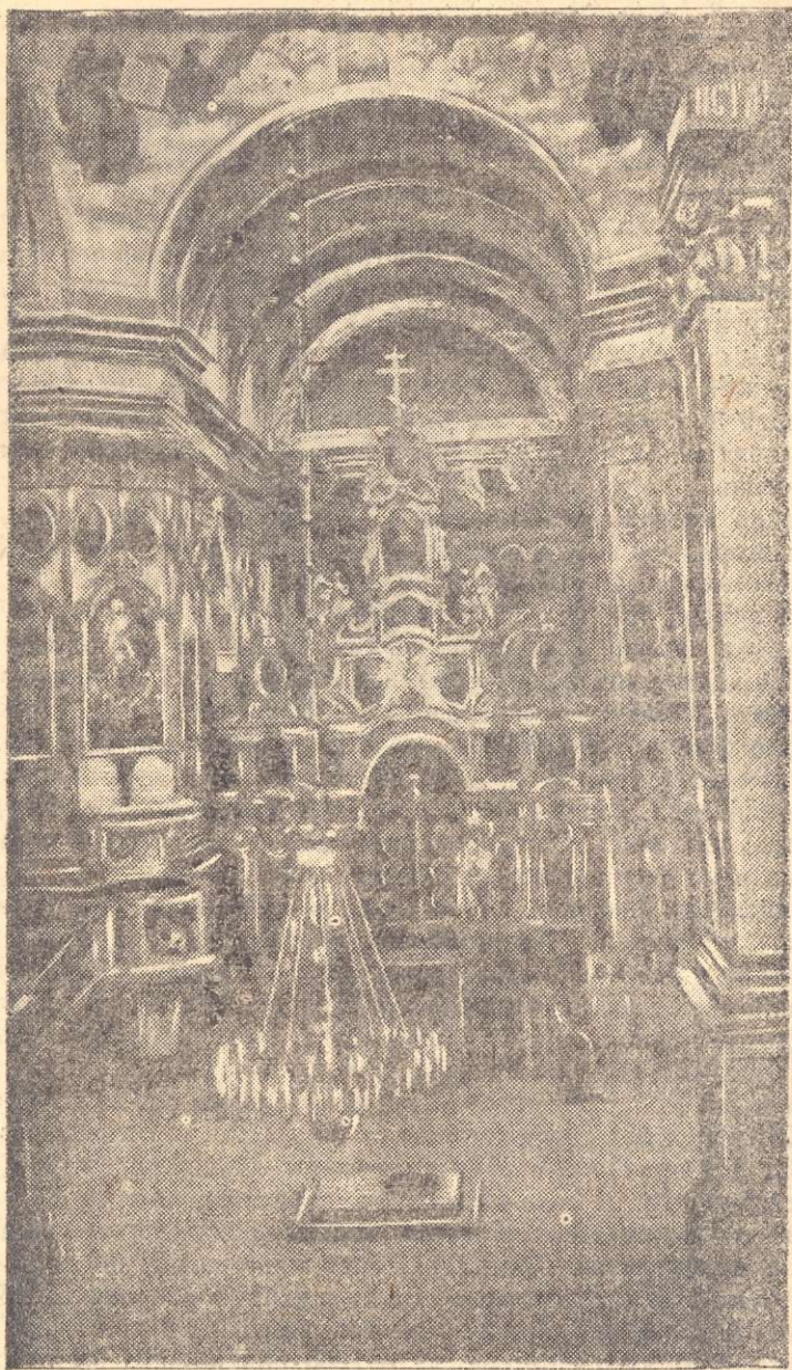
Іконостас у Св.-Успенському Почаївському соборі

згадувати ні за нього, ні за його нетлінні моці. Але не пощастило виконати цього плану, бо не забув за св. Йова ні український нарід, ні небо. Навпаки, чуда від мощей в той час ще збільшилися. І треба було дозволити прочанам ставити свічки перед мощами, а навіть тихцем правити перед ними молебни. Граф Микола Потоцький розпочав був навіть з Ри-