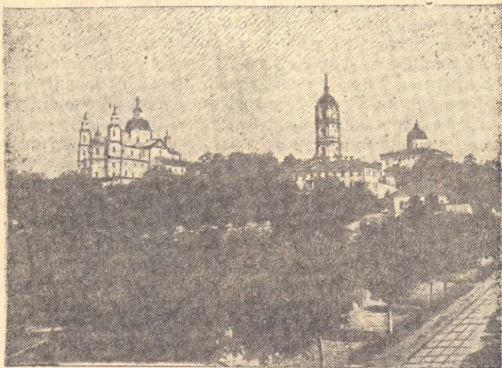
Загальний вид Почаївської Лаври

зи: з правого боку зображений у цілий ріст св. пророк Ілія і під ним св. мученик Міна, а з лівого боку — св. первомученик Стефан і під ним преподобний Аврамій; внизу намальовані по пояс: по середині св. великомучениця Катерина, по праву руку від неї св. Параскева П'ятниця, а зліва — св. Ірина. Ці додаткові образи свідчать, що ікона була родовою, тому на ній додатково вміщені ті Святі, яких імена носили члени тієї родини. Ось такий образ дістала «богобоязна» Анна Гойська від митрополита. Згодом домашні Гойської почали помічати, що образ цей подеколи світиться якимсь незвичайним світлом. Вслід за іншими і сама