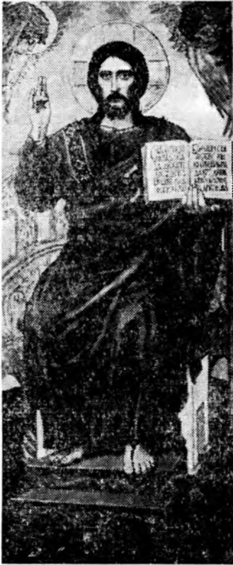
Христос-Спаситель, з іконостасу св.-Володимирського собору. В. М. Васнецов

Старозавітні пророцтва про Христа — Примири-теля роду людського. Падша людина, потьмарена гріхом і горем, не встигла ще як слід і подумати про спасення, як милосердий Господь дав знати їй, що для неї ще не все втрачено, що Бог так любить чоловіка, що дасть йому такого Нашадка, Який подолає спокусника і тим дасть людям можливість безперешкодно спілкуватися з Богом — Джерелом усякого добра, миру й любові.