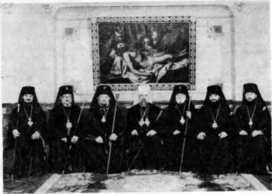
Препосвященні учасники 25-річного ювілею Львівського Собору. В центрі — митрополит Філарет, Екзарх України

наших благочестивих предків: до віри великої княгині Ольги і рівноапостольного Володимира, до віри преподобних отців наших Антонія і Феодосія Печерських, до віри Романа, Данила, Льва, князів Волинських і Галицьких, до віри митрополита Київського Петра Могили, до віри всіх оборонців предковичного Православ'я на землях Західної України.