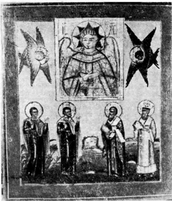
Ісус «Благое молчание» із святыми. Ікона (XIX ст.) з архіологічного кабінету Одеської духовної семінарії.

Чим керувалася Церква, визначаючи день того чи іншого празника? Перше ніж