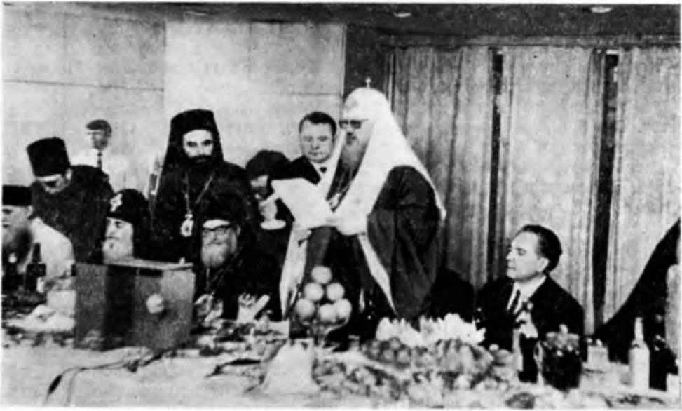
Промова Святішого Патріарха Пимена на прийомі в день інтронізації