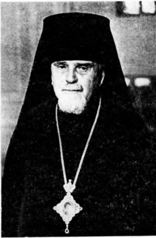
Преосвященний Миколай, єпископ Курський і Белгородський

Хіротонія єпископа Курського і Белгородського Миколая відбулась у день празника святого рівноапостольного князя Володимира, 28 липня, на Божественній літургії у св.-Володимирському кафедральному соборі м. Києва. Хіротонію відправляли архіпастирі, учасники чину наречення, на чолі з високопреосвященим Філаретом, митрополитом Київським і Галицьким, Екзархом України.