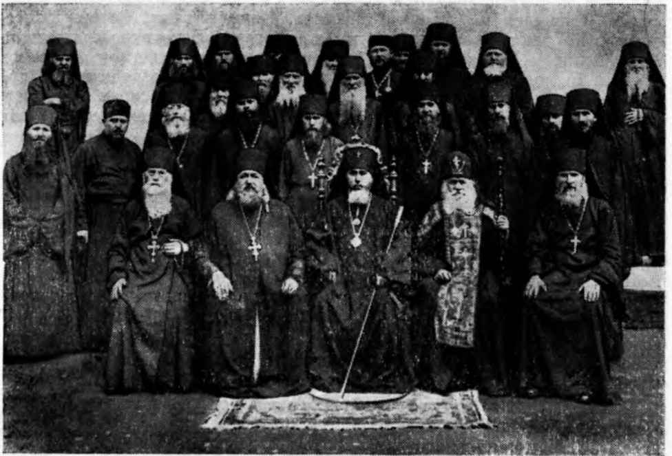
АРХІЄПІСКОП ХЕРСОНСЬКИЙ І ОДЕСЬКИЙ СЕРГІЙ З БРАТІЄЮ ОДЕСЬКОГО СВ.-УСПЕНСЬКОГО МОНАСТІРЯ.