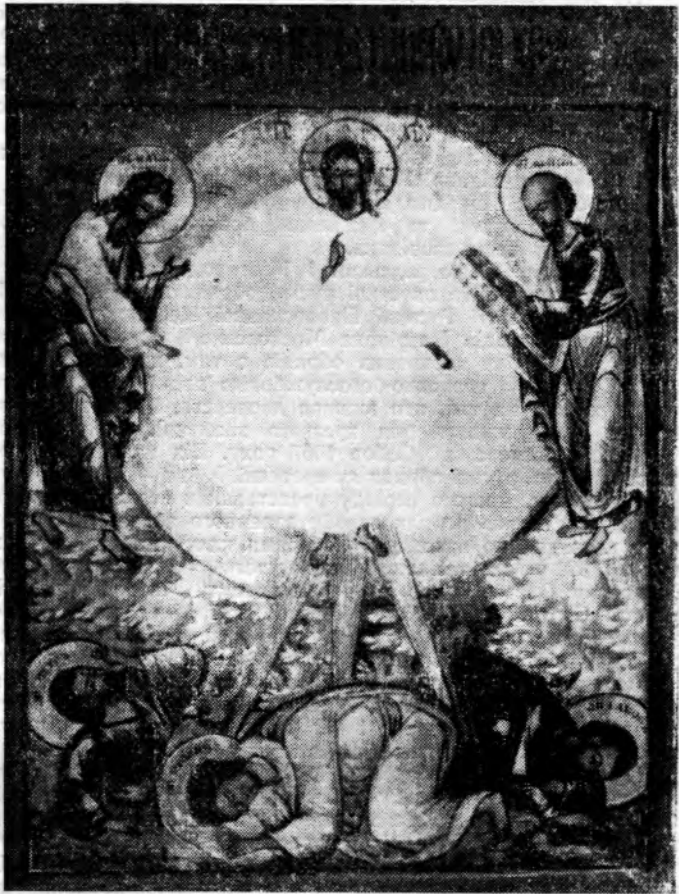
Преображення Господне. Ікона (XVIII) з археологічного кабінету Одеської духовної семінарії.

Удень члени й почесні гості Собору сфотографувалися разом на фоні Трапезного храму, де засідає Собор.