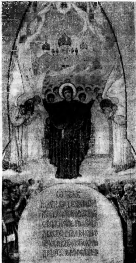
З розпису св.-Володимирського собору м. Київ.

ЛІТУРГІЯ ОГЛАШЕНИХ. Вступна частина Літургії (дякування) з давніх часів була відкрита для всіх. На ній могли бути і ті, хто не прийняв хрещення, і люди, які готувалися до нього, проходили катехізацію (оглашення). Тому ця частина Літургії мовою церковного уставу називається «Літургією оглашених». Уся вона пройнята духом євангельської радості: центром її є читання Нового Завіту.