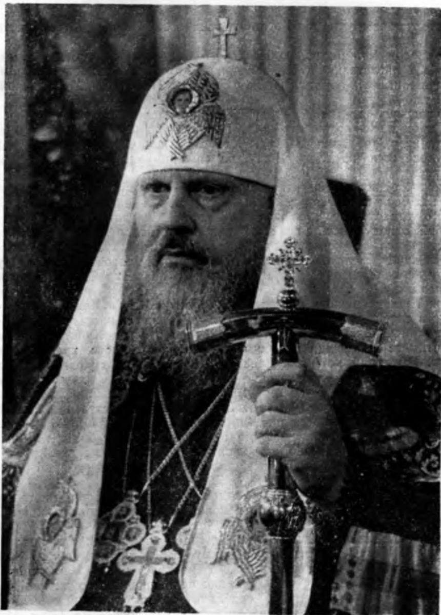
СВЯТИШИЙ ПАТРІАРХ МОСКОВСЬКИЙ І ВСІЄЇ РУСІ ПИМЕН.