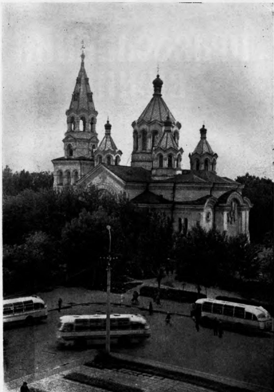
СПАСО-ПРЕОБРАЖЕНСЬКИЙ КАФЕДРАЛЬНИЙ СОБОР, М. ЖИТОМИР.