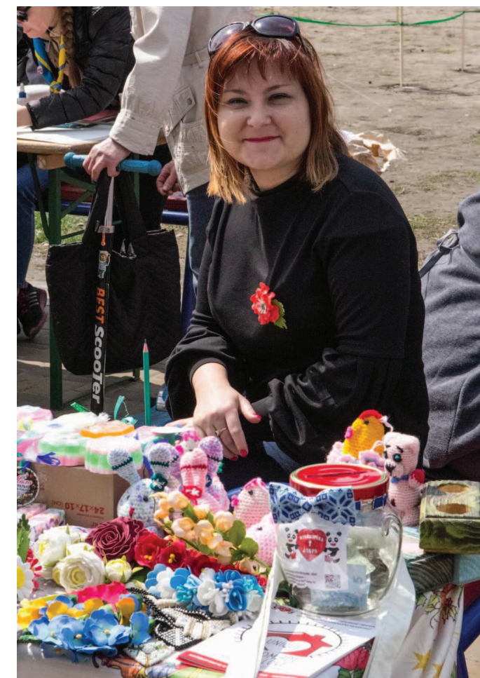
Ярмарок «Крамнички добра»

Ми спочатку думали, що ТМ «Крамничка добра» буде орієнтуватися лише на реабілітацію поранених. Коли ж усе почалося, нам стали писати хлопці з фронту, що вони теж роблять різні цікаві речі і готові їх виставляти. Але разом з тим, почали писати онкохворі, що їм