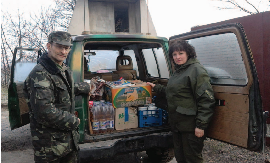
Ось такими машинами продукти доставляються на передок. Донецька обл.

Люди на початках нас дуже підтримували. Особливо ті, у кого рідні пішли воювати. Я давала оголошення в місцевій газеті, писала, що потрібно, вказувала свій телефон. На початках було дуже багато адресних посилок: коли когось із села мобілізували, то все село скидалося, щоб йому щось передати. «Нова пошта» тоді не так ще працювала, проблем було багато, а ми намагалися тоді працювати, як пошта. Не тільки ми: часто ми передавали ці посилки в Рівне, в «Руєвित», вони передавали далі своїми волонтерами і ми вже просто віддзвонювалися солдатам – отримали вони чи не отримали?