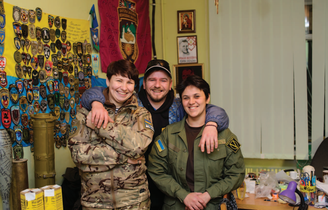
У Тернопільському Штабі

і тут – стук у двері. Відкриваю – а на порозі стоїть відро теплої води із запареною м'ятою. Тобто вони в цьому їхньому розписаному по хвиликах житті знайшли момент подумати про мене і запарити мені м'яти! От із таких моментів складається життя.