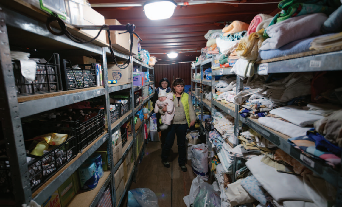
Волонтерський склад: дитина роботі не завада