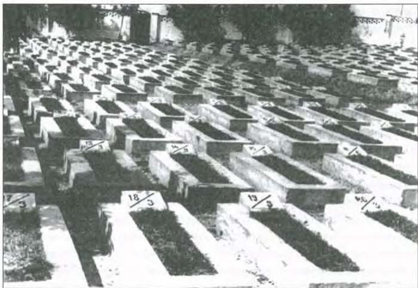
Цвинтар для військовополонених табору МВС СРСР №275, м. Львів (Замартинівське кладовище). Світлина 1967 р.