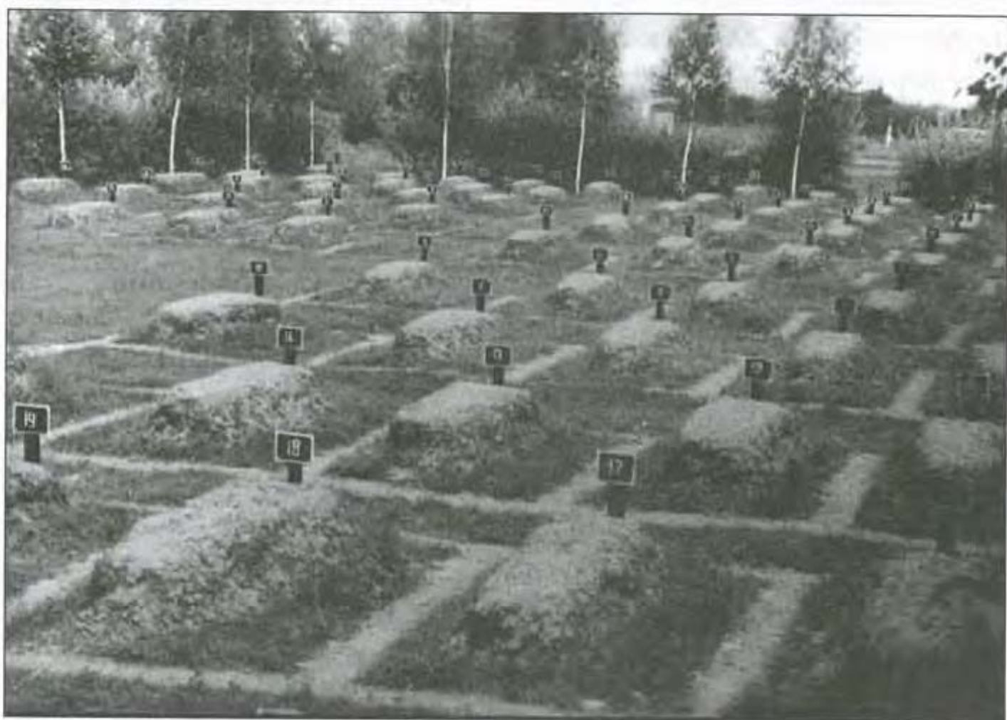
Кладовище військовополонених табору №134, м. Суми. Світлина 1970 р. ДА МВС України. – Ф.7. – Оп.1. – Спр.733. – Арк. 30.