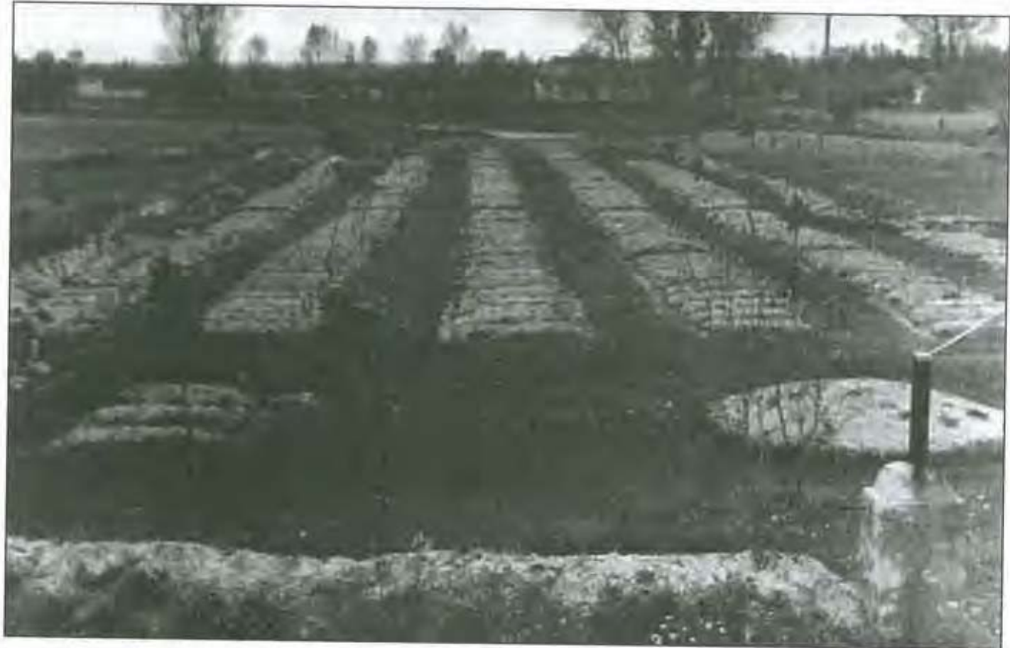
Кладовище № 2 ОРБ № 413, розміщене в урочищі „Табори” Ковельського р-ну Волинської обл.

надзвичайні обставини, а небажання табірних адміністрацій обтяжувати себе такими дрібницями, як гідне поховання військовика ворожої армії. Тим більше, що до початку 1946 р. нормативні документи НКВС СРСР дозволяли такий спосіб поховання „як винятковий”. Водночас досить очевидною виглядає думка, що це не була практика, застосовувана режимом виключно в ставленні до іноземних військовополонених та інтернованих. Численні факти свідчать: так само влада ставилася й до власних солдатів. Масові анонімні поховання в період Другої світової війни були ознакою радянського фронту, а значною мірою й тилу. „Невідомий солдат”, „безіменний герой” – звичні поняття радянської повоєнної дійсності.