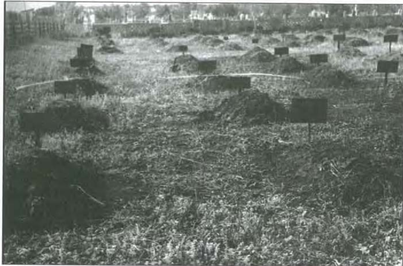
Кладовище військовополонених спецпिताлю №6027, м. Горлівка Донецької обл. Світлина 1970 р.