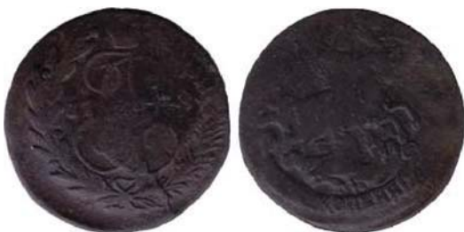
Рис. 9. Две копійки, 17(?)8 р., мідь. Російська імперія, Катерина II (1762–1796), зображення збільшено.