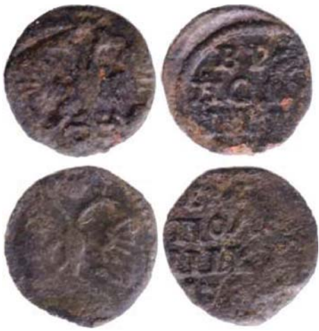
Рис. 3. Полушки, 1718–1722 рр. (?), мідь. Московська держава, Петро I Олексійович (1696-1725), зображення збільшено.