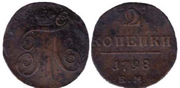
Рис. 10. 2 копійки, 1798 р., мідь. Російська імперія, Павло I (1796–1801), зображення збільшено.