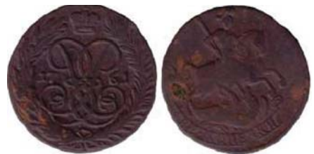
Рис. 8. Две копійки, 1761 р., мідь. Російська імперія, Єлизавета Петрівна (1741–1761), зображення збільшено.