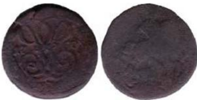
Рис. 7. Денга, 1760 р., мідь. Російська імперія, Єлизавета Петрівна (1741–1761), зображення збільшено.