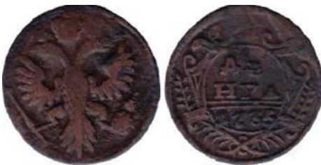
Рис. 5. Денга, 1735 р., мідь. Російська імперія, Анна Іоанівна (1730–1740), зображення збільшено.