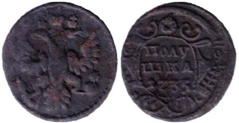
Рис. 4. Полушка, 1735 р., мідь. Російська імперія, Анна Іоанівна (1730–1740), перекарбування з “хрестової” копійки 1729 р. (зображення збільшено).