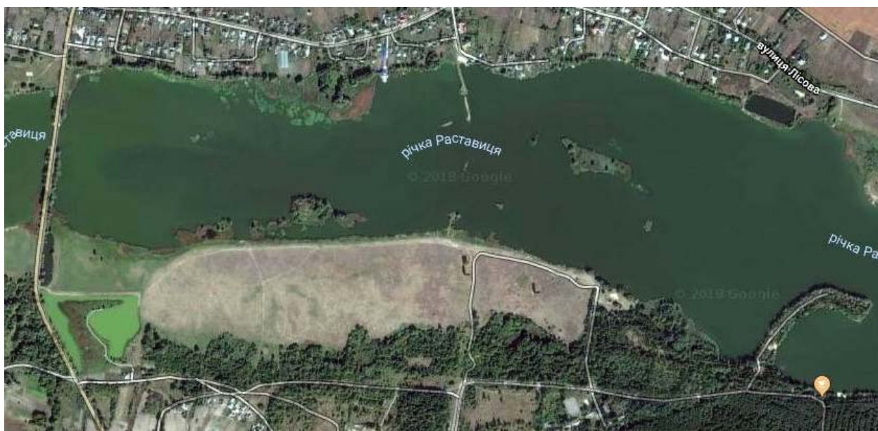
Рис. 1. Локалізація місця нумізматичного польового дослідження (показане стрілками), с. Трушки Білоцерківського району Київської області. Фрагмент супутникової мапи Googl, 2018 р.