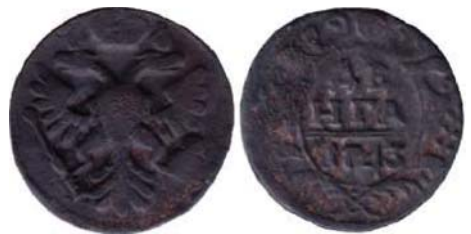
Рис. 6. Денга, 1743 р., мідь. Російська імперія, Єлизавета Петрівна (1741–1761), зображення збільшено.