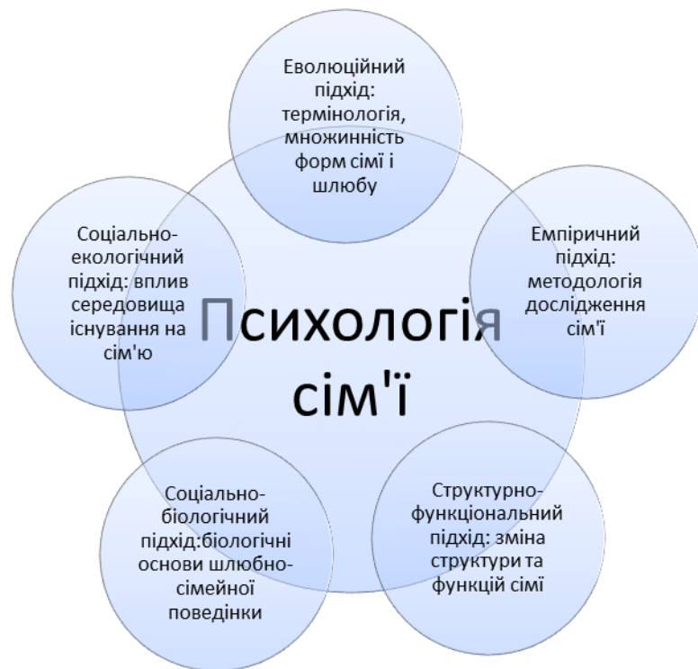
Рис. 3. Психологія сім'ї в контексті міждисциплінарного знання

Вивчення сутнісної характеристики теоретико-методологічних основ психології сім'ї дозволяє дійти висновку, що в її основі лежить систематизована сукупність підходів, способів, методів, прийомів дослідження та теоретичні конструкції сформульовані не лише в межах галузей психології, практики сімейної психотерапії та сімейного консультування, а й інших наук.