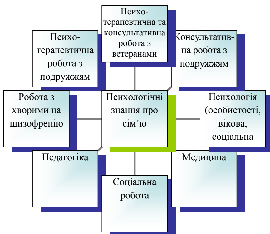
Рис. 2. Основні напрями, в межах яких досліджуються аспекти психологічної сфери сім'ї у другій половині ХХ ст.

особистості тощо. Однак найбільш суттєвий поштовх до становлення психології сім'ї як галузі наукового дали знання, отримані в процесі роботи з ветеранами та хворими на шизофренію, які сприяли формуванню уявлення про сім'ю як систему. Ці уявлення, в свою чергу, вивели на новий, більш якісний рівень надання практичної допомоги учасникам сімейної взаємодії, що стимулювало становлення психології сім'ї спочатку як сфери практики та відкрило перспективи становлення психології сім'ї як фундаментальної науки.