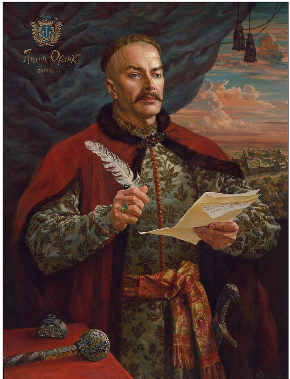
Портрет гетьмана Пилипа Орлика. Худ. Наталя Павлусенко. 2021 р. З фондової колекції Національного заповідника «Гетьманська столиця».

Нині історики заповідника співпрацюють з професором кафедри українистики Варшавського університету,