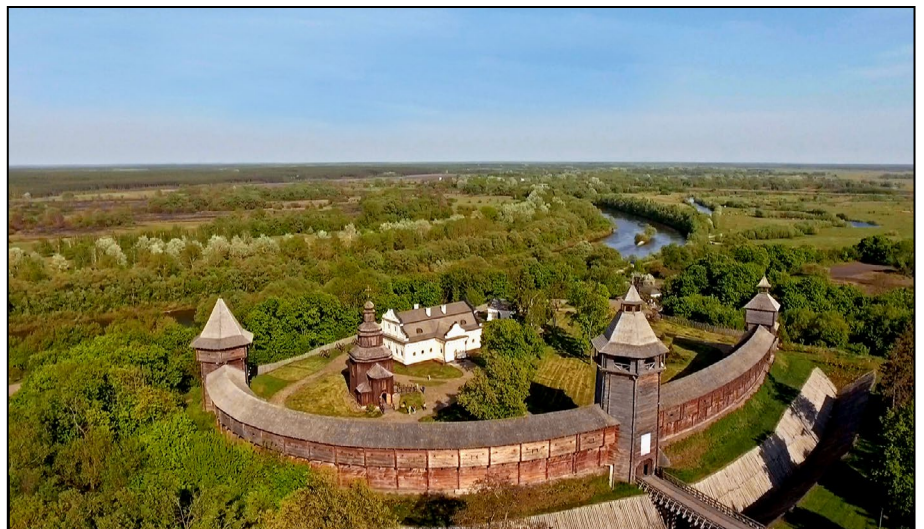
Територія Цитаделі Батуринської фортеці. Фото 2019 р.

Перебуваючи в еміграції Пилип Орлик, як і багато сучасних українців, які опинилися за кордоном і об'єдналися проти російської агресії, продовжував боротьбу за визволення України з під московського гніту. Він збирав людські й матеріальні сили, переосмислював причини поразки. Він доклав безліч зусиль для створення сильної європейської коаліції, без