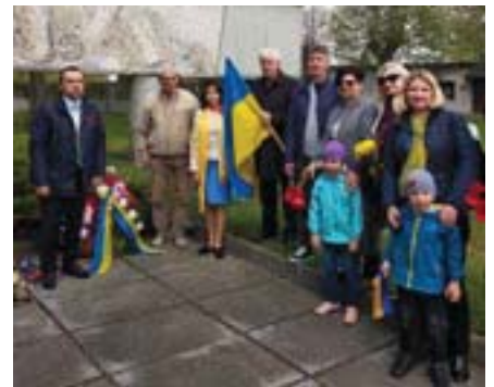
Українська громада вшанує полеглих у боях за визволення Моравії та Східної Чехії.