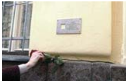
Меморіальна таблиця Петрові Зленку.

хословащині. Особистий архів Петра Зленка знаходиться на збереженні в Слов'янській бібліотеці. Десятки українців, як і Петро Зленко, були заарештовані й насильно вивезені до Радянського Союзу, навіть незважаючи на їхнє чехословацьке громадянство. Деяким з них вдалося повернутися до Праги після відбування багаторічних термінів, проте більшість були страчені, закатовані або ж померли в таборах. Проект «Остання адреса» — це громадська ініціатива, що має за мету увічнення пам'яті про жертв політичних репресій радянської влади. У пам'ять про особу на фасаді будинку, де вона мешкала, встановлюється невеличка, розміром з долоню, меморіальна табличка. Кожен меморіальний знак присвячується окремій людині. Принцип проекту — «Одне ім'я, одне життя, один знак». Під час заходу Євген Перебийніс закликав чеський осередок «Останньої адреси» продовжити роботу з вшанування пам'яті жертв комуністичного терору в Чехословащині і висловив готовність посольства підключитися до цієї роботи.