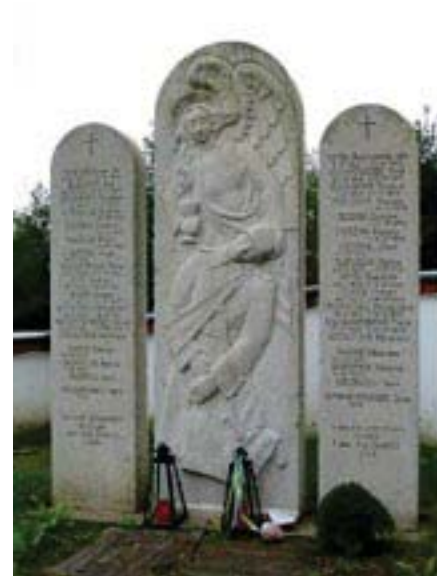
Пам'ятник загиблим воїнам УНА у Фелдбаху.

Створення УНА під парасолькою організації «Український національний комітет» відбулося лише за кілька тижнів до повної поразки та капітуляції Німеччини. УНА мала зібрати всіх українських солдатів, які до тих пір воювали у різних підрозділах на німецькій стороні, але її ядром стала