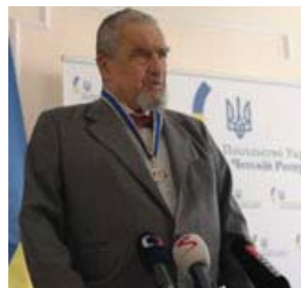
Карел Шварценберг під час виступу після вручення ордену Ярослава Мудрого.