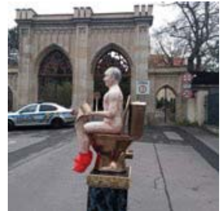
Сатирична скульптура Путіна на унітазі не лише привітала російських агентодипломатів, а й зустріла кремлівських «Нічних вовків».