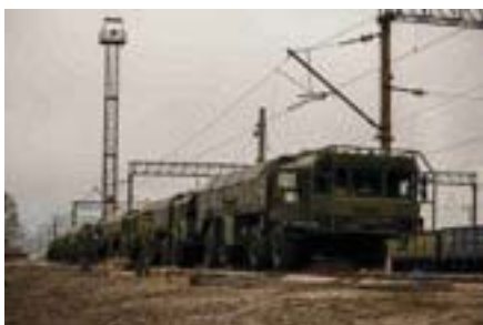
Росіяни розвантажують «Іскандери» поблизу кордонів України, квітень 2021.

У квітні цього року над Чехією та Центральною Європою прогналася дипломатична гроза. Протягом останнього місяця сталася найбільша криза у відносинах між Чехією та Росією від «хокейної війни» у квітні 1969 року. Чехи знову відчували напад на свою країну, знову виникла хвиля відрази, якщо не щодо самих росіян, то щодо орієнталізму, ворожого стилю правління у тій величезній країні на сході, її підходам до інших країн.