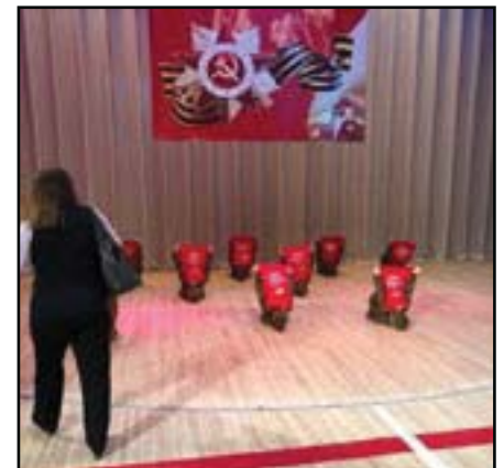
Російське «победобесіє» в дії: діти зображають на виставі могили загиблих солдат.

Автор є психологом, дипломатом, директором бібліотеки ім. В. Гавела