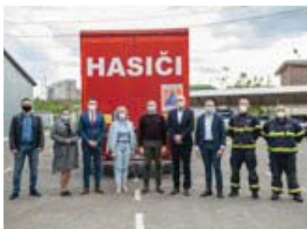
Під час передачі чеської гуманітарної допомоги в Києві.