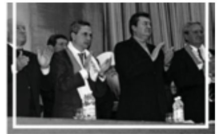
Протиставити Донбас Україні. Як після виборів 2004 року сепаратизм знову став аргументом донецьких політичних кланів