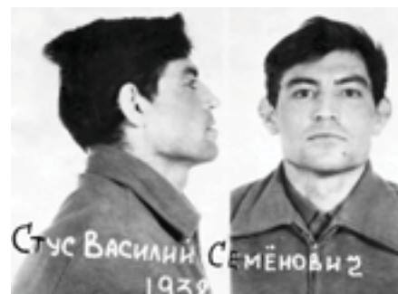
В'язничне фото Василя Стуса, 1972 рік.

У 72-му він ще вчився у школі і ще не вступив на юридичний факультет Київського університету. Отже, міг хіба чути про арешти якихось «антирадянщиків». Віршів і літературно-критичних розвідок Василя Стуса майбутній