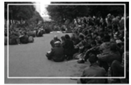
Голодні бунти та шахтарські страйки. Як масштабне розкрадання вугільної галузі породило на Донбасі антиукраїнські настрої

Жахи війни українці тривалий час спостерігали тільки на телеекранах. Під боком палахкотіло Придністров'я. У вечірніх новинах показували репортажі про облогу Сараєва та бої на вулицях Сухумі. Але найсильніше враження на українського обивателя справляли сюжети з Чечні. У перші роки незалежності в Україні вільно транслювалося російське телебачення, тому чеченську м'ясорубку мільйони українців мали можливість спостерігати в усіх кривавих подробицях і сприймали як власну війну. У 1990-ті на тлі проблем колишніх товаришів по соцтабору Україна виглядала острівцем спокою та стабільності. Цю обставину українська влада вважала однією зі своїх головних заслуг. Під час президентської кампанії 1999 року у рекламному ролику президента Леоніда Кучми, який обирався на другий термін, лунав слоган: «Наші солдати повертаються додому. Кадри демонстрували щасливого військового, який приїхав до сім'ї після служби в армії. Для людей, які знали про масштаби трагедії у Чечні, така картинка виглядала переконливою. Кучма тоді з великим відривом виграв вибори у більш проросійського опозиційного кандидата Петра Симоненка.