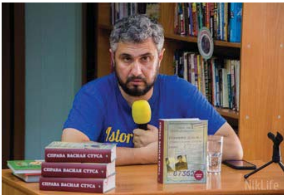
Автор книги Вахтанг Кіпіані презентує книгу про Василя Стуса у Миколаєві.

Левка Лук'яненка, Анни-Галі Горбач з Німеччини, члена «Міжнародної амністії» Крістіні Бремер (у матеріалах слідства вона фігурує як «націоналістка з ФРН» — хоча, насправді, була членом Соціалістичної партії Німеччини), заяву в обороні Миколи Горбала та ще багато чого.