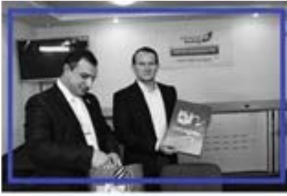
Нові фігури на дошці. Коли і для чого Віктор Медведчук став головним представником "руського мира" в Україні