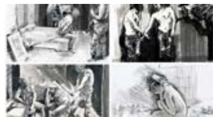
Малюнки художника Сергія Захарова із концтабору «Ізоляція».