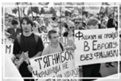
Потрапили в капкан. Як рішення про рух України до ЄС розкололо Партію регіонів та вдарило по її електоральних позиціях і хто зміг цим скористатися