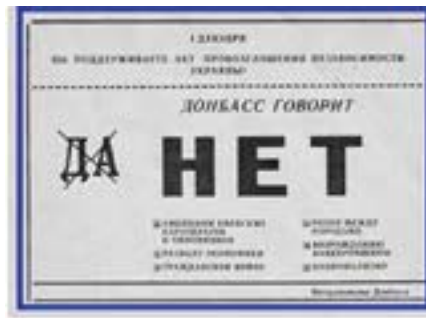
Маргінали за викликом. Хто і для чого заснував та фінансував проросійські політичні та громадські організації на Донбасі у 90-х

У перші двадцять років незалежності регіональні відмінності не спричиняли збройні сутички. У 1990-х роках історичні, ідеологічні та мовні протиріччя в Україні не були першорядною проблемою. У той час і жителів Донецька, і жителів Львова хвилювала насамперед економічна ситуація