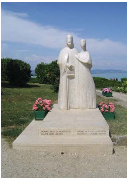
Пам'ятник Андрію (Андрашу) I, угорському королю і його дружині Анастасії, доньці Ярослава Мудрого, в містечку Тігонь на Балатоні, Угорщина.

Після урочистих промов слідував акт посвячення пам'ятника, який виконали митрополит Української православної церкви Київського патріархату зі Львова владика Андрій та єпископ угорської