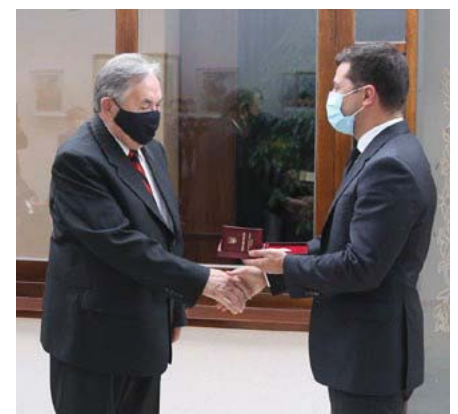
Президент України В. Зеленський вручає у Братиславі Л. Довговичу Почесне звання «Заслужений діяч мистецтва України».