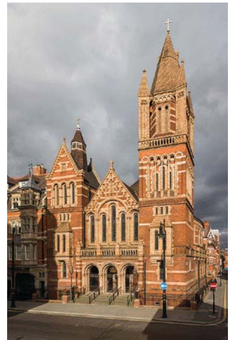
Катедральний храм епархії Пресвятої Родини для українців – католиків східного обряду, собор Втечі до Єгипту у Лондоні (Великобританія).

На зустрічі світового українства в Білому Борі, у 1990 році, виникає потреба включити і українські громадські організації східної діаспори у структури Світового українства. Була висунута думка створити дальшу світову громадську надбудову в Україні, яка би мала об'єднувати і координувати