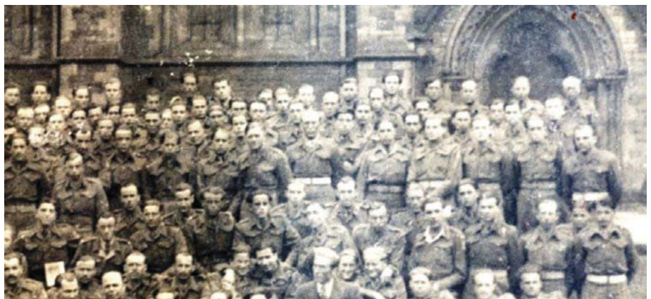
Учасники Основуючих Зборів Союзу Українців у Великій Британії.

Зрозумівши ганебну пропаганду радянських агітаторів, наші біженці почали категорично відмовлятися від «добровільного» повернення в Україну. Московський уряд вимагав, щоб західноєвропейські держави насильно