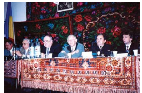
5-6.9.1998 р. III З'їзд Союзу Українців Румунії.