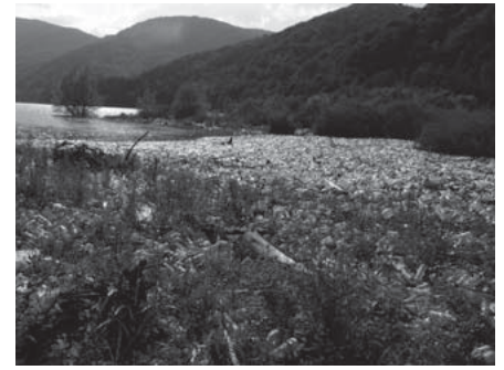
Сміттєва лагуна на Терембі, 2010 рік.

оскільки ті «приймають» сміття, яке пливе річками Уж та Латориця. «Зате коли ми ініціюємо будівництво сучасних сміттєпереробних заводів, які здатні переробити відходи й генерувати електроенергію чи тепло, люди провалюють ініціативу на громадських слуханнях, виходять на акції протесту і готові блокувати дороги!», – додавав він.