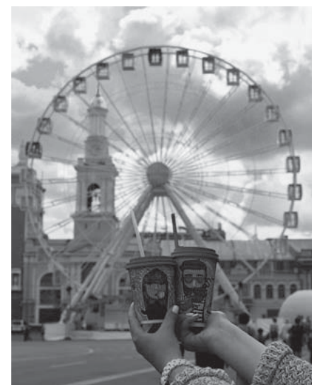
«Чортове колесо» на звільненій від машин Контрактовій площі, кава, ярмарки, де «всі свої» підтримують українського виробника, воїнів на фронті і йдемо до Європи — така атмосфера відчувалася у Києві в перші роки після Майдану

Тим не менш, нікуди не зникають традиційні народні «базари», куди приїжджають як землероби або перекупники із херсонськими овочами й фруктами, так і електричною простої бабусі із села з простою городиною. Є стаціонарні великі ринки, як Лук'янівський чи Житній, так і менші не щоденні, які