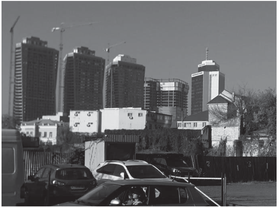
Манхеттен — комплекс хмарочосів виріс на проспекті Перемоги за часів мера Кличка. І такі „свічки“ ростуть по Києву, наче гриби після дощу.

До речі, про громадський транспорт Києва. Три лінії метро на майже 4-мільйонне місто – вкрай мало. Підземка часто буває переповненою,