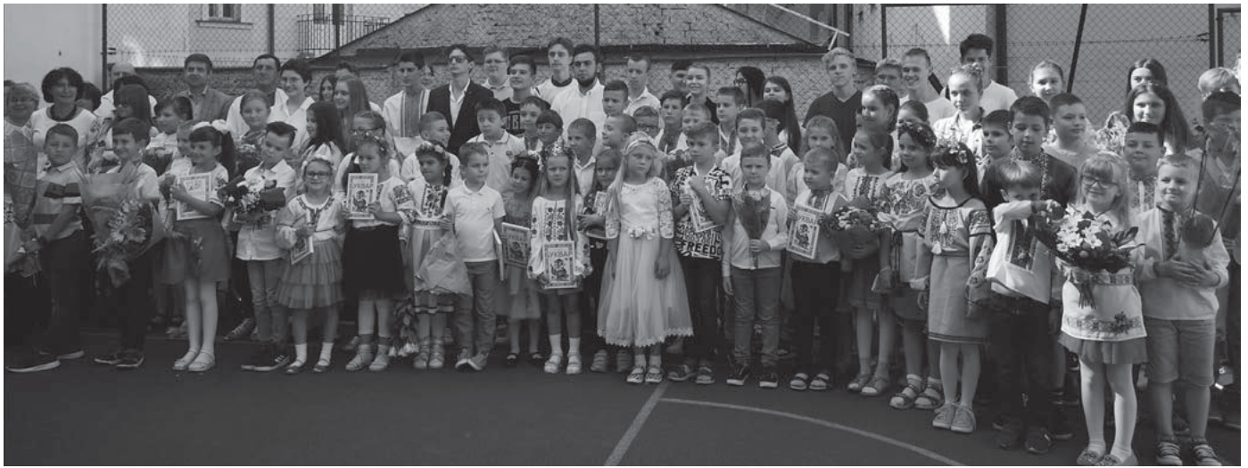
Школярі пражського «Ерудиту».

Перший дзвоник пролунав 12 вересня в суботній українській школі «Ерудит» у Празі. Уперше – для першокласників, востаннє – для випускників. Школярів, учителів та батьків дітей привітав посол України в Чехії Євген Перебийніс. Він подякував батькам за рішення віддати дітей до української школи, яка включена у систему Міжнародної української школи й видає атестати державного зразка України, та побажав дітям та вчителям успіхів у навчанні та нових вражень. На святковій лінійці лунали урочисті пісні, привітання та теплі слова. Це було справжнє свято для всіх, хто