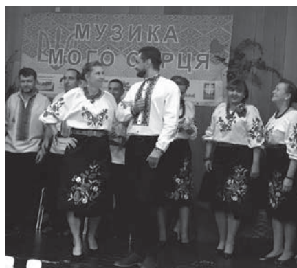
Виступ колективу «Радість» у Градці Краловому.