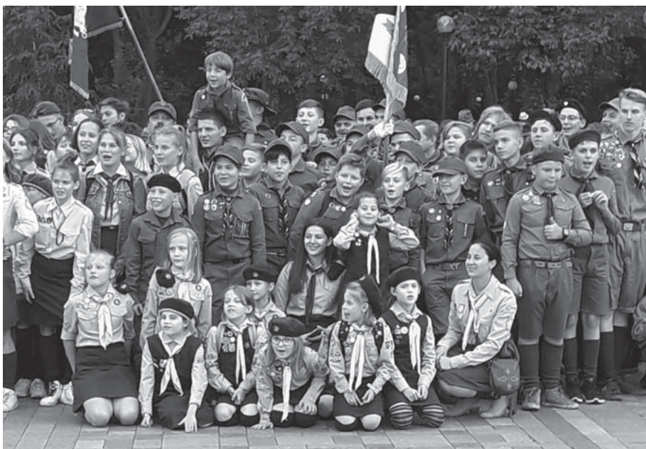
Пластуни та їхні батьки — це ті кияни, які послідовно утримують українську мову й традиції. Кількість таких з року в рік росте.

Просунулася «диджиталізація» київської системи громадського транспорту. Всі маршрути, машини у русі через gps-дані і навіть графіки можна з'ясувати через мобільну аплікацію EasyWay, яка, крім Києва, працює також у Львові, Коростені та Кракові. З'явилися електронні табло на основних зупинках, самі зупинки також поступово модернізують – як, наприклад, на Лівобережній напередодні проведення Євробачення у 2017 році. В салонах та вагонах теж подекуди є екрани, які показують поточні зупинки, час та іншу інформацію. Жетони, квитки і кондуктори поступово відходять в історію. Торік запровадили електронні квитки, валідатори, ще раніше з'явилася можливість оплати проїзду прямо на турнікеті метро чи швидкісного трамваю банківською картою – у тому числі й зарубіжних банків.