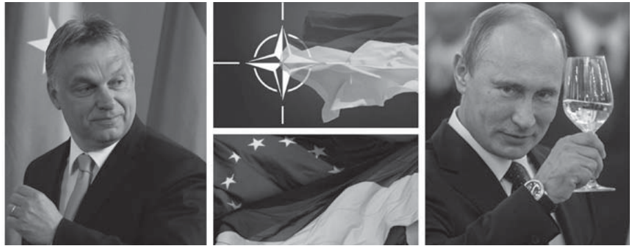
Віктор Орбан та Владімір Путін мають багато спільного – як у поглядах на демократію, так і на відносини з Україною...

В Угорщині російські медіа не мають впливу на інформаційний простір, але при владі перебувають сили, які часто критикують ЄС та загалом Захід, і тези їхньої критики збігаються з позицією Росії. Напевно, це єдина країна Європи, де меседжі Кремля настільки розповсюджені в центральних медіа. За допомогою ЗМІ влада Угорщини насаджує тезу «спільної травми, болю і страждань», викликаних Тріанонським мирним договором. Формується образ Тріанону виключно як головної