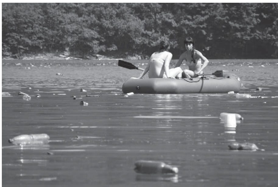
Дівчата відпочивають на Вільшанському водосховищі Тербле-Ріцької ГЕС, Хустський район Закарпатської обл, 2017 рік, фото з порталу joureactor.

Федір Гамор, заступник директора Карпатського біосферного заповідника, пояснює причини катастроф: «Гори є однією з найбільш екологічно вразливих територій. Природні катаклізми активізуються під впливом глобальних кліматичних змін, але недооцінюється й роль локальних антропогенних чинників. У Карпатському регіоні порушено екологічну рівновагу, розвиваються масштабні ерозійні процеси. Лісистість Українських Карпат зменшилася майже на половину, знизилася верхня межа лісу на 200-300 метрів через суцільні рубки та екологічно шкідливі технології в лісозаготівлях, аграрній та туристич-