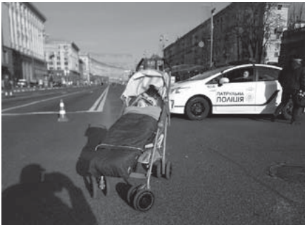
Хрещатик у вихідні без автомобілів — така традиція панує у Києві ще з 1990-х років. Місто відпочиває від вихлопних газів, проспектом прогулюються пішоходи, митці малюють, виконавці співають і т. д.

розкладаються у мікрорайончиках, наприклад на Львівській площі чи на розі Гончара й Хмельницького. Атмосферою, хоч і не цінами, вони чимось нагадують празькі «Фермермерські ринки».