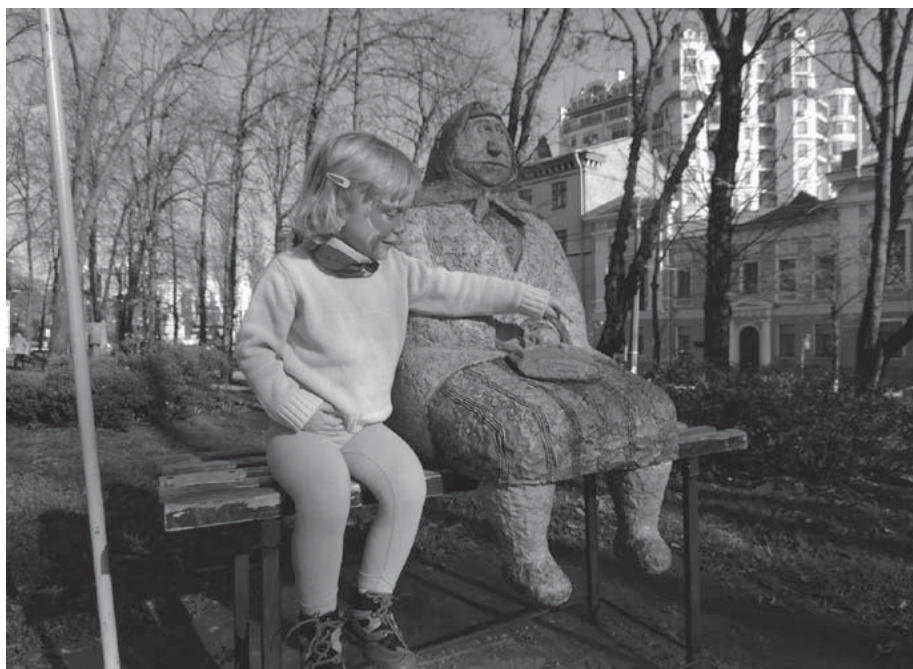
„Бабця класична“ – улюблена для дітей скульптура у парку імені Шевченка, авторка Анна Кисельова, фото 2012 року. Позаду видно багатоповерхову новобудову в самому центрі Києва.

то про «історическі сложівшіся в Го-раде абстаетельства», то про закон Ківалова-Колесніченка, і навіть про «панаєхавших-тут» «западенцев» і «се-лян». Та й, зрештою, українську у Празі почуєш частіш, ніж у Києві... Київ нас, свіжих (певною мірою) (ре) емігрантів з Праги, зустрів зливовими дощами та аж до нудоти «стабільним» януковичівсько-азаровським рухом в нікуди. Таксист – звісно ж, неліцензований – тут міг годинами тупо сидіти у іржавих смердючих «Жигулях» і чекати на якогось наївного пасажира, якому заламував ціну 150 грн (або 400 крон на той час) за два кілометри поїздки. У лісі та парках – розкидане сміття, сортування практично не про-водилося. Увечері на вулицях та під-