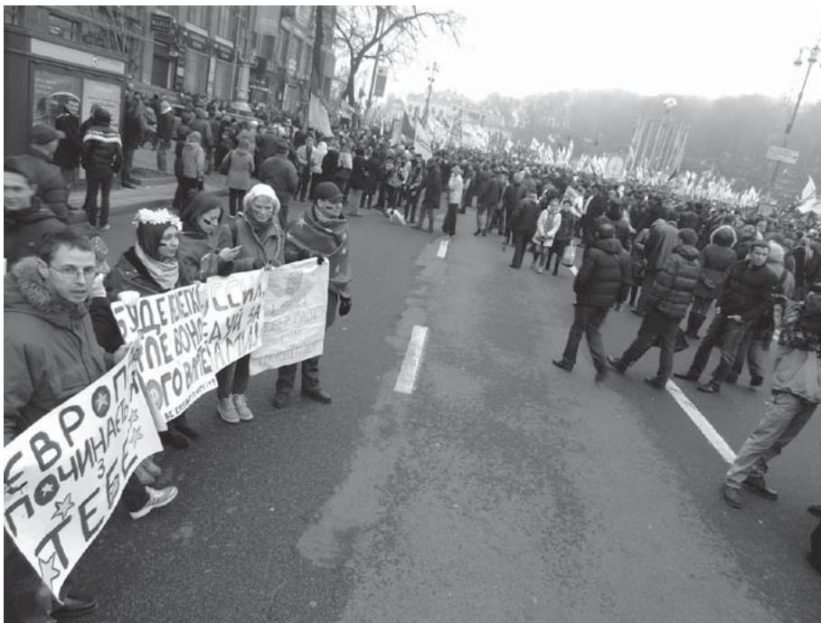
Перші дні Євромайдану — перед Вільнюським самітом. Студенти закликають залишатися на Хрещатику. Тоді проводилися дві акції — з політказниками (також за свободу Юлії Тимошенко) і без них.