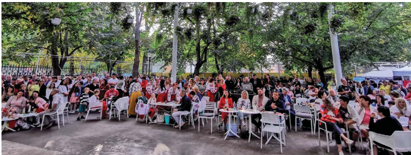
Гості та учасники свята Незалежності в Стромовці.