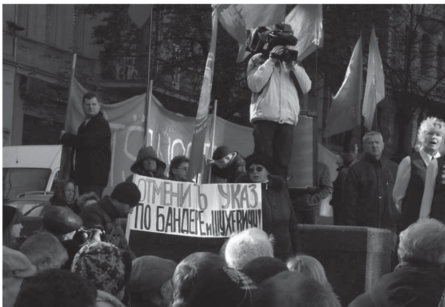
Архівне фото 2013 року. Остання демонстрація комуністів перед пам'ятником Леніну в Києві. Вони довго оберігали свого вождя, доки він не впав під час Євромайдану у грудні 2013 року. КПУ згодом була заборонена.

Десь тоді, мабуть, в Києві вже зароджувався волонтерський рух і починало «пахнути Майданом». Але і тут не обходилося без «бариг, які наживаються» – тих же таксистів, які вдєсятеро піднімали ціни, або двірників, які знахабніли і здавали в оренду навіть... лопати.