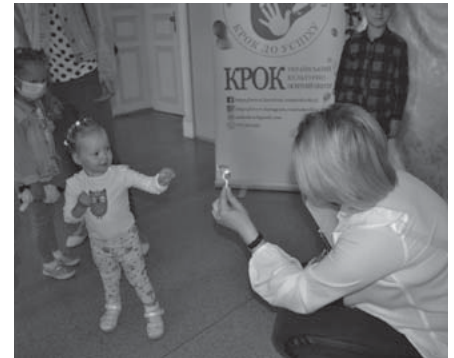
Початок занять у «Кроці».