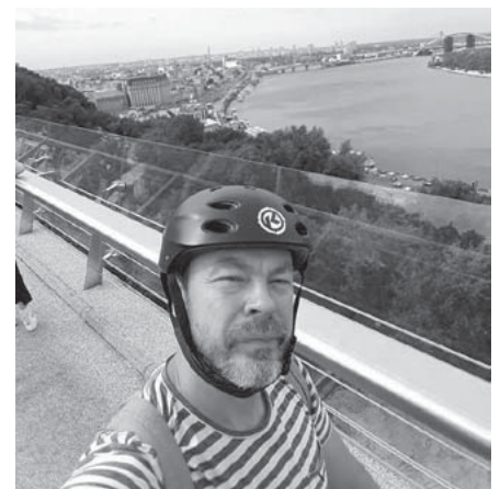
Автор під час велопогулянки новим «мостом Кличка» через Володимирський узвіз, 2019 рік.

Автор є редактором часопису «Пороги», у 2005-2012 рр. мешкав у Празі, у 2012-2020 рр. – у Києві