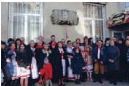
Відкриття меморіальної таблиці на будівлі колишньої чеської школи в Луцьку, 2 березня 2019 року. Одна з ілюстрацій того, що в Україні вшановуються досягнення національних меншин і визначних постатей інших народів.