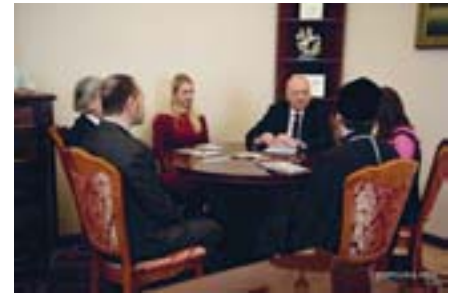
Чеська делегація веде переговори із предстоятелем ПЦУ Епіфанієм.

ззначив: «Хотів би запевнити у неперервній та усесторонній підтримці України з боку Чеської Республіки. Постаць святої Людмили важлива для усього християнського світу, тому ми хотіли б знайти можливість згадати її ім'я і в Україні. Вірю, що цей проект міг би зблизити наші країни». Митрополит Епіфаній зазначив, що здобуття Помісною Українською Церквою автокефалії є непересічною подією в історії України. «Ваша підтримка важлива для нас. П'ять років тому ми обрали європейський вектор розвитку, вірю, що будемо рухатись ним і на далі. Єдність у різноманітті є девізом Європейського Союзу, це означає, що ми можемо прагнути спільності, при цьому зберігаючи свою ідентичність. А свята Людмила є шанованою і в Православній Церкві, тому ми готові долучитися до проектів, які Ви пропонуєте. Хочу також сказати, що Помісна Українська Православна Церква від-