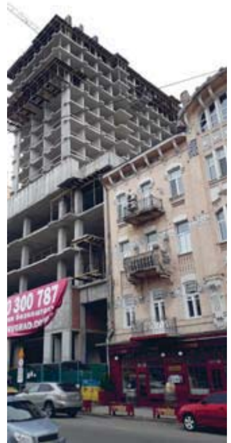
Київ та великі міста України зараз сильно розбудовуються і потребують робочих рук. «Величезне безробіття» в Україні – це міф.

Невідомо, про якого саме ветерана і де йдеться, але в Україні вшановується чимало чеських вояків та відомих осіб. Наприклад, у вересні 2014 року, в самому центрі Києва, на стіні історичної пам'ятки – Софійського собору, відкрили таблицю на честь чеської дружини, яка прийняла тут присягу у 1914 році. Це єдина така таблиця у цьому святому для українців місці, хоча тут відбулися десятки різних історичних подій. Дружина, а згодом і чеські легіони, служили, як відомо, у складі російського імператорського війська. А російське, вже путінське, військо на час відкриття таблиці вже захопило Крим і безцеремонно бомбардувало з «градів» захисників України й населені пункти на Донбасі. Та толерантні українці не мали нічого проти вшанування чеських патріотів у Києві. Через певний час у Києві з'явилася й таблиця та вулиця на честь Вацлава Гавела. Вулиця письменника Ярослава Гашека є у Києві та у Львові, а у Мукачеві така з'явилася нещодавно. У Хусті у березні минулого року відкрили меморіальну дошку президентові Масарику, таку ж планують і у Мукачеві. Цього року відкрили меморіальну дошку і на будівлі колишньої чеської школи у Луцьку. Щороку 14 жовтня у селі Світланок на Чернігівщині вшановується півсотні воїнів армії Лудвіка Свободи, які полягли тут під час Другої Світової війни, діє й музей українсько-чесько-словацької дружби. Відоме вшанування полеглих відбувається кожні 5 років у березні і на Харківщині, де біля села