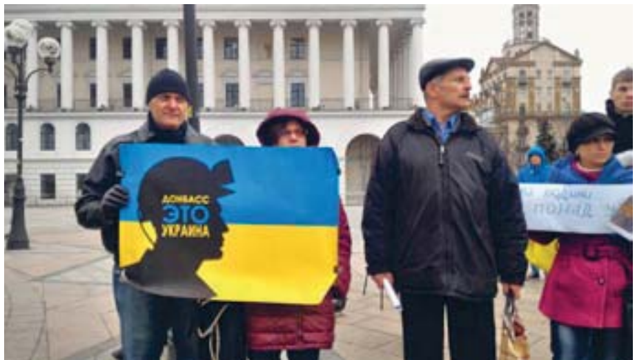
Чимало «людей на Сході» знають, що Донеччина, Луганщина і Крим – це Україна, і чимало з них брали участь в АТО та беруть в ООС, відстоюючи законність і територіальну цілісність країни.