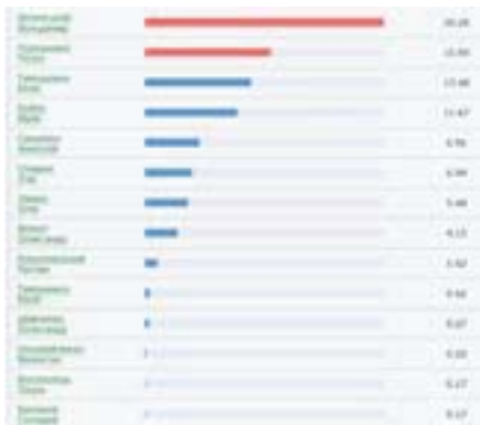
Результати голосування у першому турі в Україні

Для багатьох результати першого туру виборів стали несподіванкою. Кожен кандидат проштовхував свої результати соціологічних опитувань, намагаючись зорієнтувати виборця на свою користь. Традиційно їздили містами, чи то у якості рекламної кампанії, чи то у своїх справах, роздавали агітаційні листівки та ставили намети. Однак головне поле боротьби за виборця розгорнулось в соціальних мережах, які стали повноцінною платформою для агітації. Стихийна реклама на різноманітних ресурсах, публікації у твіттері та пости у фесбучі змістили телебачення на задній план. Оскільки кожен може висловити свою думку і одразу ж почути зворотній зв'язок, потреба у ефірах на телебаченні та мітингах відпадає. Кожен кандидат, розуміючи це, вливав кошти у інтернет простір. Відтак у останні тижні до виборів соціальні мережі були схожі на справжнє поле битви правих і лівих, ботів і політологів, диванних експертів та проплачених коментаторів. Стихийно розлітались фейкові новини, які розповсюджували, на диво, впливові інтернет-видання, що привело до інформаційного політичного перенасичення. Порівняно з минулими виборами явка була більшою – 63,52% всіх виборців