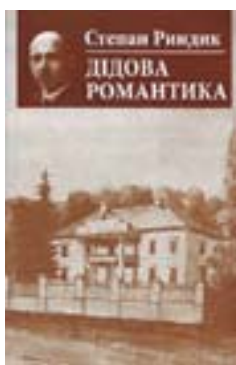
Обкладинка виданої 2011 року в Городку Хмельницької області прозової збірки Степана Риндика. Деякі оповідання зі збірки звучали й на Українському радіо, як-от гумористичне «Бровко» у записі заслуженого артиста України Б. Лободи.

задоволені своїм добробутом, казали, що їм вистачає пенсії на все, що вони їдять все, що потрібно. Обоє готували смачні овочеві страви, вареники і «кнедлики» по-чеському, любили варити й частувати гостей. Бувало, прийде хтось їх відвідати, принесе «бідним стареньким» щось попоїсти, вони те, сто разів відмовившись, якось приймуть, але гостя нагодують краще, ніж десь у багатих».