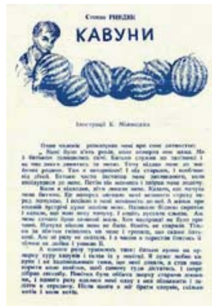
Оповідання «Кавуни» опубліковане у «Соняшнику», 1956 рік.