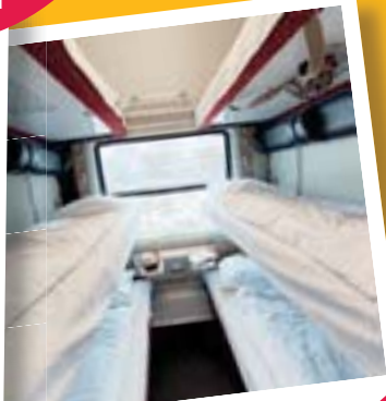
Купейні вагони Максимум 6 осіб