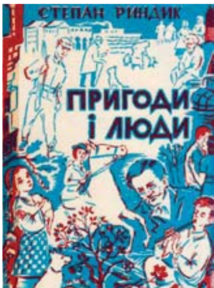
Збірка «Пригоди і люди» вийшла у США у 1960-тому році.

а наступного року віршована збірка для дітей «Пригоди Сірка Клаповухого», яку проілюстрував уродженець Кам'янця-Подільського Мирослав Григорій.