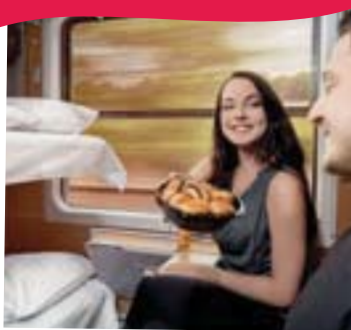
Спальні вагони Максимум 3 особи