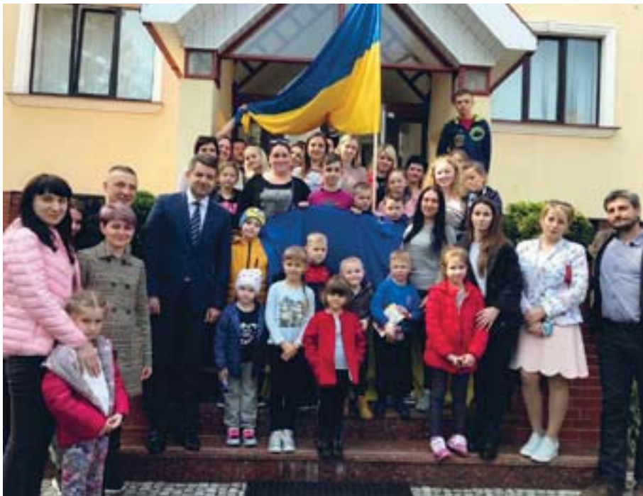
Українські діти, батьки яких загинули на війні за Україну, відвідали посольство та отримали допомогу від громади.

Українці в Чеській Республіці підтримали дітей, які втратили батька у зоні проведення антитерористичної операції/операції об'єднаних сил на сході України. Зустріч у зв'язку з цим відбулася 3 квітня у приміщенні посольства