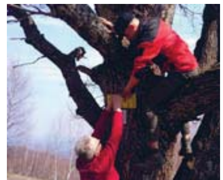
Чеські й українські рятувальники монтують точку порятунку у Карпатах.

схилах створені хороші умови для гірськолижного спуску, так і влітку. Загалом впродовж квітня-червня цього року рятувальниками буде встановлено 150 таких табличок на всіх туристичних маршрутах Закарпатської області. Їх виготовляють у Чехії. У подальшому всі точки порятунку будуть оприлюднені на інтерактивній карті. Спільний партнерський проект між обласним управлінням ДСНС України та Пардубицьким краєм розпочався в жовтні минулого року. Тоді Закарпатську область відвідав представник кризового управління канцелярії гетьмана Пардубицького краю Олдржіх Масін, який презентував закарпатським рятувальникам методику встановлення точок порятунку у Чеській Республіці. Точки порятунку встановлюються у гірських, відвідуваних туристами місцях – колибах, будинках вівчаря, дерева, каміння тощо. Ця справа є дуже актуальною особливо