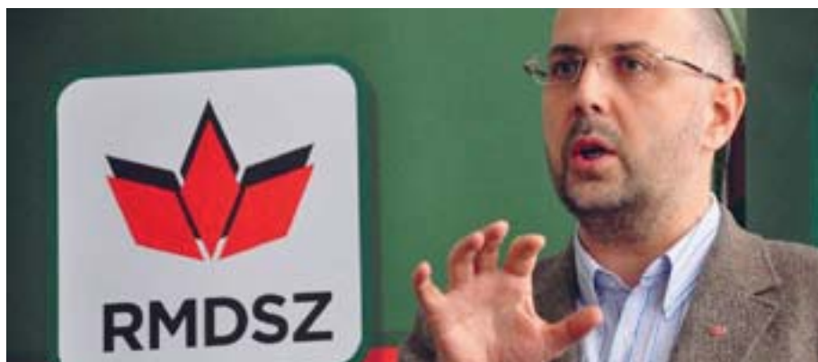
Письменник Гунор Келемен був кандидатом на посаду президента Румунії 2009 року.

МЗС Угорщини викликало посла України в Будапешті Любов Непоп через заборону в'їзду лідеру Демократичного союзу угорців Румунії (RMDSZ) Гунору Келемену. Прес-секретар МЗС Угорщини Томаш Менцер назвав крок української влади неприйнятним і антиугорським. Та українська сторона не розглядає цю справу як таку, що стосується українсько-угорських відносин, бо Келемен – громадянин Румунії, зазначили в посольстві України в Будапешті. Однак у самій Румунії відреагували спокійно. МЗС Румунії попросило в українській стороні пояснень з приводу інциденту, і наголосили, що право впускати чи не пускати іноземних громадян до країни є виключною компетенцією української влади, дипломатичні представництва, акредитовані в Україні, не грають жодної ролі у цій процедурі. «Такі рішення можуть бути оскаржені в українському суді виключно зацікавленою стороною», – заявили в МЗС Румунії. Посол України в Румунії Олександр Баньков повідомив, що Келемену заборонили в'їзд у листопаді 2017 року, і після того лідер угорців Румунії вже намагався в'їхати в Україну за угорським паспортом, але не зміг. Румунського політика не пустили до України через доручення правоохоронців. Баньков висловив здивування, чому