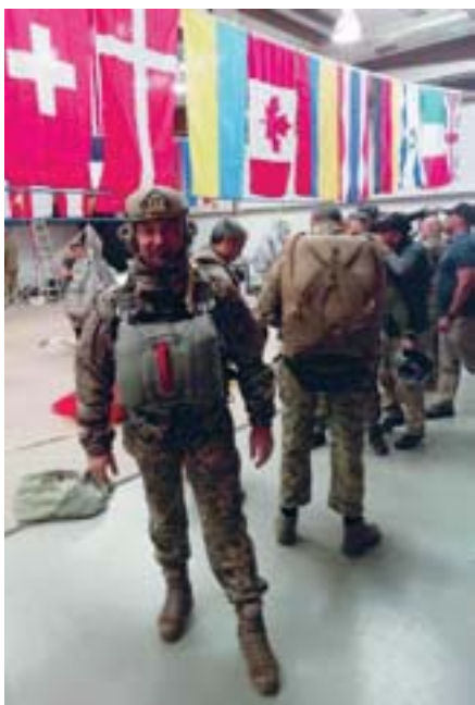
Спорядження солдатів української армії зараз набагато краще, ніж 4 роки тому.

Об'єднаних Сил військовослужбовці строкової служби – а це, як правило, призвані молоді люди 1992–2001 років народження – не направляються. Це прописано у військовій доктрині України. Виняток – мобілізація або особисте бажання призовника, але і в такому разі він зобов'язаний пройти учбовий курс. В зоні ООС на Донбасі наразі служать тільки контрактники з навичками та досвідом.