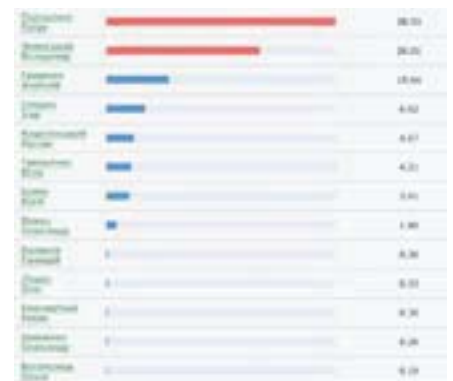
Результати голосування у першому турі за кордоном

Тож, поки кандидати активно знімають відео і здають аналізи, вибори стають схожими на телевізійне шоу, у якому потрібно відсилати смс-повідомлення «за свого». Та на даному етапі це зовсім не припустимо. В Україні все ще йде неоголошена війна і потрібен лідер, що зможе представляти її на міжнародній арені, а не гратись у шоу.