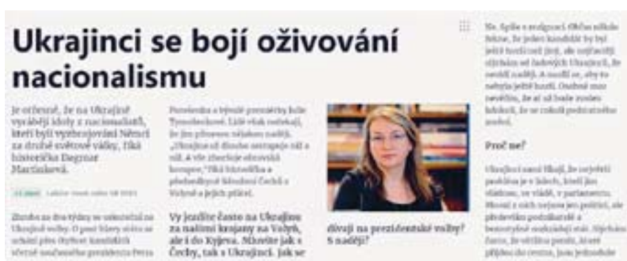
Відбиток в он-лайн першої частини інтерв'ю пані Мартінкової у «МФ Днес».

Як в Україні, так і в Чехії кожен має право на висловлення своєї думки, поглядів й інтерпретацій. Та при цьому має бути й елементарне дотримання фактів, серйозна аргументація й повага до поглядів інших людей, а також утримання від образ, зокрема за етнічною приналежністю. Загалом реакція на якісь публікації у інших виданнях в журналістському середовищі – річ не дуже прийнята, та інтерв'ю Ладіслава Генека із головою