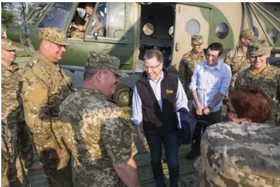
Курт Волкер серед українських бійців. Фото informal