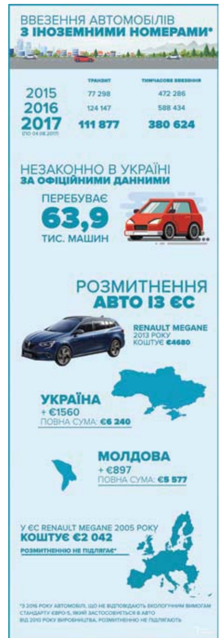
Інфографіка «Радіо «Свобода»»

45-річного віку прописана в інших нормативно-правових актах, тому така послуга і надалі надаватиметься підрозділами Державної міграційної служби та центрами надання адмінпослуг. Таким чином, як і раніше, після досягнення 25 – та 45-річного віку особа самостійно вирішуватиме, чи вклеїти фото до паспорта у формі книжечки, чи оформити ідентифікаційну картку. Також у Державній міграційній службі України планують у другому півріччі 2018 року запровадити послугу із заміни паспорта у формі книжечки на ID-картку за бажанням особи. Як зазначають у ДМС, на сьогодні така заміна можлива лише у разі зміни прізвища, псування або втрати паспорта, а також за бажанням при досягненні 25 – та 45-річного віку. «Поступове запровадження ID-картки без примушування громадян до заміни документів здійснюється відповідно до досвіду європейських країн та з метою уникнення ажіотажу та додаткових черг», – йдеться у повідомленні відомства. До паспорта громадянина України у формі картки вноситься така інформація: назва держави; назва громадянства; ім'я особи; стать; дата народження;