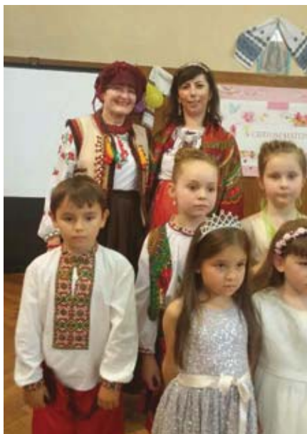
День Матері у «Джерелі»

Свято Матері 13 травня цього року традиційно відзначила українська громада. Цього дня о 15-тій годині у приміщенні монастиря На Слованах-Емаузі, що на вулиці Вишеградській, зібралися дітки та дорослі фольклорного колективу «Джерело». Вони співали, танцювали й декламували віршики своїм матерям. На свято прийшло чимало батьків, діти яких виступають у «Джерелі», а також їхні друзі та звичайні глядачі. Цього ж дня, як повідомляє священник Іван Семотюк, веснянки до Дня Матері відбулися у Ліберці. Їх організувала місцева греко-католицька Харита. Дітки у гарних вишиванках показували свої таланти у місцевому сонячному парку на церковному подвір'ї храму Вознесіння Христового.