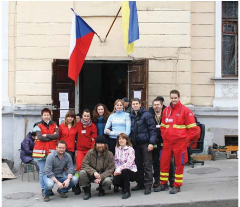
Чеська команда біля клініки на Трьохсвятительській у Києві: медики, перекладачки, координатори.

Це відбувалося кількома шляхами. Перш за все, ми шукали інформацію в інтернеті, щось нам повідомляли волонтери, які працювали в секретних лікарнях. І були офіційні лікарні, де була хороша ситуація, і ці поранені не боялися, що їх лікарі віддадуть міліції. У цих лікарнях були волонтери, які доглядали за пораненими, координатори. Але і з цих лікарень інформація надходила насамперед через Фейсбук. Ми написали в Фейсбуці про можливість відправки на лікування до Чехії, і нам почало надходити чимало запитів. І якусь інформацію ми використовували самі, щось передали Артему, а якісь контакти постраждалих навпаки – він передав нам. Одночасно з нашими пошуками і відправкою поранених до Чехії йшли літаки і до Польщі, ще 110 пацієнтів вирушили до Німеччини. Постраждалих потрібно було розподілити, вибрати найкращі для їхніх випадків варіанти. <...> Крім того, всі документи треба було підготувати. І була ще одна проблема: деякі українські лікарі дуже не хотіли віддавати пацієнтів. Вони говорили, що пацієнта не можна перевозити, що це небезпечно, що він помре в дорозі. Я думаю, іноді побоювалися, що хтось їх засудить, чи правильно вони лікували цих пацієнтів, і взагалі – чи лікували?.. Ця інформація прийшла до нас від родичів, тому що і вони до нас безпосередньо зверталися. Хотіли, щоб їхній родич поїхав за кордон лікуватися,