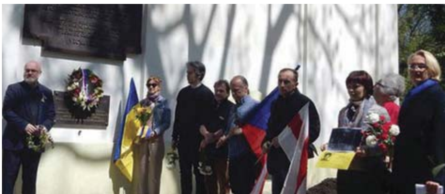
Фото з громадянської панахиди минулого року.

Антикомуністична чеська громадськість, разом із представниками української та частково російської громади 11 травня цього року згадали жертв СМЕРШу та НКВД, які у цей день 1945 року розпочали у Празі масовий терор. Радянські війська були у чехословацькій столиці лише кілька годин, але з їхнім приходом почалися арешти й вивезення «неугодних» до гулагів. Через 73 роки після цих трагічних подій жертв знову згадали на Олшанському цвинтарі. Щойно закінчилася війна, 8 травня капітулювала гітлерівська Німеччина. Припинив існування «Протекторат Богемії та Моравії». Люди раділи, що нарешті закінчився нацистський жах, не треба боятися гестапо та есесівців, сподівалися на мир та кращі часи. Та мрії про свободу тривали дуже недовго. Радянська контррозвідка вже знала всі прізвища, адреси й справи