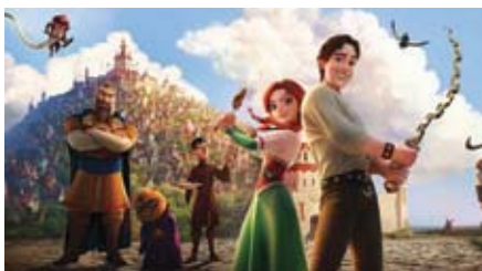
Кадр із фільму.

Новий український мультфільм «Викрадена принцеса: Руслан та Людмила» йде до прокату у чеські кінотеатри під назвою «Hledá se princezna». Від 17 травня його можна переглянути у чеському дубляжі. Це чи не вперше український мультфільм,