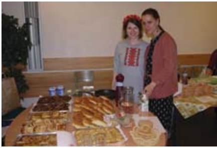
Минулорічна «Ніч музеїв» у ДНМ була дуже гарною та смачною.

Будинок національних меншин у Празі знову братиме участь у міській програмі «Ніч музеїв». В суботу 9 червня о 19-