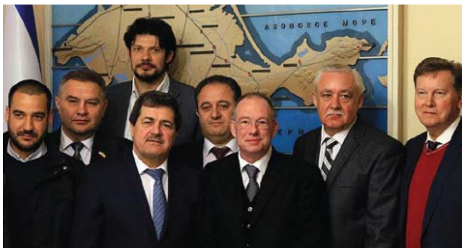
Депутат Голік та його сербські колеги, ультрарадикали Воїслава Шешеля в окупованому Криму: в Україні їм тепер загрожує покарання за порушення порядку в'їзду на півострів.

Депутат чеського парламенту Ярослав Голік разом із чотирма сербськими політиками «шешелівцями» відвідав окупований півострів Крим задля «святкування» третьої річниці анексії. У зв'язку з цим посольство України в Чеській Республіці виступило із різкою заявою. «В умовах, коли жодна цивілізована країна світу так і не визнала спробу анексії Росією українського Криму, російські окупанти не полишають спроб легітимізувати свій злочин хоча б очам аудиторії власних пропагандистських телеканалів, – сказано у заяві. – Для цього на «святкування» третьої річниці крадіжки Криму російська влада доставила на півострів купку іноземних політиків зі зниженим порогом політичної гігієни. Дуже сумно, що серед них опинився і Ярослав Голік, депутат парламенту Чехії, країни, яка на власному досвіді знає, що таке окупація і анексія. Рішуче засуджуємо несанкціоноване і здійснене за порушенням українського законодавства відвідання Я. Голіком Автономної Республіки Крим. Високо цінуємо послідовну позицію уряду Чеської Республіки щодо засудження і невизнання спроб Росії анексувати тимчасово окупований нею Крим. Тому закликаємо керівництво Палати депутатів Парламенту