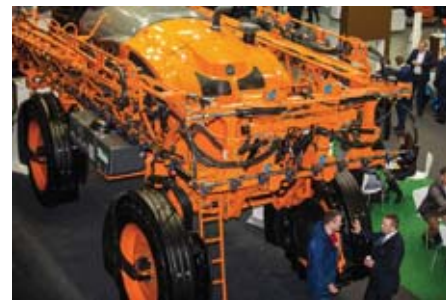
Міністри знайомляться з новітньою сільськогосподарською технікою, Київ, 15 лютого 2017.