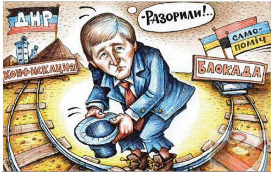
У результаті блокади різко збіднів олігарх і колишній «хазяїн Донбасу» Рінат Ахметов, який колись спонсорував проросійські партії, але «гудів» за Україну у Донецьку у 2014 році. Ватажки ДНР тепер відбирають його майно: стадіон і маєток, куди поселився головний бойовик Александр Захарченко.

15 березня Рада Національної Безпеки та Оборони України доручила силовикам до 13:00 цього дня припинити переміщення вантажів через лінію зіткнення залізничними і автомобільними шляхами та створити умови для залучення громадського контролю за виконанням цього рішення. «Констатуючи різку ескалацію російської агресії проти України, насильницьке захоплення українських підприємств, розташованих на території окремих районів Донецької та Луганської областей, усвідомлюючи загострення загроз економічній і енергетичній безпеці України, спровоковане свідомими діями терористів, та враховуючи те, що РФ почала на державному рівні визнавати «документи» самопроголошених республік, з метою захисту прав і свобод громадян України та забезпечення національної безпеки України РНБО вирішила: тимчасово, до реалізації пунктів