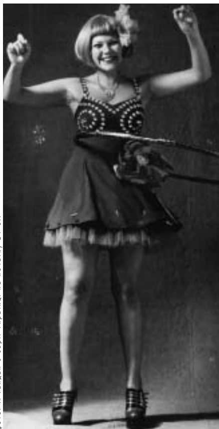
з серії Українці на початку 21 ст.

Але такий проект точно приніс би багато позитивного. Якісне поєднання модерної та класичної музики, театру і естради не залишило би байдужими глядачів різних смаків, не кажучи вже про те, що багато рок- і поп-інтерпретів мало би можливість поповнити свій, часто жалюгідний репертуар. Та навіть жовта преса мала би про що писати, бо під час постановки, напевно, би не обійшлося без порядних закулісних скандалів між вітчизняними попзірками. І тоді може нарешті плітки домашнього виробництва витіснили б „гарячі новини“ про молодих коханців Алі Пугачової з культурних рубрик українського бульвару.