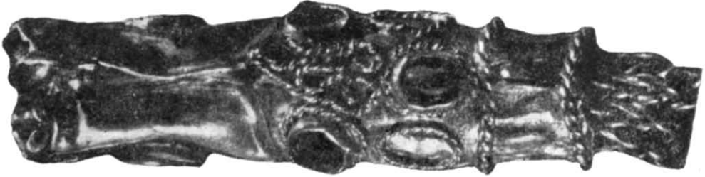
Рис. 3. Наконечник. Деталь шийного ланцюга.

Всі вище перелічені вироби, срібні й позолочені, складаються з порожнистої, прикрашеної зерню і сканню верхівки та прикріплених до