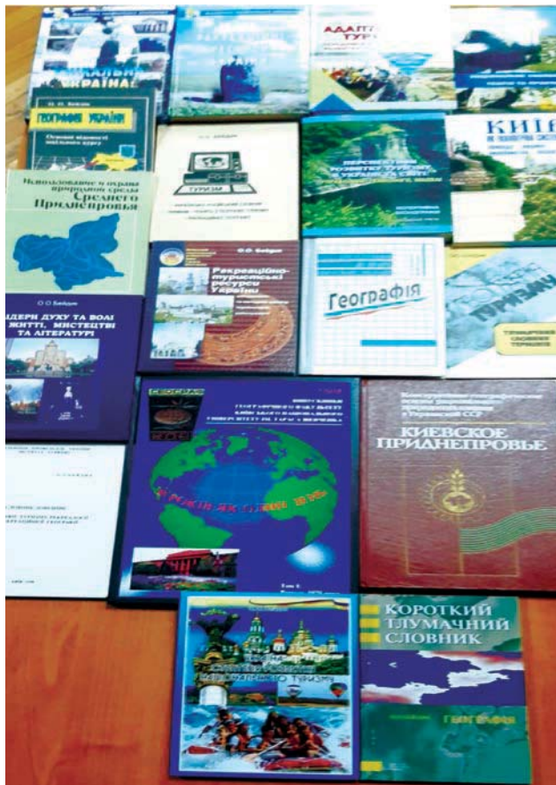
Науковий доробок професора О. О. Бейдика.

У 2005 р. він захистив докторську дисертацію на тему «Методологія та методика аналізу рекреаційно-туристських ресурсів України», метою якої є розвиток методології рекреаційної географії та географії туризму, що полягає в систематизації уявлень про просторові рекреаційно-туристичні ресурси, розширенні та поглибленні поняттєво-термінологічного апарату рекреаційної географії, розробці методики аналізу рекреаційно-туристичних ресурсів території України з виходом на її ресурсно-рекреаційне