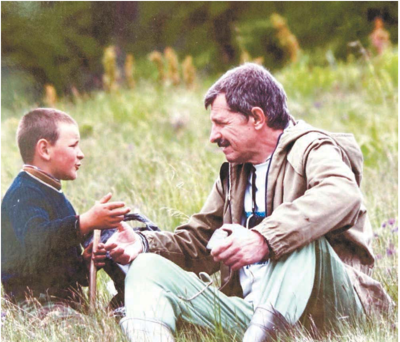
Спілкування з юним краєзнавцем на туристичних стежках Карпат