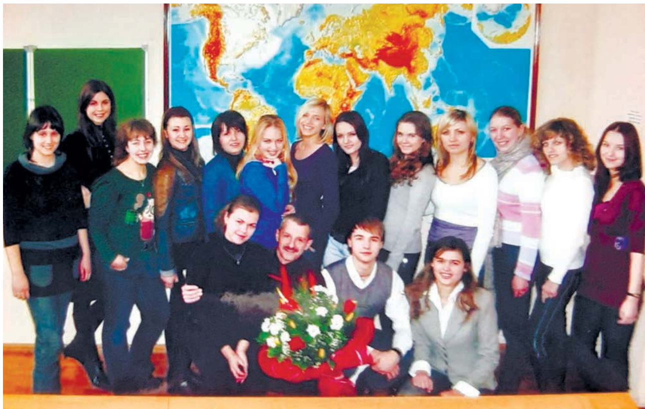
Професор О. О. Бейдик з майбутніми фахівцями туристичної сфери України

уроки в школі, а увечері працював зі студентами в університеті. Але попри такий щільний графік, він достатньо успішно впорався з професійними та життєвими викликами.