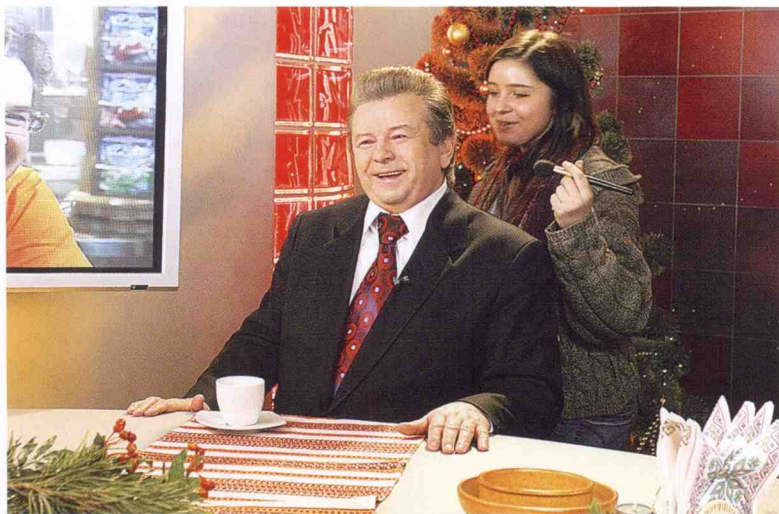
Ректор, що співає, завжди виглядає бездоганно. (Стиліст – Настя Катан).