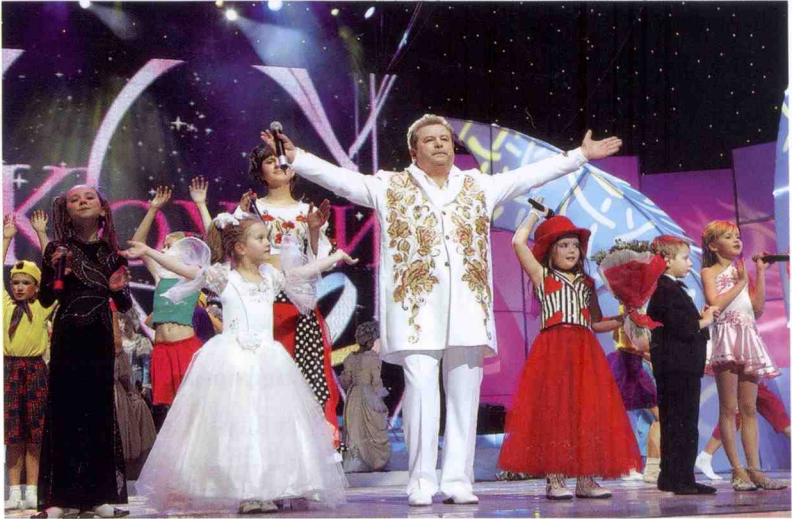
Дитина народжується зіркою. Конкурс “Крок до зірок”, фінальний виступ.