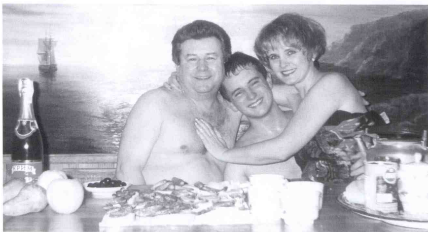
Це щастя, коли близькі люди поруч. Родина Поплавських в селі. Без церемоній.