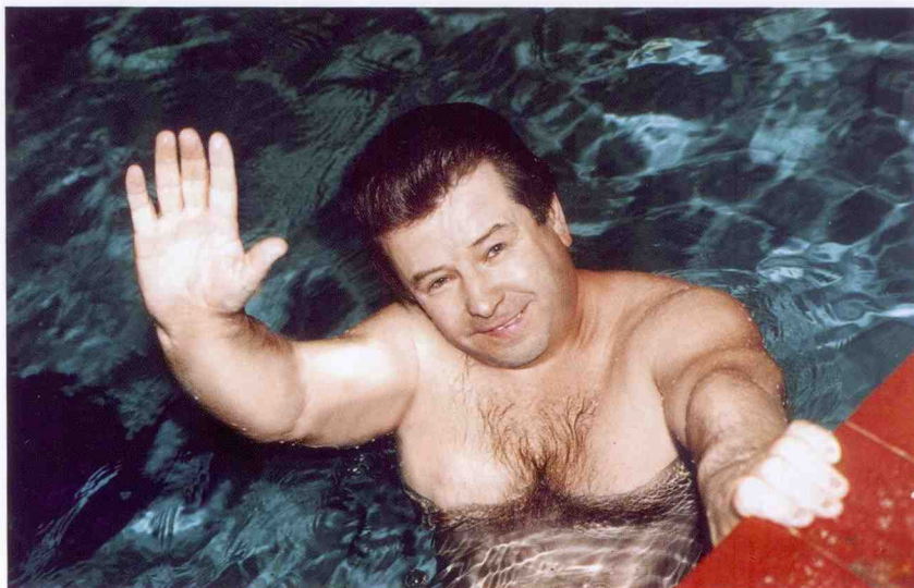
“Поплавок” завжди на плаву...