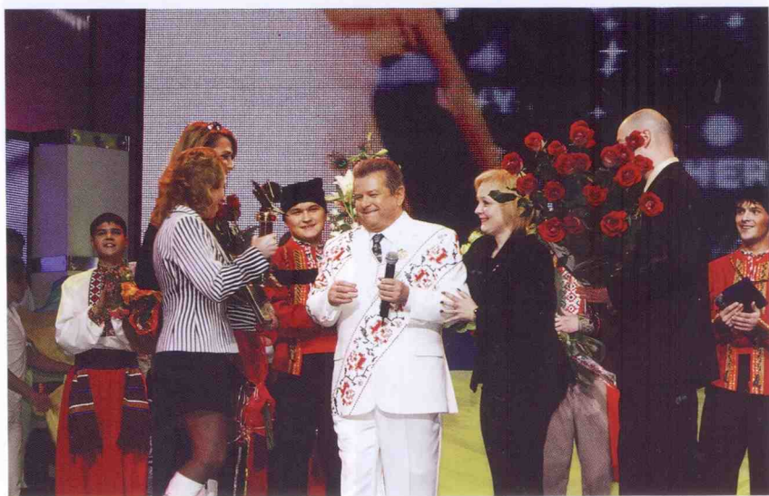
Нагороди — то завжди приємно...