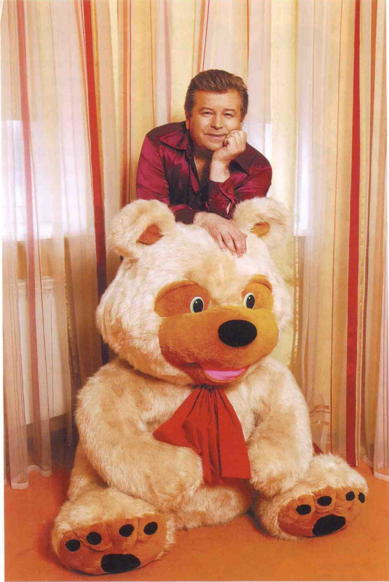
Обидва Михайла дуже люблять комфорт та домашній затишок.