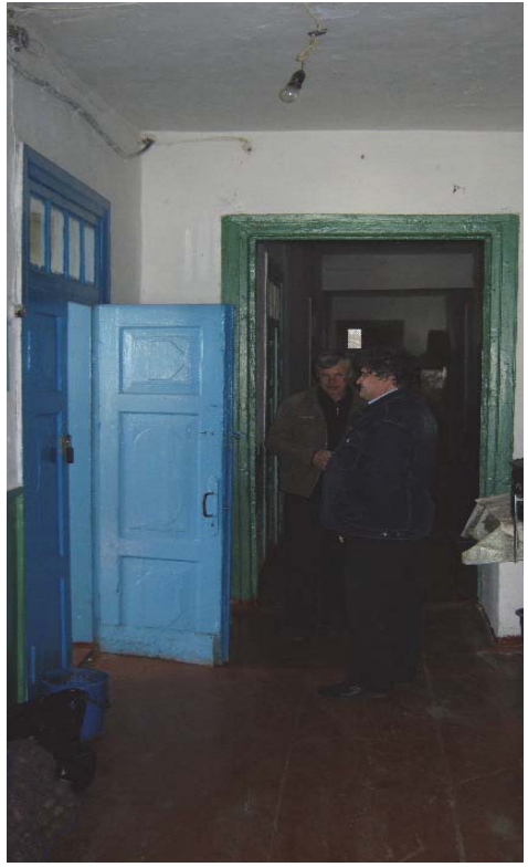
Коридор маєтку Чайковських в Бірках (фото 2011 р.)