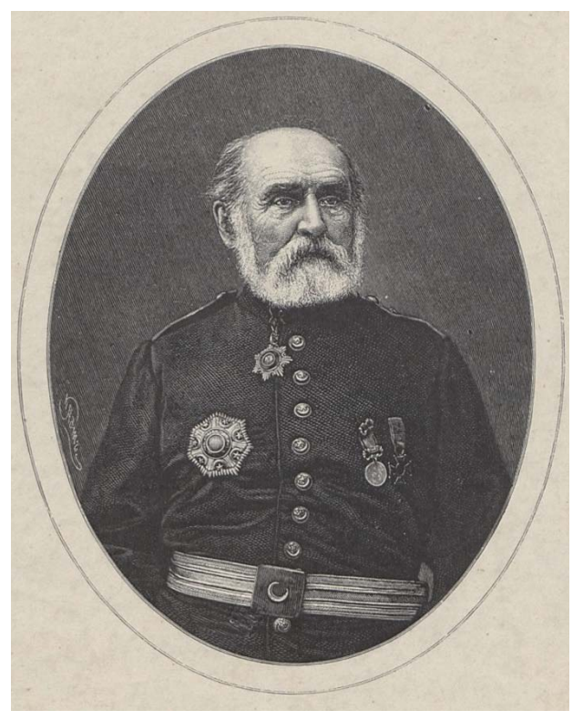
Михайло Чайковський в середині 1870-х рр.