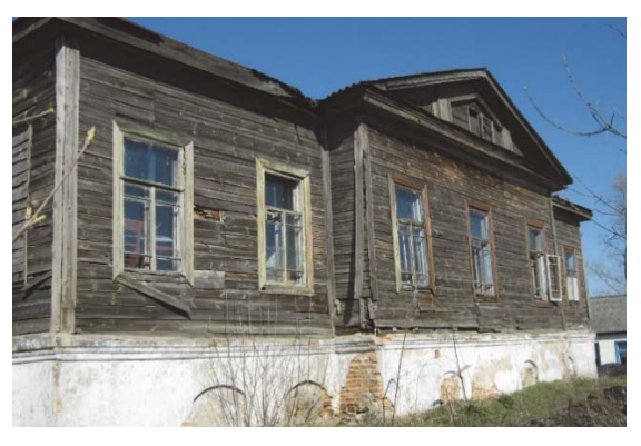
Маєток Чайковський в Бірках, де Михайло помер 5 січня 1886 р. (фото 2011 р.)