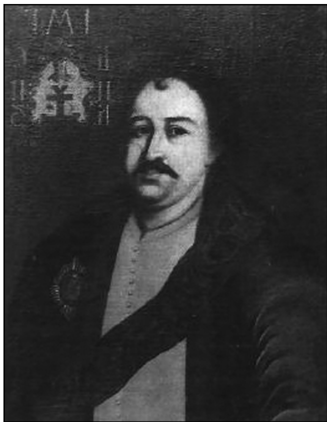
Невідомий художник Лівобережної України.

Маємо велику вдячність представникам старшинських родів, які «складали високу шану пам'яті гетьмана», й, відповідно, потай зберігали оригінальні портрети та їх копії в своїх садибах [24, 96]. Особливо цінними є портрети українських художників, до яких відносимо погрудний портрет І. Мазепи з Національного музею історії України (далі НМІУ) [15]. І хоча портрет зазнав декілька реставрацій, іноді невдалих, що призвело до деформації образу (портретований став дещо огряднішим), він є одним із найкращих зразків українського козацького портретного живопису XVIII ст. На портреті зображено чоловіка середнього віку, без головного убору, волосся та вуса чорні. Одягнений він у темно-зелений жупан та червону сорочку. Через праве плече перекинута синя муарова стрічка ордену Св. Андрія Первозваного, на грудях з лівого боку – орден Білого Орла. У правому верхньому куті герб «Курч» з літерами: І(Іван) М(Мазепа) Г(гетьман) В(війська) Ц(царської) В(величності) Є(його) П(пресвітлого) З(запорозького) [35, 279]. Розвідки щодо походження портрету було проведено істориком М. Грушевським. Він порівняв цей твір із портретами з Гріпсгольмської галереї та із зображенням на гравюрі Д. Галяховського, вказуючи на подібність основних рис, хоча на розглянутому портреті гетьман значно молодший та огрядніший [22, 246-248]. Портрети з вищезазначених джерел були написані в останні роки гетьманування І. Мазепи (портрет із Гріпсгольма зазнав нищівної кри-