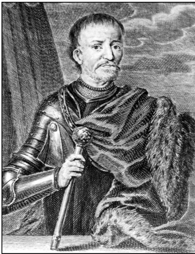
Художник М. Бернігерот.