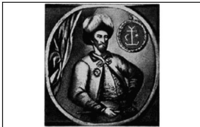
Портрет І. Мазепи / з Літопису С. Величка

Зображення І. Мазепи бачимо на іконі «Покрова Пресвятої Богородиці» з НХМУ [18]. Її було виконано на замовлення племінника І. Мазепи, переяславського полковника І. Мировича у 1708 р. майстром Києво-Печерської лаври (?) [19, 91]. Видатний український поет Т.Г. Шевченко назвав твір «історичною картиною» не випадково, адже на ній зображені відомі історичні діячі: «В цій церкві зберігається чудова історична картина, пензля, можна гадати, Матвеева, якщо не іноземця якого. Картина поділена на дві частини: зверху – покров пресвятої Богородиці, а внизу Петро I з імператрицею Катериною, а навколо них – відомі сподвижники. У тому числі і гетьман І. Мазепа... в усіх своїх регаліях» [44, 24]. Навпроти імператора – Феофан Прокопович, біля государя – придворні