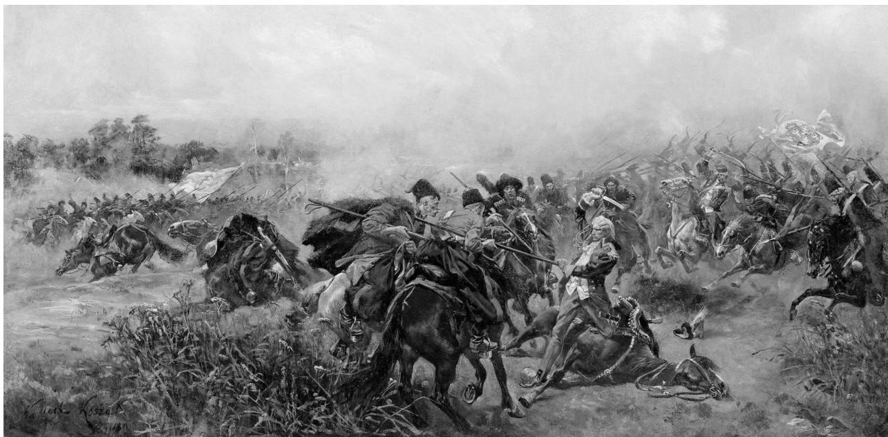
Войцех Коссак, 1891. “Битва під Зеленцями”