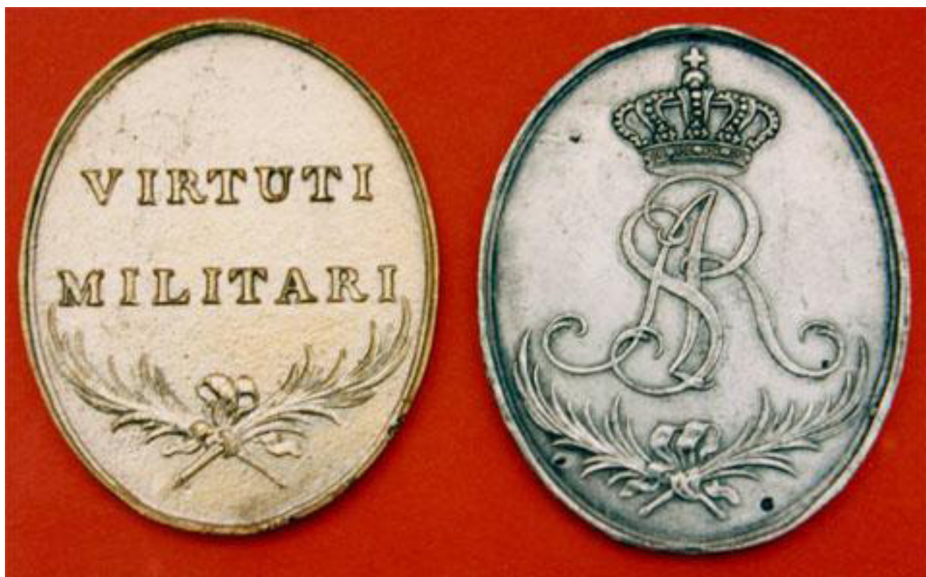
Знак ордена Virtuti Militari, 1792 р.