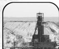
Шахты и рудники Донбасса

Его светлые искрящиеся слова отлились в строки золотой поэзии Украины. Золотыми россыпями сверкают они во всех уголках нашей необъятной планеты Земля. Серебряным звоном летят из края в край веселые и грустные романсы и песни на его стихи.