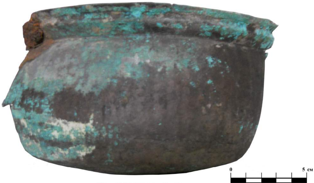
Мал. № 1 Бронзовий казан.