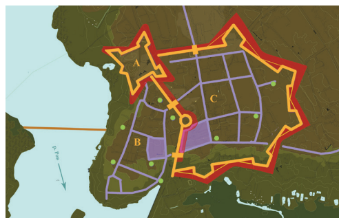
Рис. 4. План укреплений левобережной части Бара на период середины XVI в. Реконструкция О. Пламеницкой