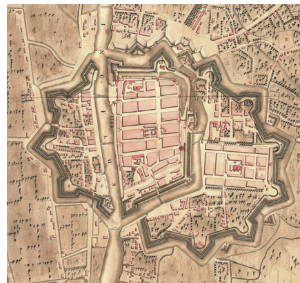
Рис. 2. План Эльблонга начала XVIII в.