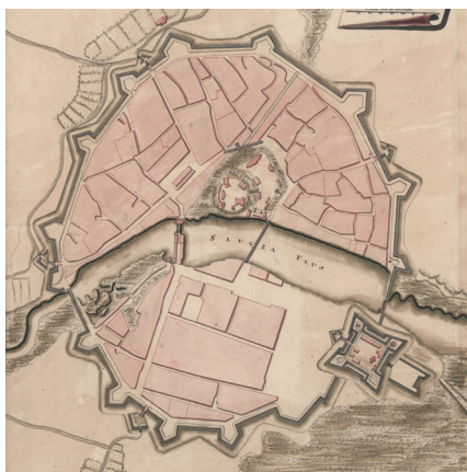
Рис. 3. План Слуцка начала XVIII в.