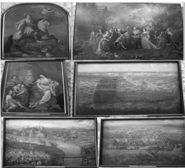
Рис. 3. Картини Мартіна. Фотоколлаж

Використання зазначеного іконографічного матеріалу Національного цифрового архіву (NAC) Польщі, а не оригіналу зображення, зумовлене рядом об'єктивних і суб'єктивних факторів. Кількарічні пошуки картин «Дюпонтівського циклу» привели нас до замку у містечку Шлясхайм неподалік Мюнхена. Тут, у так званій «Новій Пінакотеці», в галереї № 43 і знаходяться картини пензля Мартіна, що є предметом дослідження (Рис. 3, 4), хоча всі джерела подають Національну картинну галерею в Мюнхені. Фотокопії оригіналів полотен французького баталіста, виконані на наше прохання колегами-дослідниками, які відвідували Шлясхайм, мали ряд технічних огріхів. Випадково, саме досліджування картина «Визволення Язловця 1684 р» була скопійована невдало. Сподіваємось, що в скорому часі нам вдасться отримати якісну фотокопію оригіналу полотна.