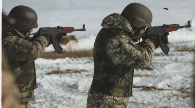
Szkolenie personelu wojskowego Sił Zbrojnych Ukrainy przez Siły Zbrojne Republiki Czeskiej na poligonie w Libawie koło Olomuńca, 10.02.2023