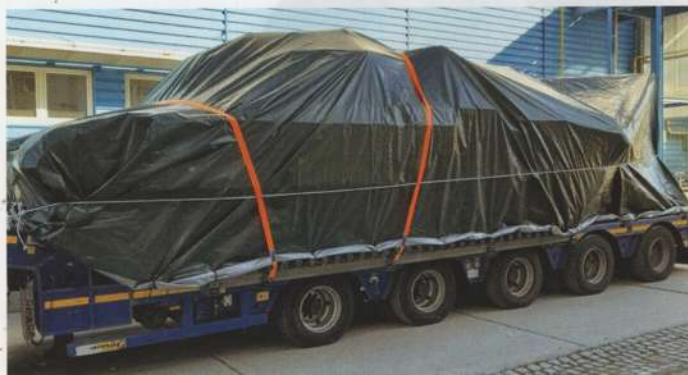
Zapakowany czołg Tomáš. Jego nazwa nawiązuje do imienia pierwszego czeskiego prezydenta – Masaryka

Dla porównania warto zobaczyć obecny stan wybranych typów uzbrojenia czeskich