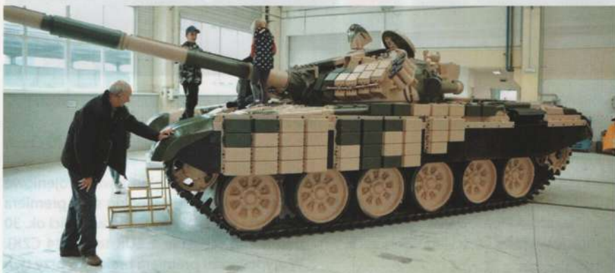
Jeden z przekazanych przez Maroko czołgów T-72M, zmodernizowany przez Excalibur Army