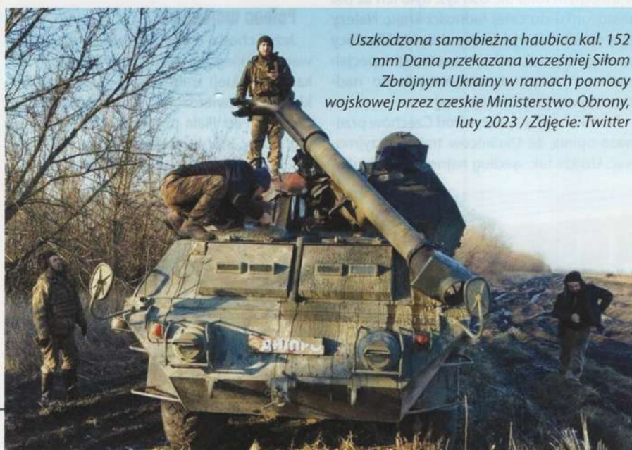
Uszkodzona samobieżna haubica kal. 152 mm Dana przekazana wcześniej Siłom Zbrojnym Ukrainy w ramach pomocy wojskowej przez czeskie Ministerstwo Obrony, luty 2023

Oficjalnie, według słów czeskiego premiera, Ukrainie dostarczono z Czech 89 czołgów, 226 bwp i 38 haubic. Jedna trzecia tego sprzętu – według słów Fialy – pochodziła z magazynów wojskowych. Jednocześnie Kijowowi przekazano 6 systemów obrony przeciwlotniczej i 4 śmigłowce. Fiala wymienił także 900 m konstrukcji mostowych, wspominał też o dostawach czeskiego przemysłu