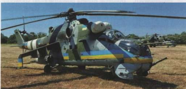
Jeden z 4 przekazanych Ukrainie przez Czechy w 2022 śmigłowców bojowych Mi-24W, już w nowych barwach

Sił Zbrojnych według tych samych źródeł. Prezentuje się on następująco: