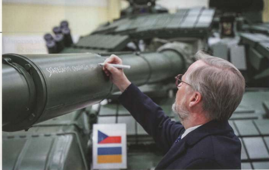
Premier Czech Petr Fiala zapisuje na lufie wyremontowanego i zmodernizowanego czołgu T-72 przesłanie do żołnierzy ukraińskich. Czołg wkrótce zostanie wysłany na Ukrainę

Po roku wojny wciąż wśród Czechów przeważa opinia, że Ukraińców trzeba przyjmować. Uważa tak, według najnowszych badań