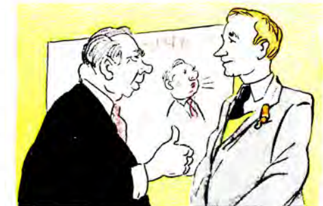
— Хоч і про мене, але сильно написано...