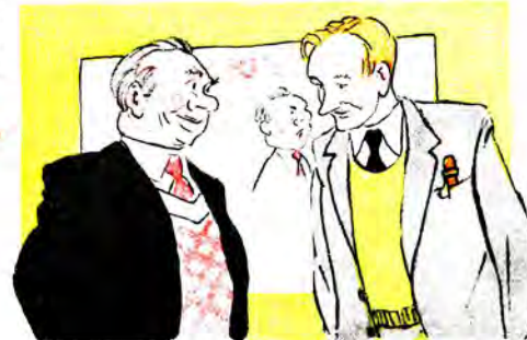
— Приємно було б знати, хто це в нас такий дотепний фейлетоніст? Це ж справжній талант!