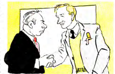
— Дякую за високу оцінку...