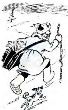
НА БЕРЕЗОВОМУ РИСАКУ.

В багатьох колгоспах листоноші не забезпечені транспортом, і колгоспники одержують пошту з великим запізненням. (3 листів до редакції).