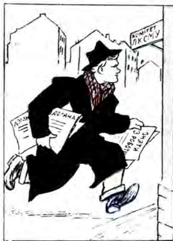
«Швидка допомога» прибула.

Окремі обкоми комсомолу, замість того, щоб допомагати молодим комсомольським працівникам, засипають їх доганами.