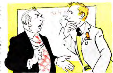
— А, так це ви написали?! Ну, знаєте, з такими здібностями вам у нас не місце...