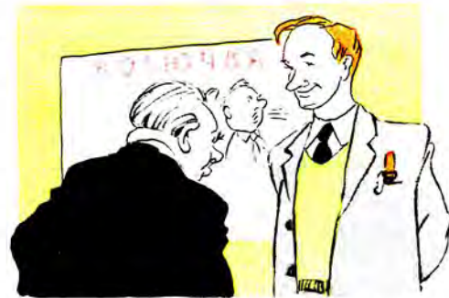
— Цікаво, хто написав цю замітку?