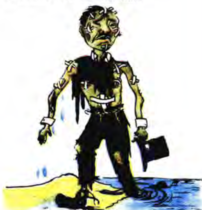
Хрести, здобуті американською ма- ринеткою Лі Син Маном у боях на південь від 38 паралелі.

Мал. В. ЄРМАКОВИЧА (завод імені Кірова, Макіївка).