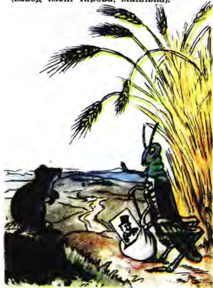
— Куди прямуєш, друже? — В американську зону окупації. Тут нам життя не дають, а там на- шого брата - шкідника на літаках катають.

Мал. В. ЄРМАКОВИЧА (завод імені Кірова, Макіївка).