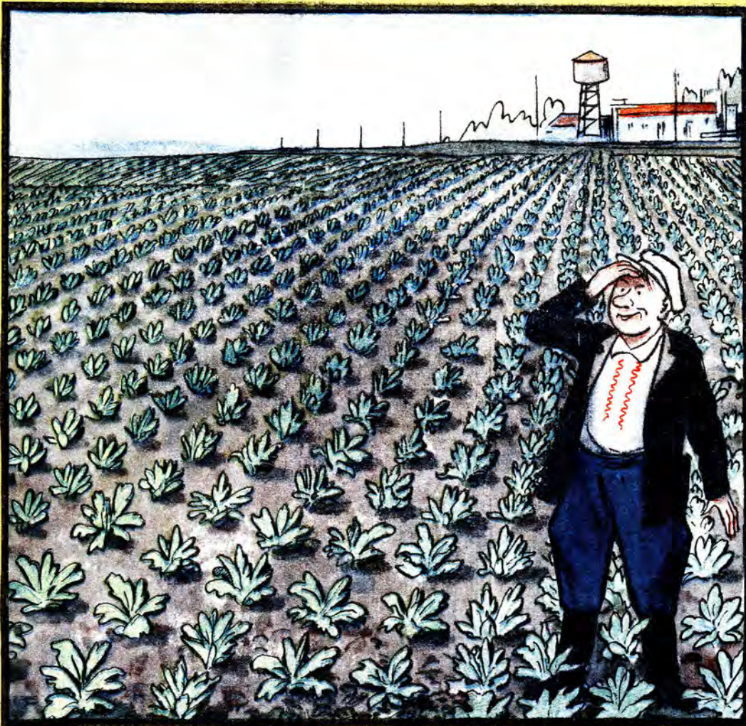
— Яка краса!