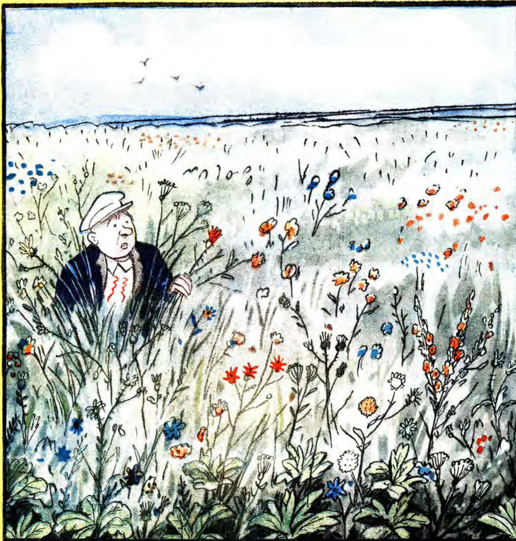
— Яке неподобство!