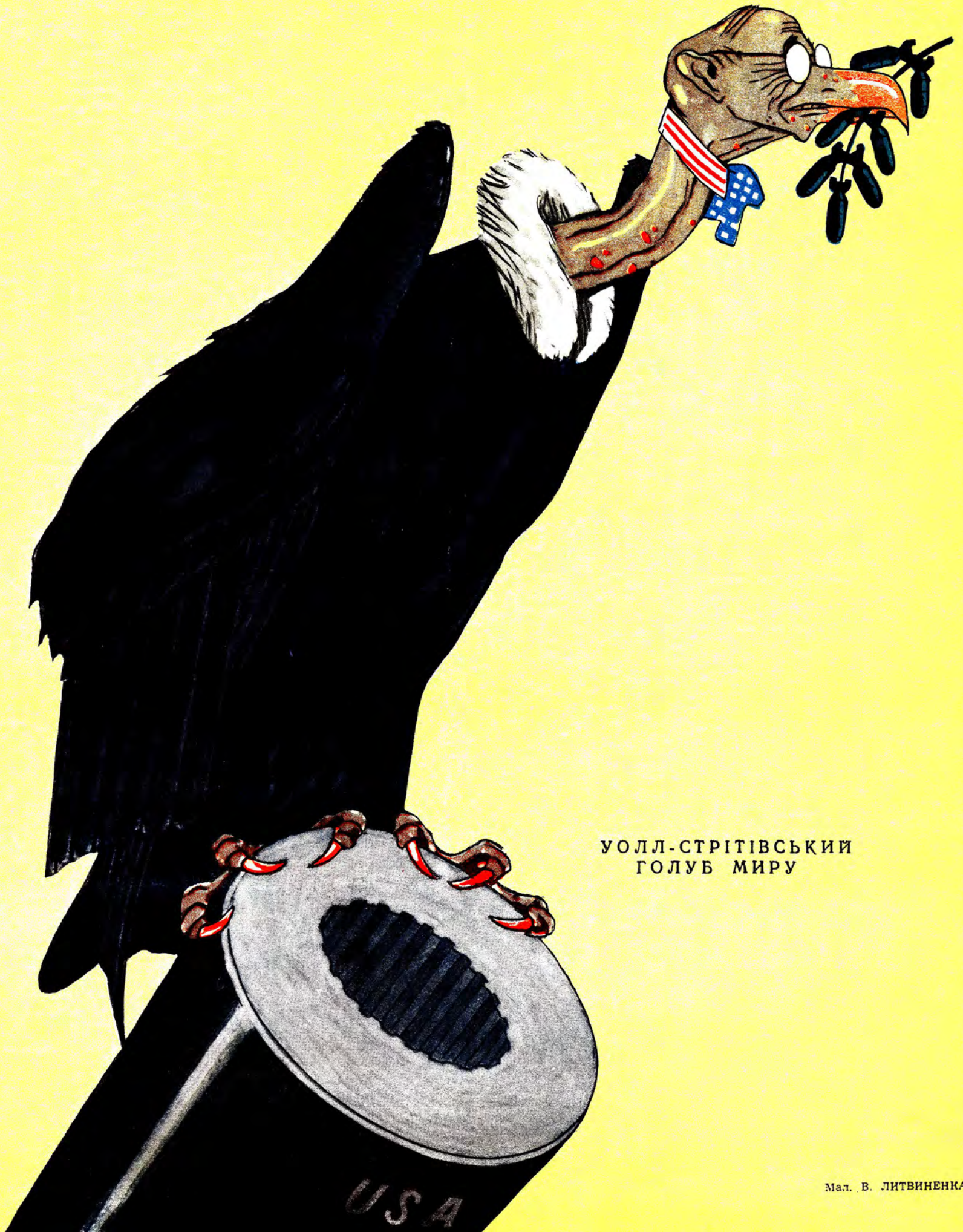
УОЛЛ-СТРІТІВСЬКИЙ ГОЛУБ МИРУ