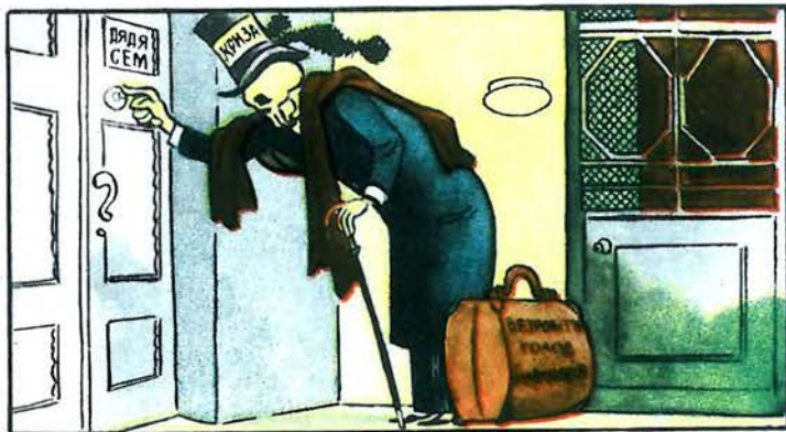
Американський дід-Мороз зразка 1950 року.