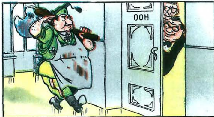
Іспанський дід-Мороз. Як бачить читач, дехто чекає його з нетерпінням.