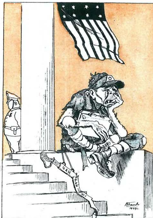
БІЛЯ ПАРАДНОГО ПІД'ІЗДУ