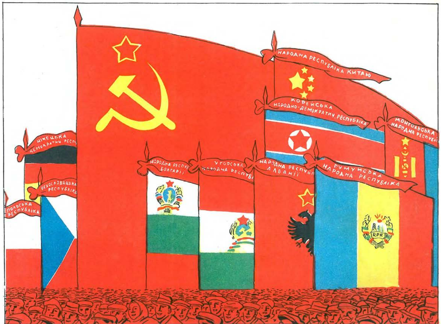
І новорічна дійсність.