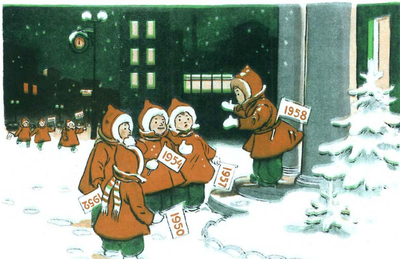
1958 РІК: — Запізнилися, друзі! Тут і мене вже не приймають...