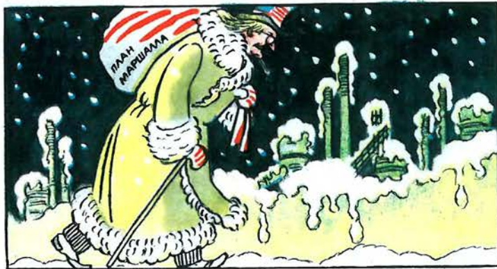
Дід-Мороз заокеанського походження. Дуже моторний. Заморозив економіку всієї Західної Європи.