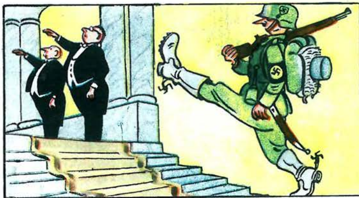
Боннський дід-Мороз. Хто він і що він — ясно без слів.