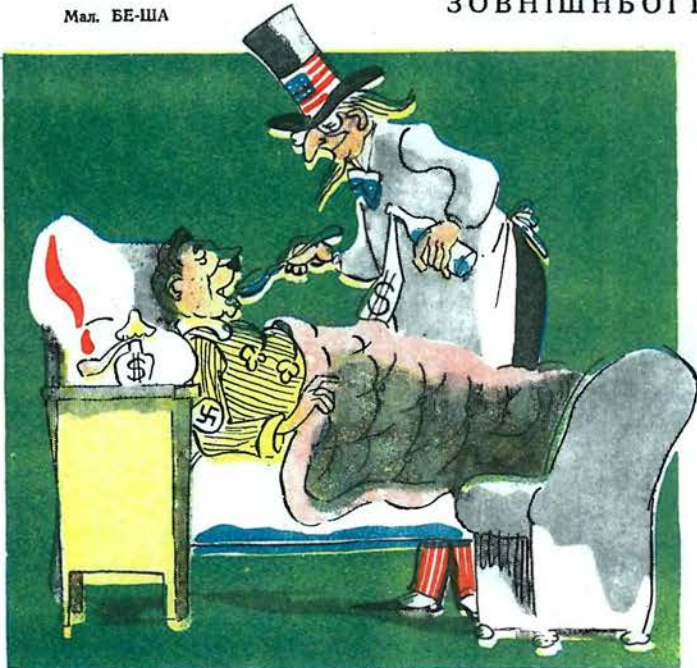
1. «Ми будемо здійснювати програму відновлення Європи».