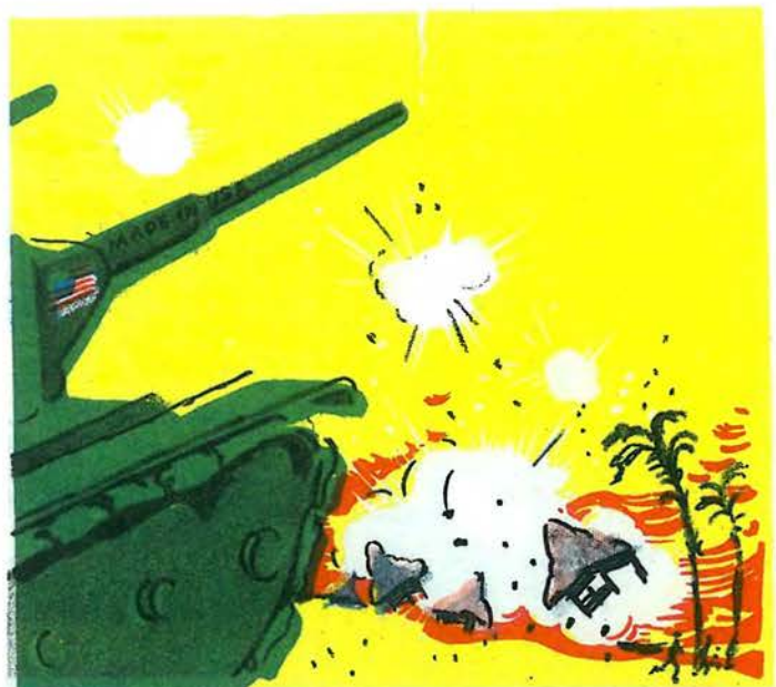
4. «Ми будемо знайомити відсталі народи з досягненнями американської науки й техніки».