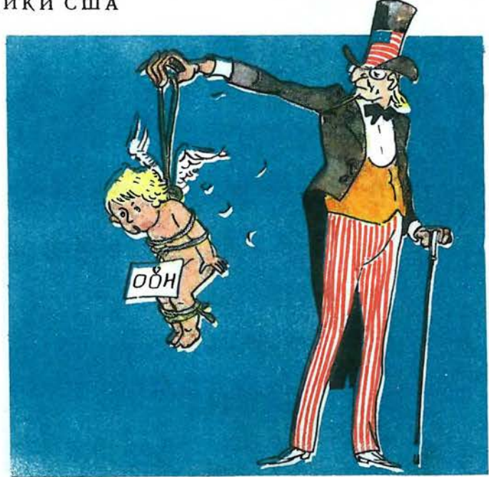
2. «Ми будемо підтримувати Організацію Об'єднаних націй».